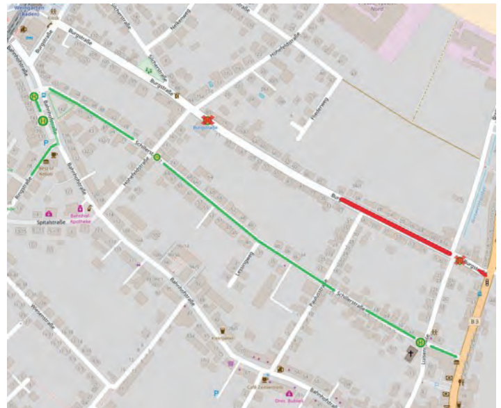
Grün: Busstrecke während der Baumaßnahmen Rot: Vollsperrung und Ausführung Baumaßnahme

Aktuelle Informationen hierzu finden Sie ebenfalls auf der Homepage der Gemeinde Weingarten ( www.weingarten-baden.de ). Änderungen werden wir rechtzeitig in der Turmberggrundschau und auf der Homepage veröffentlichen. Gerne bekommen Sie auch eine telefonische Auskunft zur Baumaßnahme.