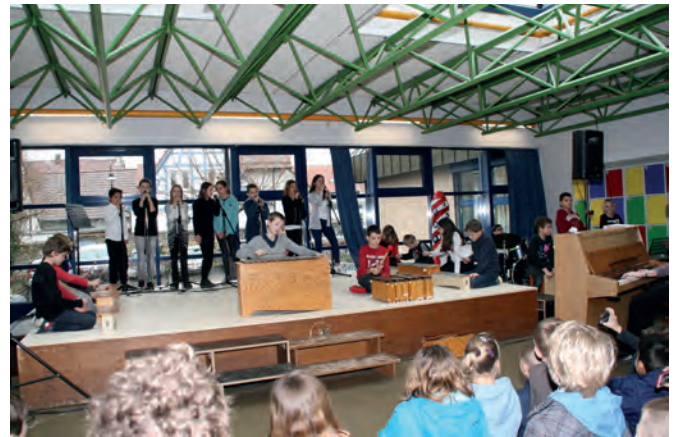
Archivbild von musikalischen Darbietungen beim Tag der Offenen Tür

Wie auch in den vergangenen Jahren wurde der Tag der Offenen Tür mit einem bunten Programm eröffnet, in dem Schülerinnen