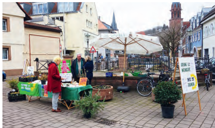
Infostand Grüne Liste: Blühende Gärten - blühende Landschaften

Am vergangenen Samstag Vormittag veranstaltete die Grüne Liste Weingarten wieder einmal einen Infostand zum Thema Blühende Gärten & blühende Landschaften. Viele Passanten interessierten sich für das Thema und erhielten ein Päckchen Saatgutmischung „Blühende Landschaften“ Region Süd zur Aussaat im Garten oder auf Terrasse und Balkon.