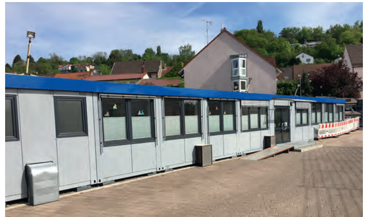
Container in der ersten Ausbaustufe