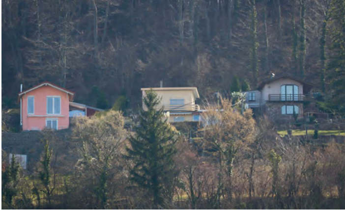
Mehrstöckige Wohnhäuser entsprechen weder dem Charakter eines „Wochenendgebietes“, noch den alten- oder neuen Bebauungsplänen

mittels Abbruchverfügungen vorzugehen. Bereits 2009 hatte die WBB mit einem interfraktionellen Antrag einen 8 Jahre (!) währenden Bebauungsplanprozess eingeleitet, der erst vergangenen Sommer nach etlichen Kompromissen zum Abschluss gebracht wurde. Nun werden wohl weitere Jahre ungenutzt ins Land ziehen, bzw. weitere Bauten errichtet.