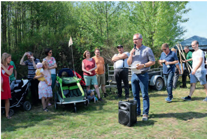
Zahlreiche Eltern warteten bis sie in der Reihenfolge des Geburtsdatums ihres Kindes an der Reihe waren