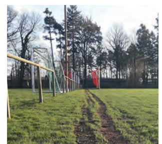
Kurz vor dem letzten Schritt zur Inbetriebnahme