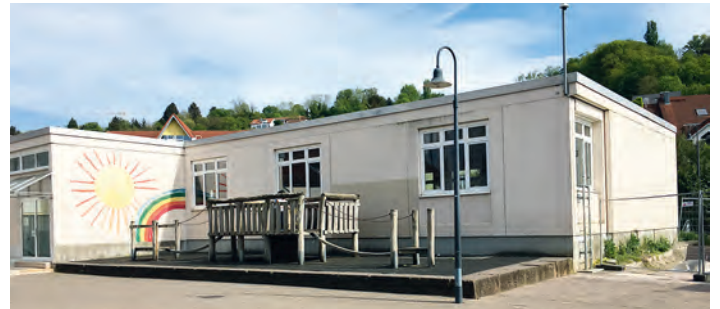
Aufstockung des E-Baus möglich und sinnvoll?

Wolfgang Wehowsky (Fraktionsvorsitzender)