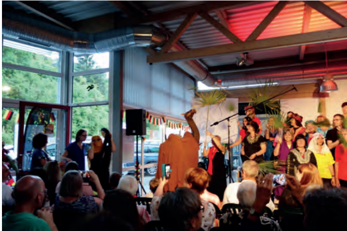
Ein störrisches Kamel vor Fata Morgana

Der Gruppensieg ist mit diesen Konzerten somit sicher - jede/jeder Einzelne hat alles gegeben und die Mannschaft hat fair gespielt.