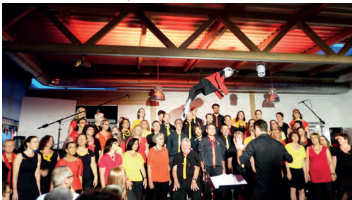
Major Tom schwebt über den Dingen