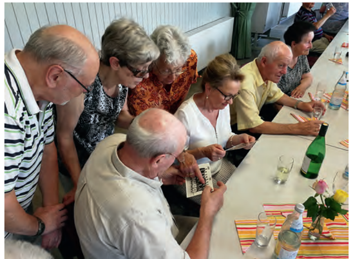
Reges Interesse an Fotos und Dokumenten