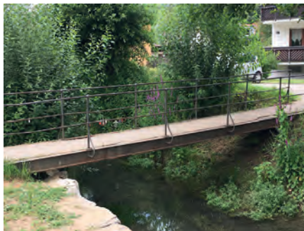
s' Brücke an der Heidengaß

Durch unser Weingarten fließt der Walzbach. Deshalb liegt es auf der Hand, dass zahlreiche Brücken zwangsläufig über diesen Bach führen müssen. Darüber hinaus existieren auch noch weitere Brücken bei Kanälen und z. B. in der Ungeheuerklamm. Eine erstmalige intensive Inspektion dieser Brückenbauwerke durch ein vom Ortsbauamt beauftragtes Ingenieurbüro hat nun die Feststellung von teilweise gravierenden Mängeln ergeben, die die Gemeinde in der Zukunft mit weiteren Ausgaben belasten werden. Von insgesamt 65 untersuchten Bauwerken sind lediglich 6 in sehr gutem, aber vier in ungenügendem Zustand. Für die SPD-Fraktion liegt es