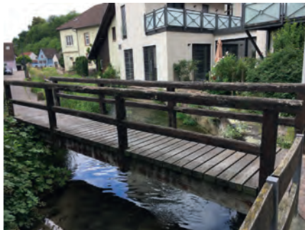
Holzbrücke an der Brunnenstraße

auf der Hand, dass Brücken mit höchster Schadensbewertung, die zudem die Verkehrssicherheit beeinträchtigen, aus haftungsrechtlichen Gründen saniert werden müssen. Ein Ersatzneubau bei drei Brücken - wie vom Gutachter vorgeschlagen - sollte aber vor Vergabe sorgfältig geprüft werden. Der vom Ingenieurbüro präsentierte Kostenplan über die Instandsetzungsmaßnahmen für die nächsten 3 Jahre von rund 1,5 Mio. € ist aus Sicht der SPD-Fraktion im Hinblick auf die angespannte Haushaltslage nicht zu schultern. Deshalb sollte jetzt nur das Notwendigste in Angriff genommen werden. Darüber hinaus müssen historische Brückenbauwerke mit Geländer erhalten bleiben.