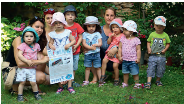
Die „Fizzlipuzzlis“ aus dem „Blauland“ wünschen sich einen motorisierten Bus