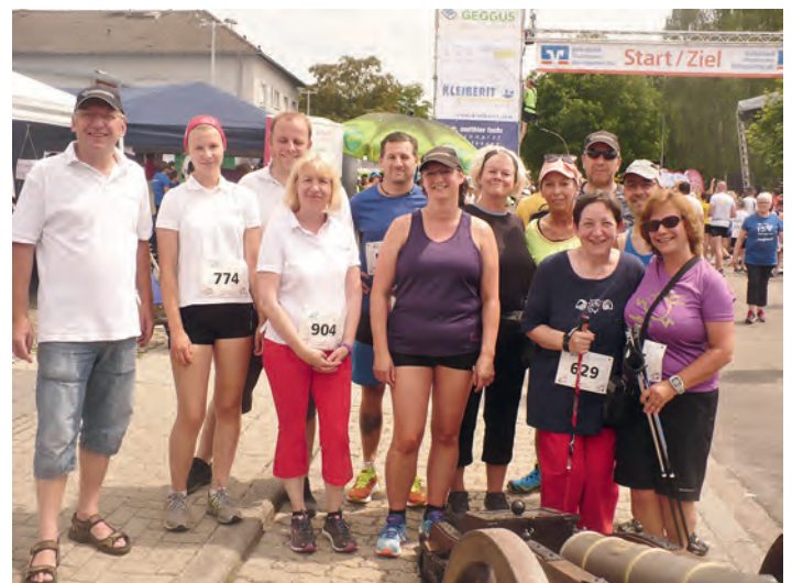
Das Läuferteam der Weingartner Schützen.