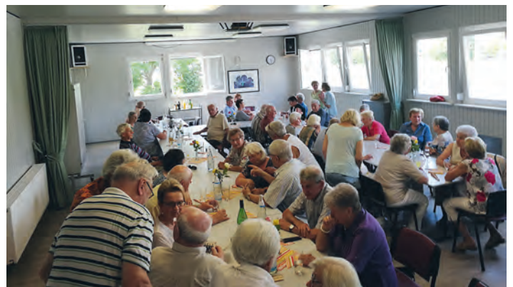
Ein gut besuchter TSV-Seniorenmittag

Am 10. Juni ludt die Vorstandschaft zahlreiche Seniorinnen und Senioren zu einem gemütlichen Kaffeemittag in das AWO-Haus ein. Viele dem Verein verbundene ältere TSV-Mitglieder nutzten die Gelegenheit, sich wiederzusehen und vor allem in Erinnerungen zu schwelgen. Fotos aus vergangenen Zeiten spielten da eine wichtige Rolle und regten zu Gesprächen und Austausch an. Kaffee, Kuchen, Laugenstangen und Erfrischungsgetränke wurden mit Genuss verzehrt. Unsere Seniorinnen und Senioren hatten einen schönen, zwanglosen und geselligen Nachmittag verbracht. Danke an die Helferinnen und Kuchenspendern.