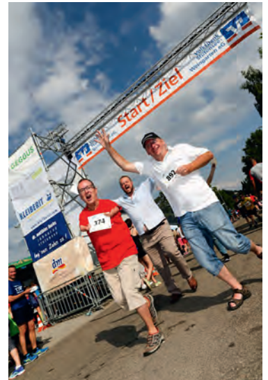
Aktiv gegen den Krebs - 1500 Läufer machten mit.

Das war wieder ein Hammerereignis. 1.500 Läufer, so viele wie noch nie zuvor, haben am 13. Weingartner Lebenslauf teilgenommen. Jung und Alt haben sich dabei zusammen getan und sind gemeinsam über 11.400 Runden für einen guten Zweck gelaufen - eine solche Solidarität sucht seinesgleichen. Auch der Schützenverein Weingarten nahm mit einem Läuferteam am Lebenslauf teil. Damit setzte er sich aktiv gegen den Krebs ein und zeigte auf diese Weise seine Verbundenheit den Betroffenen. Frei nach dem Motto „das Glück kann man nicht kaufen, aber zum Glück kann man laufen“ sagen wir allen Läufern und Helfern vielen vielen Dank. Ihr ward großartig.