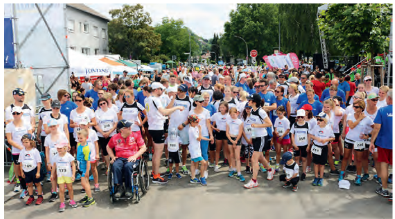
„Lauftreff Michelin“ hat den Titel „größte Läufergruppe“ knapp verfehlt und wurde mit 153 Startern Zweite

Der „Weingartner Lebenslauf“ war auch in diesem Jahr wieder ein voller Erfolg. Susanne Bognner, Mitarbeiterin im Team, teilt mit: exakt 1.500 Läufer waren am Start und haben 11.431 Runden zurückgelegt. Die älteste war 90 Jahre, die jüngste, selbst laufende Teilnehmerin zwei Jahre. Die größte Gruppe war die Gruppe „Nils“ mit 209 Läufern und 1.658,5 Runden, gefolgt von „Lauftreff Michelin“ mit 153 Startern und 1.560,5 Runden und „TSV Weingarten“ mit 117 Läufern und 999,5 Runden. Der Spendeneingang stehe noch nicht fest, berichtet sie, denn ein Großteil der Sponsoren überweise die Beträge erst in den kommenden Tagen. Aber laut Angaben der Läufer sollten genügend Spenden zusammenkommen, um 1000 neue Typisierungen (eine Typisierung kostet 40 Euro) finanzieren zu können. In diesem Jahr habe „B.L.U.T.“ bereits 2.700 neue Stammzellenspenden gewonnen.