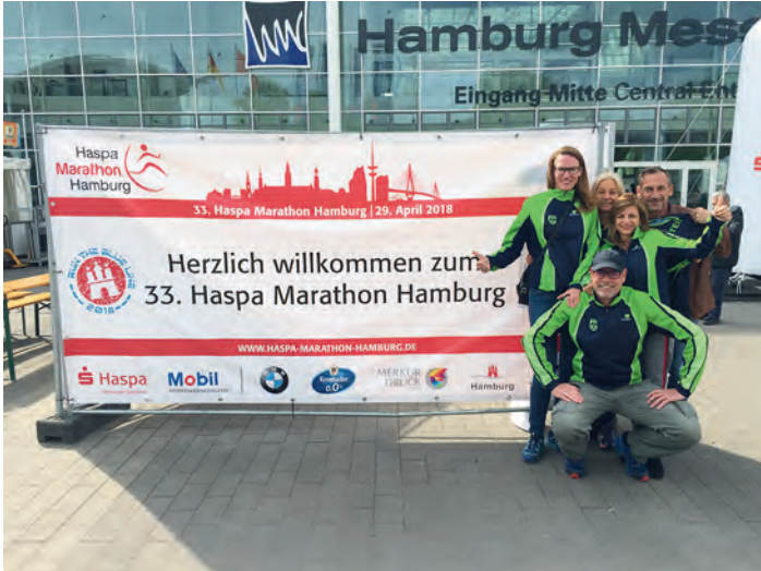
Marathon in Hamburg