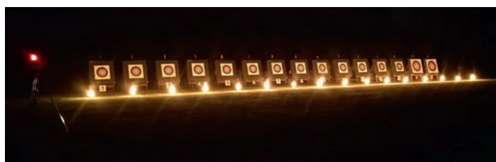
Zielscheiben nur mit Fackeln erleuchtet.