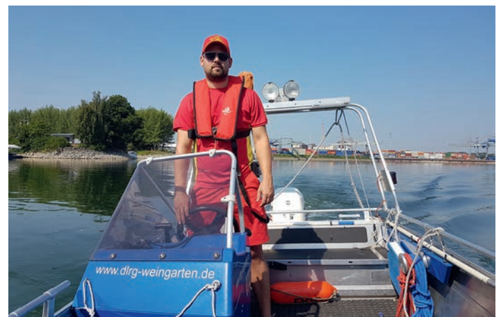
Bootsausbildung auf dem Rhein

Am vergangenen Samstag trafen sich Bootsführer bereits um 7:30 Uhr an der Wache um das Boot transportfähig zu machen. Kurz darauf ging es in Richtung Pionier-Hafen los um das Motorrettungsboot zu slippen. Anschließend wurden verschiedene Übungen wie z.B. Boje-über-Bord Manöver, Wenden auf engstem Raum und An-/Ablegen als Vorbereitung auf die anstehende Bootsführerprüfung geübt. Nach einer kurzen Pause in Speyer ging es wieder zurück zur Slippstelle und danach an den heimischen See.