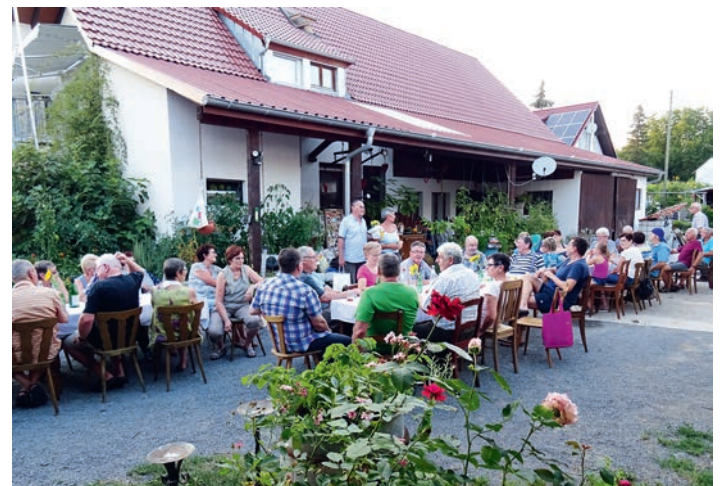
Sommertreff des GV Frohsinn im Sallenbusch