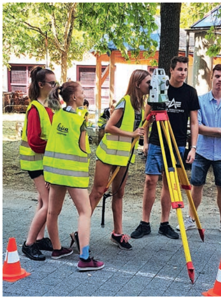
Schülerinnen und Schüler der Kl. 8a erhalten erste Einblicke in die Arbeit als Vermessungstechniker

Im Foyer hatten viele Schulen ihre Infostände aufgebaut, an denen sich die Schülerinnen und Schüler über die Möglichkeiten der Aus- und Weiterbildung informieren konnten. Ergänzend zum Angebot der Schulen, hat das Landratsamt über seine verschiedenen und auch vielfältigen Ausbildungen in Kurzvorträgen informiert. Das Besondere dabei war, dass Azubis diese Vorträge hielten und dadurch hautnahe Einblicke in ihre jeweilige Ausbildung geben konnten. Danach haben wir noch die Heinrich-Hübsch-Schule besucht, an der an diesem Tag die „Geolympia“ stattfand. Hier konnten die Schülerinnen und Schüler in unterschiedlichen Stationen Einblicke in die Arbeit als Vermessungstechniker erhalten.