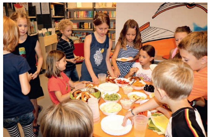
Obststückchen, Brezel und eine spannende und lustige Geschichte - besser geht's nicht