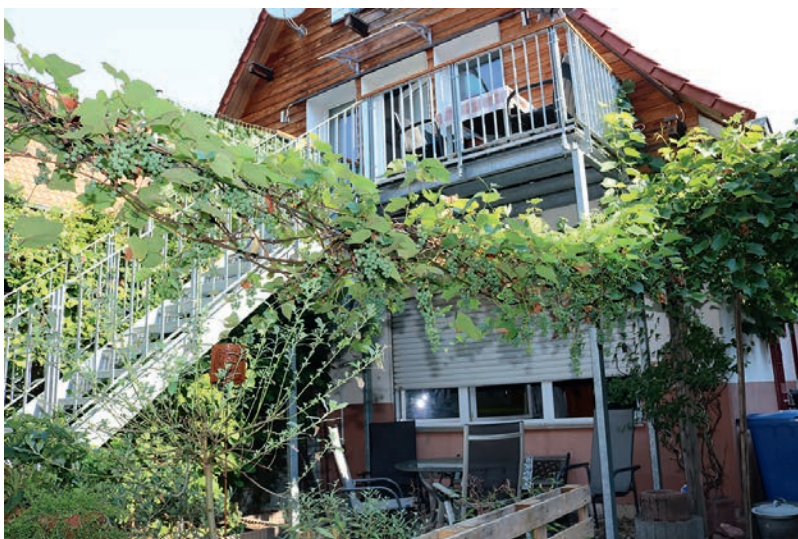
Haus von außen: ein lauschiges Ambiente mit grünen Weinreben