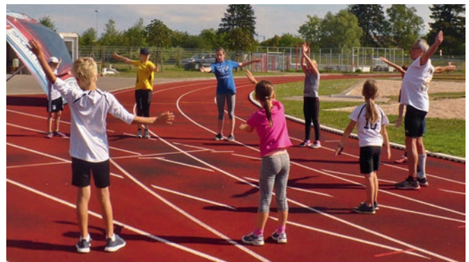
Leichtes Aufwärmtraining mit gegengleichem Armkreisen.