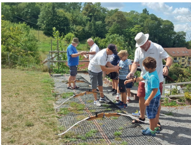
Vorbereitung und Einweisung zum Bogenschießen.

Auch in diesem Jahr, und das zum 29. Mal, hat sich der Schützenverein Weingarten beim Ferienspaßprogramm der Gemeinde Weingarten beteiligt. Rund 20 Mädchen und Jungen im Alter von 8-12 Jahren konnten am 11.08. die verschiedenen Sportarten des Vereins kennenlernen. Im Vordergrund stand das Bogenschießen, um aber auch das Gewehrschießen zu vermitteln – das Luftgewehrschießen