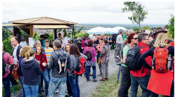
30. Weingartener Weinwandertag am 02.09.