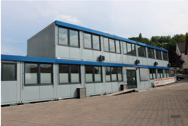
Binnen von drei Tagen war die komplette Aufstockung der Unterrichtsräume vollzogen. Rund 100 Kinder beginnen in diesen beiden Stockwerken das neue Schuljahr.

Die steigenden Schülerzahlen der Turmbergschule hatten bereits im Sommer 2017 die Aufstellung einer Containeranlage als Übergangslösung erforderlich gemacht. Der erste eingeschossige Teil enthält drei Klassenzimmer und sanitäre Einrichtungen einschließlich ei-