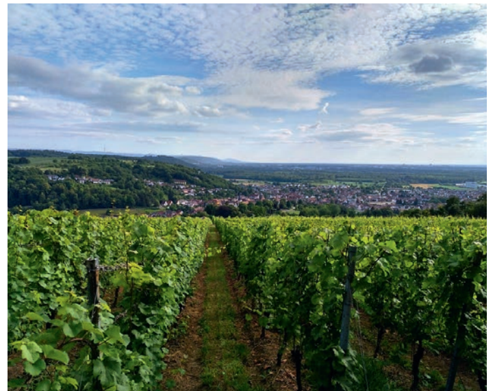
Noch schöne Ferien wünscht der GV Frohsinn!

Samstag, 15. September 2018: Tagesausflug ins Elsass, nach Lothringen und in die Pfalz.