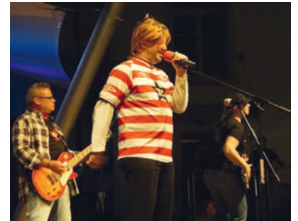
Hitparade des MV Weingarten am 01.09.

Am Sonntag, den 02.09. ist wie jedes Jahr ganz Weingarten auf den Beinen, um auf den Katzenberg und den Kirchberg zu wandern. An mehreren Probierständen können Sie sich die Weine der Weinmanufaktur Weingarten und der WG Schliengen schmecken lassen. Ab 10:30 starten im Grundschulhof geführte Touren , bei denen Winzer und Weinexperten den Weinbau in Weingarten vorstellen. Natürlich kann jeder auch auf eigene Faust von Probierstand zu Probierstand wandern. Ein praktisches Probierset (0,1l Probierglas mit passendem Halter) können Sie im Grundschulhof oder an den Probierständen erwerben. Parallel sorgen ab 11:30 Uhr befreundete Orchester der Region auf dem Rathausplatz für gute Stimmung. Dort können Sie den Tag bei Speis und Trank noch gemütlich ausklingen lassen. Neben alkoholfreien Getränken bieten wir natürlich auch dort die Weingartener Weinspezialitäten an.