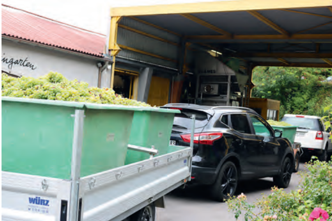
Gute Qualität und kerngesunde frische Trauben sind für die Anlieferer Bedingung für eine Weiterverarbeitung im Winzerkeller

nach dem anderen hoch und kippt den Inhalt in die Traubenschneidmühle. Bis zu 25 Tonnen in der Stunde kann das Ungetüm verarbeiten. In Minutenschnelle sind Beeren und Stiele getrennt,