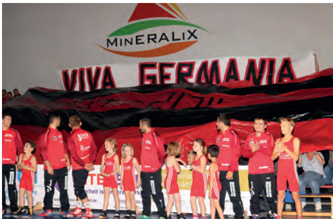
„Viva Germania“ soll es auch in der neuen Saison heißen. Die Fans vom „Walzbach-Inferno“ werden wieder mit dabei sein

„Wir wollen wieder vorne mitmischen, unser Ziel ist das Finale“ lautet die Parole. Nach einer nicht ganz zufriedenstellenden ersten Saison in der DRL, an deren Ende die erfolgsverwöhnten Germanen zum ersten Mal seit der Bundesligasaison 2012/13 das Finale verpasst haben, ist die Gemütslage in der Vereinsspitze wieder hoffnungsvoll. Die Mannschaft hat immerhin einen versöhnlichen dritten Platz erreicht. Jetzt richten sich die Blicke mit frischem Mut nach vorn. Und gleich zu Beginn warten zwei große sportliche Herausforderungen gegen die beiden letztjährigen Finalisten.