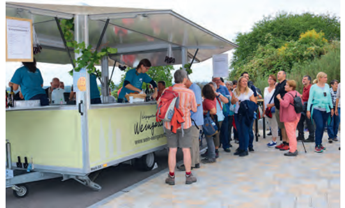
Der neue Hochbehälter bietet einen tollen Platz für einen Weinstand. Gut anfahrbar für den Nachschub, viel Platz für die Gäste und eine Toilette

Unterwegs berichtete Holzmüller, Nordbaden sei im Vergleich zu Südbaden ein wesentlich kleineres Weinanbaugebiet und 90 Prozent der Rotweine in Nordbaden seien Spätburgundertrauben. Den gab es zwar am ersten Stand zu verkosten, aber an Stelle des schweren Rotweins war die frischere Variante Rosé wesentlich mehr nachgefragt. Im Weitergehen berichtete Holzmüller, die Lese habe mit den frühen Sorten Auxerrois und Müller-Thurgau schon begonnen. Müller-Thurgau sei eine Zeitlang zurückgegangen, habe aber unter dem Namen „Rivaner“