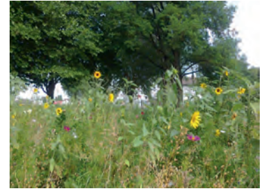
Eines der Themen der Grünen Liste Weingarten: Blühende Landschaften, hier hinter der Walzbachhalle