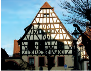
Der vorbildlich renovierte Fränkische Hof im Ortszentrum steht im Mittelpunkt des Tags des offenen Denkmals am Sonntag in Weingarten.

both in den Jahren 1979 bis 1985 vorbildlich und liebevoll renovierte denkmalgeschützte Anwesen steht ab 11 Uhr allen interessierten Einwohnern und Denkmalfreunden aus nah und fern zur Besichtigung offen. Es gibt dort im Obergeschoss der Scheune und auf dem gesamten Areal vieles Interessantes zur Historie und zur Entwicklung bis heute zu sehen.