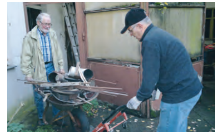
Hilfe beim Entrümpeln

Oder Sie haben in den Ferien Energie getankt und möchten Ihre Fähigkeiten anderen zur Verfügung stellen. In jedem Fall rufen Sie uns an unter folgender Telefonnummer 0176 435 140 43