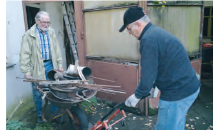
Hilfe beim Entrümpeln