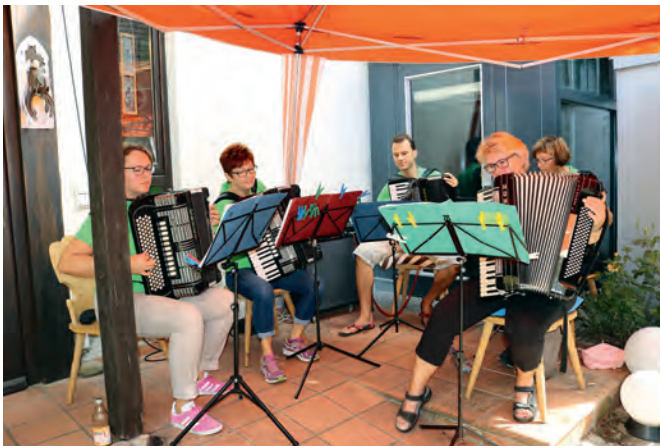
Der Akkordeonspielring unterhielt die Gäste mit bekannten und ansprechenden Melodien