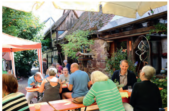
Zahlreiche Gäste ließen sich die Bewirtung schmecken und genossen die milde Spätsommersonne