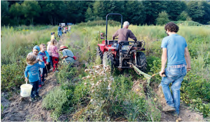
Kartoffelernte mit Kindern

Große, kleine, dicke und dünne Kartoffeln. Alle landeten in den Kisten und nebenbei erfuhren die Kinder etwas über die Pflanze und deren Anbau.