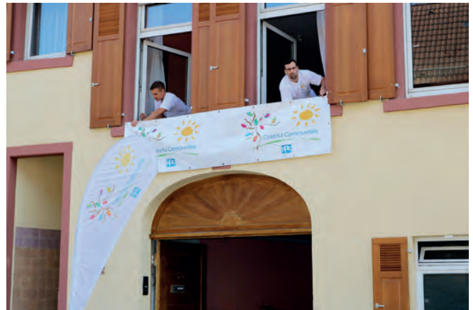
Zwei Mitarbeiter von PPG Weingarten hängen ein Transparent auf, das auf die Aktion hinweist

etwas anzupacken. Sie schleppten Stühle und Tische aus den Räumen und leisteten alle zeitintensiven Vorarbeiten wie Abschleifen, Abkleben, Vorreinigen für das große Renovieren. Danach rücken Profis ein und bringen die Farbe an. Dafür und für das notwendige Material hat PPG einen Betrag von 50.000 Euro bereitgestellt. An einem zweiten Aktionstag am 25. September werden noch kleine Restarbeiten und einige gestalterische Pinselstriche erledigt. Am 26. September soll der Abschluss der Arbeiten mit einem Fest gefeiert werden.