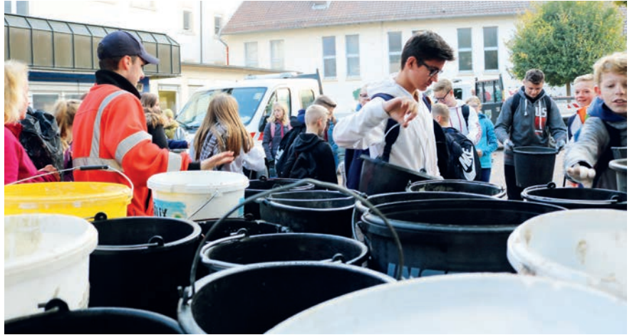
Mit Eimern bewaffnet zogen die Schülerinnen und Schüler los, um die Außenbezirke von Weingarten von Müll zu befreien.