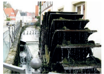
Das Wasserrad am „Gailbumber“ erinnert an die lange Mühlentradition Weingartens und soll nach seinem Stillstand wieder zum Laufen gebracht werden.

In früheren Zeiten gab es entlang des Walzbachs fünf Mühlen. Bereits im Jahr 1443 wurden drei Mühlen urkundlich erwähnt, darunter auch die so genannte untere Mühle beim „Gailbumber“. Deshalb kann Weingarten auch auf eine lange Mühlentradition zurückblicken. Daran erinnert unübersehbar das im Jahre 2002 auf Initiative des Bürger- und Heimatvereins errichtete Wasserrad am Kirchplatz.