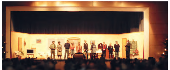
Weihnachtsfeier des GV Frohsinn in der Walzbachhalle (Archivbild)

Die Weingartener Bevölkerung ist herzlich eingeladen, mit uns einen unterhaltsamen Advent-Abend zu verbringen. Wir freuen uns sehr auf Ihren Besuch.