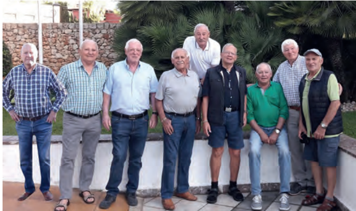
Mitgl. Kegel-Club 58 von links :