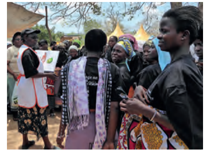
Frauen informieren sich über Familienplanung