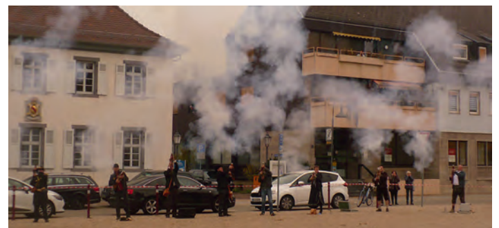
Ehrensalue der Böllerschützen des Schützenkreis 11 Bruchsal.