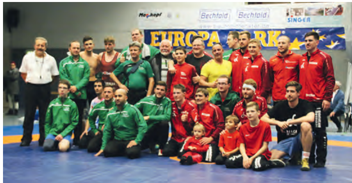
Verbandsliga: SV Germania Weingarten und der KSV Östringen