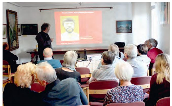
Der Homo heidelbergensis

In allen Kriegen seit der römischen Besiedlung sei der Kraichgau Durchgangsland gewesen und habe darunter oft gelitten. Von der Christianisierung durch irisch-schottische Mönche zeugen heute noch die Michaelsberge in Untergrombach und Clebronn, wo anstelle