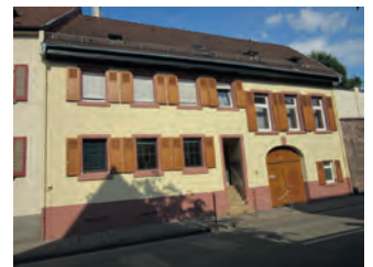
Bild: Ein wahres Schmuckstück ist das Anwesen Bruchsaler Straße 12

Es werden Deutsch- und Computerkurse angeboten und zwanglose Begegnungsabende zwischen Weingartenern und Flüchtlingen. Ein zentraler Ort wird die Küche sein, die von Helfern des Freundeskreises mit viel Eigenleistung und gespendeten Teilen umgebaut wurde. Hier bekommen Flüchtlinge Gelegenheiten, die Speisen Ihrer Heimat zu kochen und zum Probieren anzubieten.