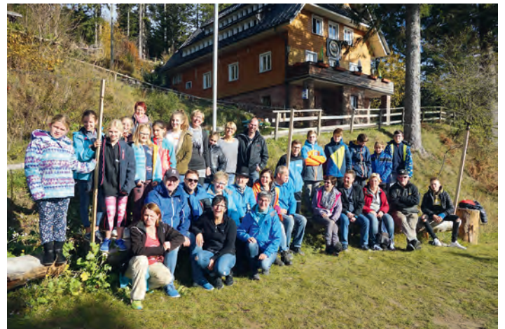
Wander-Wochenende Badener Höhe

Nach einem ausgiebigen Sonntags-Frühstück machten wir uns auf den Heimweg nach einem gelungenen Wochenende, dass sicher nicht das Letzte seiner Art war. Wir hatten enorm viel Spaß und stellten wieder fest, wie wunderschön der Schwarzwald ist und wie toll und wertvoll, dass man es in der Gemeinschaft erleben konnte.