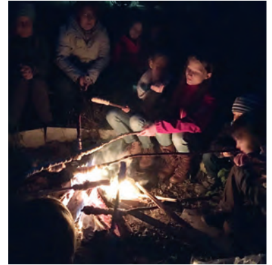
AGNUS-Jugend-Familien am Lagerfeuer beim Stockbrot machen

Besucht uns auf dem Weihnachtsmarkt am Stand des Bürger- und Heimatvereins. Wir haben Informationen und die gute Schokolade von Plant for the Planet.