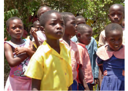
Kinder warten auf ihre Untersuchung im Medical Camp

Mombasa in Kenia den Namen DZARINO gegeben. Sie kümmert sich in vielfältigen Projekten darum, den Lebensunterhalt der armen ländlichen Bevölkerung nachhaltig zu verbessern. Im Sinne der Hilfe zur Selbsthilfe werden Schulungen in Landwirtschaft und Betriebsführung durchgeführt, so dass vor allem Frauen Garküchen, Geflügelzucht, Ziegenmilchverarbeitung u. ä. betreiben können, um den Unterhalt für sich und ihre Kinder zu bestreiten. Dafür werden auch Kleinkredite vergeben. Ebenso wird durch Gesundheitsvorsorgeuntersuchungen und Aufklärung z.B. über Hygiene, Familienplanung und AIDS die Gesundheit der Bevölkerung nachhaltig verbessert. Ulrike und Richard Farun kennen das Projekt seit