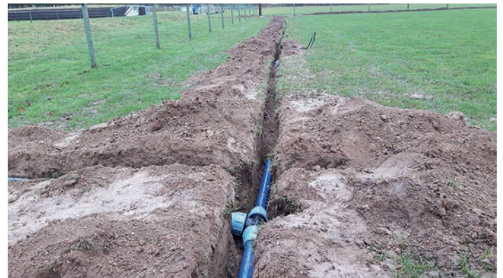
Die Installation hat begonnen

Trotz der nicht gerade idealen Wetterbedingungen hat die Fa. Stärk inzwischen begonnen, die Bewässerungsanlage für Platz zwei zu installieren. Ein Großteil der Bewässerungsrohre ist bereits verlegt. Über ein Crowdfunding-Projekt in Zusammenarbeit mit der Volksbank Stutensee-Weingarten ist es im letzten Jahr gelungen, mehr als 15.000,- € Spenden für diese Anlage einzusammeln. Somit stehen die Chancen sehr gut, dass die Anlage im Frühjahr für ideale Trainingsbedingungen sorgen kann. Wir halten euch über den Fortschritt natürlich auf dem Laufenden.