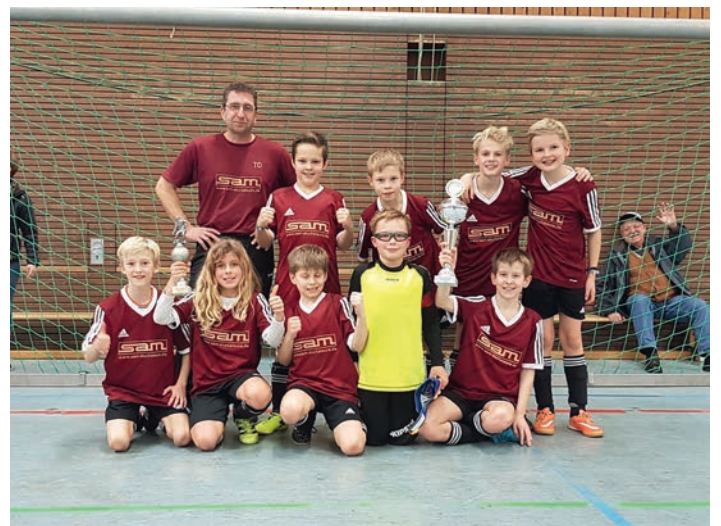
Unsere siegreichen E1-Junioren

Nach einer sehr engen Vorrunde im gut besetzten Hallenturnier beim FC 07 Heildesheim ließen die Schützlinge des Jahrgangs 2007 in den Finalpartien nichts mehr anbrennen und holten nach einem 4:0 im Halbfinale gegen Stettfeld und einem 3:0 im Finale gegen den FC Rot verdient den Siegerpokal nach Weingarten. Zusätzliches Zuckerle: auch die Wertung „Bester Spieler des Turniers“ ging in die Reihen der FVgg.