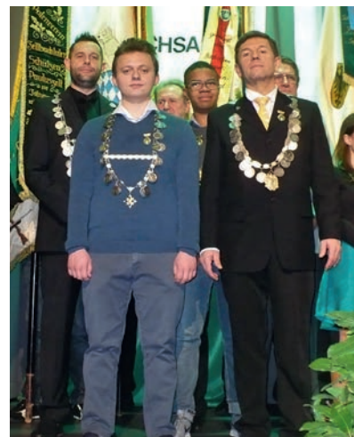
Weingartener Abordnung beim traditionellen Einmarsch