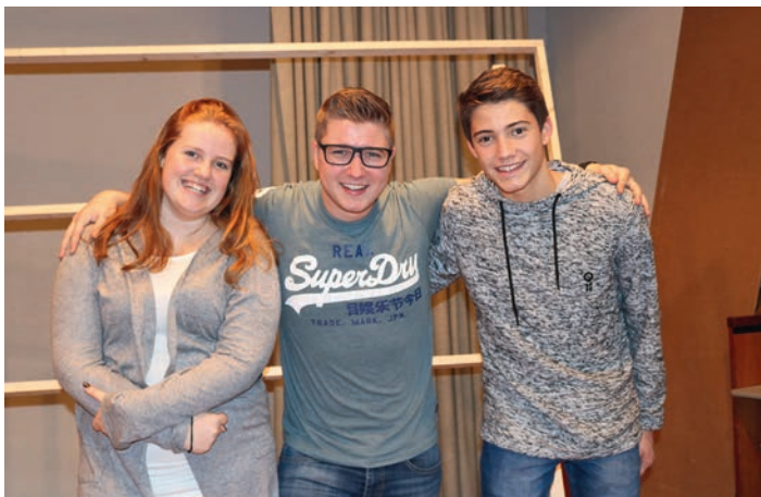
Foto: Emilia Fezzuoglio, Simon Geißler, Hannes Knecht Es fehlt: Lissy Miksat

Der Hofstaat des Prinzen ist, einschließlich ihm selbst, eine Versammlung von Nichtstuern. Der Hofdame kommt es nicht in den Sinn, einen Hofknicks zu machen, obwohl das im Zeitalter der Märchen das Erste ist, was junge Mädchen bei Hofe lernen. Die Ministerin ist geldgierig ohne Ende, aber auch schlau. Ihr ganzes Sinnen richtet sich darauf, zu Geld zu kommen: Aktienbetrug könnte sie sich vorstellen, oder Kunstfälscherei. Es gäbe viele Möglichkeiten, Ideen hat sie genug, aber in unserem Märchen hat sie noch keine verwirklicht. Darum muss sie es mit „Stroh zu Gold“ spinnen versuchen und Helena ist ihr Opfer. Der Kater ist eine schillernde Figur, aber zum Mäusefangen taugt er jedenfalls nicht. Er taugt zum