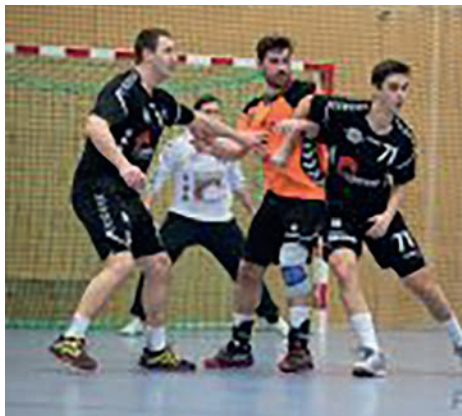
Die Angreifer der SGSW wurden meistens gut abgeschirmt