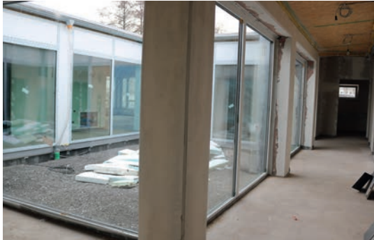
Viel Licht in den rechteckig umlaufenden Flur bringt der offene Innenhof