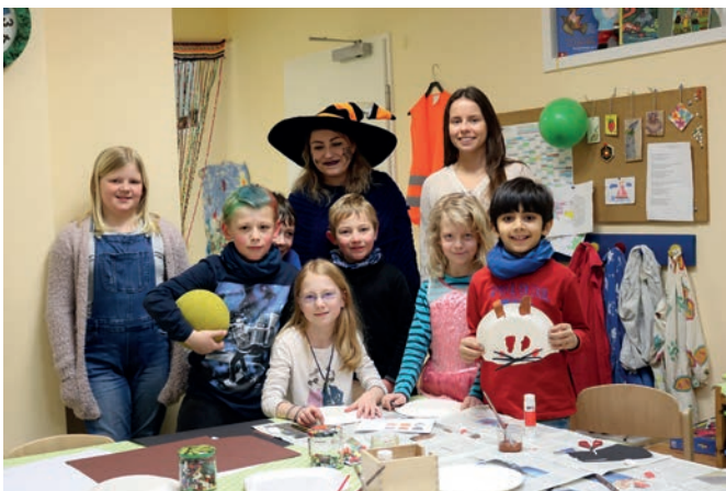
Viele Kinder wollten gerne Faschingsmasken basteln, fotografiert werden allerdings nur wenige

Fasnacht ist natürlich auch in der Schulkindbetreuung ein Thema. Ohnehin schon darum, weil das Betreuerteam das Angebot an den Jahreszeiten orientiert und weil Fasching feiern den Kindern einfach Spaß macht. Fast alle waren an diesem Rosenmontagsvormittag verkleidet. Indianerin, Prinzessin, Fi-