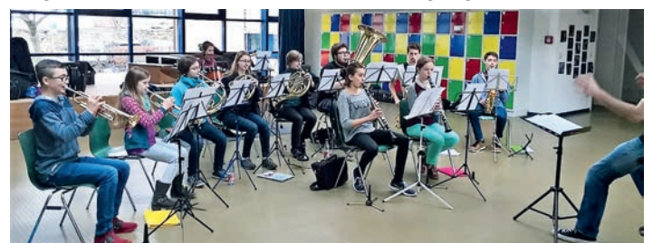
Voller Einsatz beim Probenwochenende der Jugend

Am 25. März steht zum fünfzigsten Mal das traditionelle Frühjahrskonzert auf dem Programm. Den Termin sollten Sie sich unbedingt vormerken, da unter anderem die Highlights aus 50 Jahren