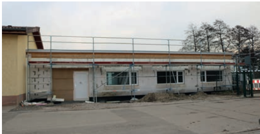
Wenn alles klappt, könnte das Gebäude in wenigen Monaten bezugsfertig sein einschließlich Schuhe binnen 45 Minuten komplett getrocknet und desinfiziert werden. Das Gebäude wird über eine gasgespeiste Fußbodenheizung sowie eine Solaranlage beheizt.

Nach Auskunft des Architekten ist Stand jetzt, dass die Fliesen verlegt werden, die Innentüren müssen eingebaut werden, die Wände mit Raufaser weiss tapeziert und die Decken abgehängt werden. Ist bis Ende Februar / Anfang März der Außenputz aufgebracht, ist die Fertigstellung abzusehen.