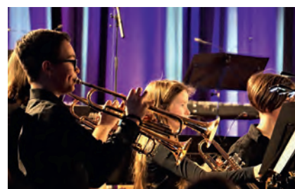
Am 14. April präsentiert der Musikverein wieder das Frühjahrskonzert in der Walzbachhalle.

Wir laden Sie am Sonntag, den 14.04.2019 um 18 Uhr zum 51. Frühjahrskonzert in die Walzbachhalle in Weingarten ein. Das Programm steht dieses Mal ganz im Zeichen der britischen Inseln. Zum Einstieg präsentiert das Jugendor-