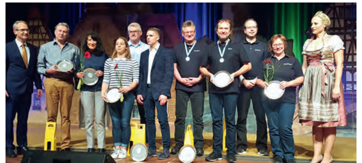
Weingartner Sportschützen mit dem Ehrenteller in Silber ausgezeichnet.

Jedes Jahr tragen Weingartner Sportler sehr erfolgreich den Namen Weingarten bis weit über die Gemarkungsgrenze hinaus. National und auch international erbringen sie in den verschiedensten Sportarten Bestleistungen und dafür erhalten sie Dank und Anerkennung von der Gemeinde Weingarten.