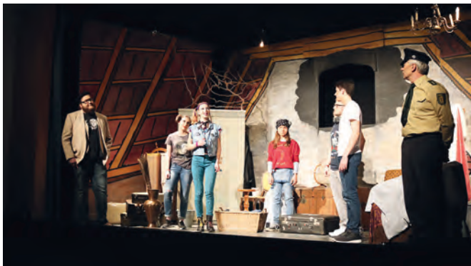
Ein verstaubter Dachboden ist der Schauplatz, an dem die Akteure der Theaterkiste ihr neues Abenteuer erleben

Karten sind im Vorverkauf bei der Buchhandlung „Bücherwurm“ erhältlich.