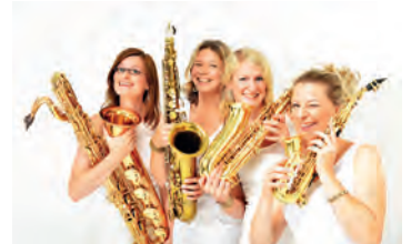
Vier Frauen, vier Saxophone - ein mitreißender Sound.

Unter www.weingartner-musiktage.de finden Sie weitere Informationen.