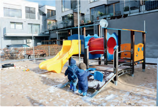
Nicht sehr abwechslungsreich präsentiert sich derzeit das Außenspielgelände der KiTa Wichtelgarten. Das soll bald besser werden.

Die Kindertagesstätte „Wichtelgarten“ der Pro-Liberis GmbH besuchen derzeit 35 Kinder im Alter unter drei Jahren. Das Außenspielgelände befindet sich in einem Innenhof und stellt einen großen Sandkasten dar, in dessen Mitte sich ein Klettergerüst mit Rutschbahn befindet. Am Rand liegt ein kleines Beet mit einer mangelhaften Einfassung.