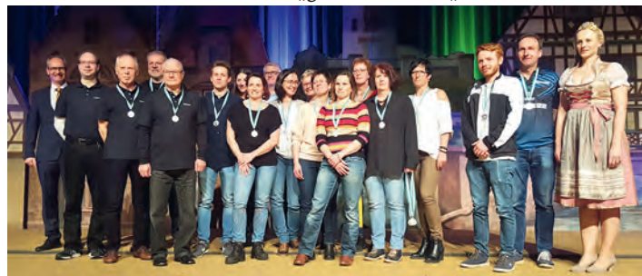
Bogenschützen Recurve erhalten Sportlermedaille in Silber.