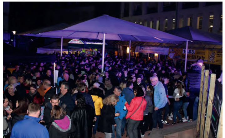
Voller Rathausplatz bei der Apres Ski Party

mit viel Beleuchtung, großen Lautsprechern, DJ Hütte und diversen Ständen und Bars umfunktioniert. Der Platz füllte sich und gegen 20.30 Uhr war die „Hütte“ voll. DJ Thorsten hatte einen Hit nach dem anderen aus den Boxen und Weingarten zeigte, dass man auch auf Apres Ski Musik „Freestyle“ tanzen kann. Die Stimmung war sehr ausgelassen und friedlich, was uns bei der großen Anzahl an Besuchern sehr gefreut hat. Ein herzliches Dankeschön an die Gemeinde Weingarten, Multimedia Systems, Metzgerei Kunzmann, Fabry Holzbau für die Unterstützung bzw. das Bereitstellen von Equipment. Ein weiteres großes Dankeschön an alle Anwohner des Rathausplatzes für ihr Verständnis sowie an alle fleißigen Helfer. Apropos Wettergott, als wir am Sonntag mit dem Abbau fertig waren, fing es wieder an zu regnen. Bilder zur Veranstaltung gibt es bald auf unserer Homepage.