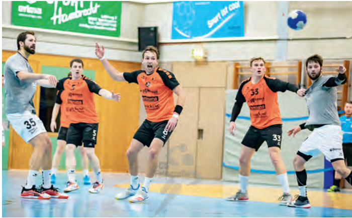
Die Deckung der SGSW arbeitete sehr konzentriert und effektiv

Auswärtsspiel in der Badenliga mit sehr gemischten Gefühlen an. Gastgeber der Bechtler Sieben war der Tabellenzweite TSV Birkenau, der auf jeden Fall beide Punkte ergattern wollte, um nicht mehr Boden gegenüber Spitzenreiter Neuenbürg zu verlieren. Außerdem wollten die Südhessen unbedingt Revanche für die Niederlage gegen die SGSW in der Vorrunde. Im Vorfeld hatte Trainer Bechtler zusätzlich große personelle Schwierigkeiten zu bekämpfen und fuhr schließlich mit einer angeschlagenen Truppe nach Birkenau.