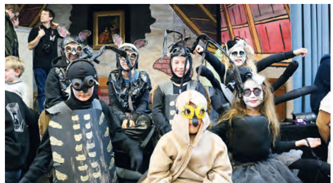
Auch die jüngsten Mitspieler der Theaterkiste haben viel Spaß am Verkleiden und sind hier in den Rollen von Ratten, Spinnen und Asseln zu sehen