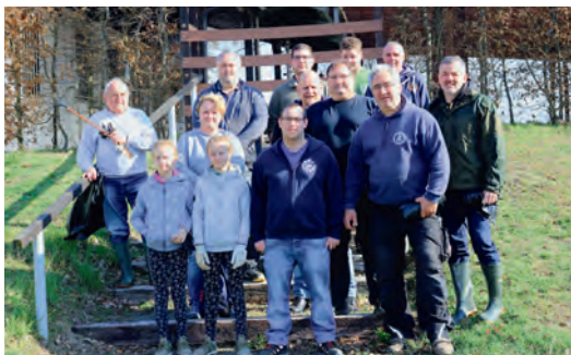
Der Anglerverein hat sich am „Tag des Gewässers“ beteiligt und mit einer starken Mannschaft Müll rund um den Weingartner Baggersee gesammelt.