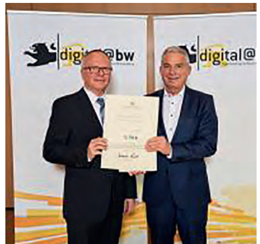
(v.l.n.r.): Bürgermeisterstellvertreter Gerhard Fritscher nahm den Förderbescheid über 71.754,-€ für Breitbandmaßnahmen in der Jöhlinger Straße von Digitalisierungsminister Thomas Strobel im Innenministerium entgegen.

Zudem fördert das Ministerium für Inneres, Digitalisierung und Migration erneut den Ausbau des landkreisweiten Backbones. Für die Backboneerweiterung im Ortsteil Eggenstein sowie den Backboneverbindungen zwischen Helmsheim und Gondelsheim Nord und Bretten und Gondelsheim Süd erhält der Landkreis Karlsruhe 745.875 Euro.