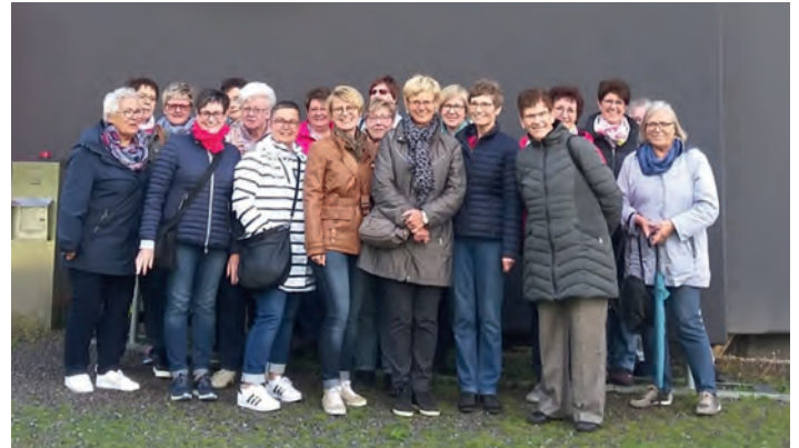
GV Frohsinn: Die Ausflüglerinnen vor dem Gasometer

rinnen des GV Frohsinn am Bahnhof Weingarten zu einem unterhaltsamen und lehrreichen Ausflug. Neben dem eindrucksvollen Panorama-Bild, das den Teilnehmerinnen im Rahmen einer Führung nahegebracht wurde, standen auch Kaffee und Kuchen auf dem Programm. Zurück in Weingarten kehrten die Sängerinnen noch zu einem geselligen Abendessen zum Ausklang des Ausflugs ein. Ein herzlicher Dank gilt den Organisatorinnen. hjmi