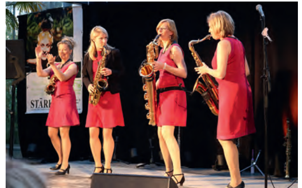
Mit mitreißendem Schwung und brillanter Musik begeisterte das Saxofon-Quartett „Sistergold“ im Gewächshaus Stärk