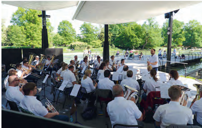
beschwingte Klänge auf der Seebühne

Kommen Sie in den Zoo - und genießen Sie unsere Musik auf der Seebühne! Am Samstag 4. Mai lohnt sich ein Ausflug in den Zoologischen Stadtgarten Karlsruhe ganz besonders, denn ab 15.00 Uhr sind wir auf der Seebühne zu Gast. Wir präsentieren dort ein abwechslungsreiches Unterhaltungsprogramm. Genießen Sie mit uns den Tag in Karlsruhe, wir freuen uns auf Sie.