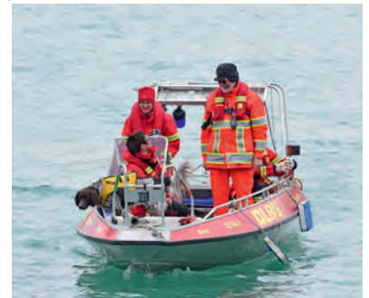
Wasserortungshund nach bestandener Prüfung

Bei kühlen Temperaturen fand am 13.04.2019 für zwei DLRG-Hunde die Prüfung / bzw. Wiederholungsprüfung als Wasserortungshund statt. Dabei wird der Hundeführer/die Hundeführerin nach dem Ausbringen des Riechstoffes mit dem Boot in das Suchgebiet gefahren und die Strategie zur Abdeckung der abzusuchenden Wasserfläche bestimmt. Am Prüfungstag bestand das Suchgebiet aus einem Viertel der Wasserfläche hinter dem Förderband, welches in 45 Minuten erfasst werden musste. Durch entsprechendes Abfahren mit geringer Geschwindigkeit wird mittels GPS erfasst, wo der Hund anspricht. Nach Auswertung dieser Daten kann das Ergebnis mit dem „Versteck“ verglichen werden und die Prüfung gilt als bestanden, wenn der Hund die Versteckstelle im Radius von 50 m aufgespürt hat.