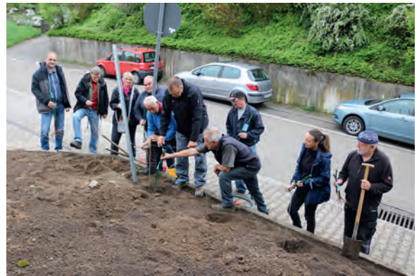
Mitglieder des VHS-Kurses beim gemeinsamen Pflanz-Einsatz mit Mitgliedern des Arbeitskreises

rektem Weg von den alten Hasen erfahren, wie Reben