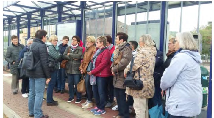
GV Frohsinn: Unterwegs nach Pforzheim