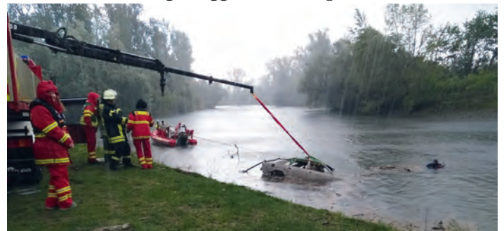
Autobergung durch den Feuerwehrkran

Die diesjährige Bezirksübung fand am 27.04.2019 in Eggenstein - Leopoldshafen unter Beteiligung der Wasserschutzpolizei und der Feuerwehr statt. Abweichend von den bisherigen Übungen wurden die 85 Teilnehmer aus den Ortsgruppen des Landkreises Karlsruhe bereits vor offiziellem Beginn der Übung um 9:00 Uhr von der Einsatzmeldung überrascht. Unsere Ortsgruppe war mit fünf Personen (Einsatztaucher und Signalmann/frau) bereits Vorort und gehörte zu den ersten Fahrzeugen an der Einsatzstelle an der Fähre nach Leimersheim.