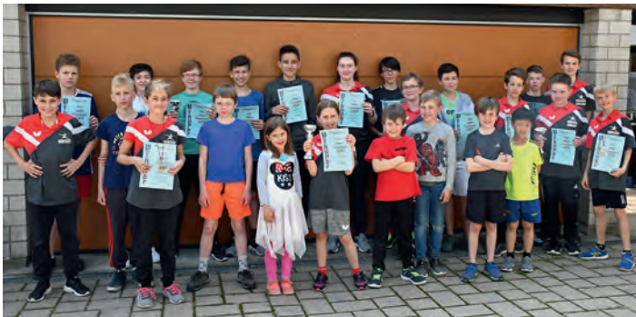
Strahlende Sieger bei der Siegerehrung

Abschließend bleibt zu resümieren, dass wir uns nach einem wirklich schönen und erfolgreichen Tag nun nur noch mehr auf die kommende Saison freuen. TM