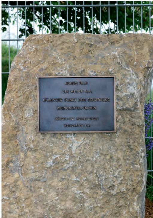
Der Stein, ein Muschelkalk-Bruchstein, befindet sich direkt neben dem Hochbehälter Sohl