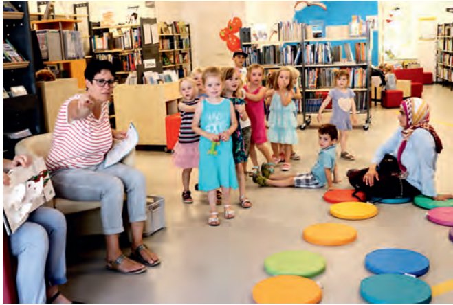
In einer langen Polonaise suchten die kleinen Raupen gemeinsam Futter