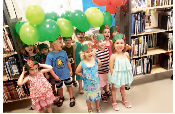
Eine Riesenraupe aus Luftballons war entstanden und jedes Kind durfte seinen Raupenkopfschmuck mit nach Hause nehmen