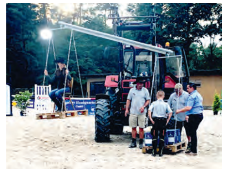
Preisverleihung Allround Champion LK 4A

Am 20.06.-23.06. fand auf der Reitanlage des Reitvereins Weingarten das große Westernturnier der Kat. A statt, mit Qualifikationsläufen für die Deutsche Meisterschaft in über 7 verschiedenen Disziplinen. Schon am Mittwoch den 19.06. reisten viele Reiter mit Pferden und Mannschaft an. Über das Turnier traten weit über 230 Starter zu weit über 1200 Prüfungen an.