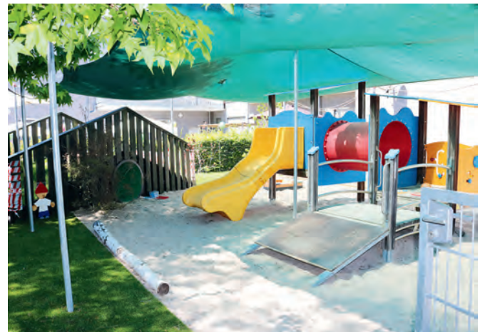
Spielgerät mit Objekten, die bewegt werden können und Ursache und Wirkung zeigen. Im Hintergrund der neu angelegte Hügel mit Tunnelröhre.

„Wo komme ich hin, wenn ich durch diese Röhre krabble? Was passiert, wenn ich an diesen Rädern drehe? Warum kullern Bälle manchmal und manchmal nicht?“ Derartige spannende Fragen zur eigenen Bewegung und zu bewegten Objekten können die Kinder der Kindertagesstätte „Wichtelgarten“ in Zukunft erleben, denn ihr neuer „Abenteuer- und Entdeckungsspielplatz“ ist fertig. Leiterin Theresa Schwalbe-Horn berichtete, dass im März die Einrichtung die Umgestaltung ihres etwas trostlosen Außengeländes geplant habe und die Arbeiten sehr schnell vorangegangen seien. Es sei eine Gemeinschaftsleistung, an der Eltern, das Wichtelgarten-Team und die Handwerker des Trägers Pro Liberis mitgearbeitet hätten. Spenden kamen von Firmen und von privater Seite. Ein Hügel mit einer Krabbelröhre wurde errichtet, Kunstrasen verlegt, der Sandkasten angelegt und ein sinniges Spielgerät mit spannenden Möglichkeiten wieder auf Vordermann gebracht. In einem kleinen Beet gedeihen Himbeeren und kleine Tomaten. Jetzt wurde das neue Gelände mit einem runden bunten Fest eingeweiht. Geschäftsführer Peer Giemsch ließ es sich nicht nehmen, selbst das Band durchzuschneiden und den „Wichteln“ ihren neuen Garten zu übergeben. Die Kita befinde sich im Gebäude eines ehemaligen Supermarkts, berichtete er, und das Spielgelände sei eigentlich die ehemalige Warenanlieferzone. Darum sei es erforderlich gewesen, den Spielbereich wie ein Hochbeet anzulegen, um wenigstens etwas Grünes zum Wachsen zu bringen.