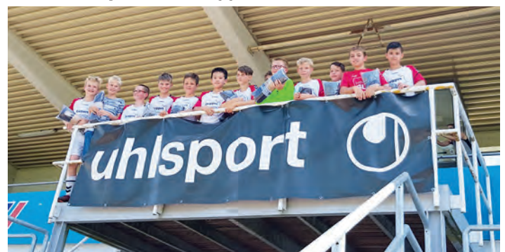
Der verdiente Lohn: der vierte Platz