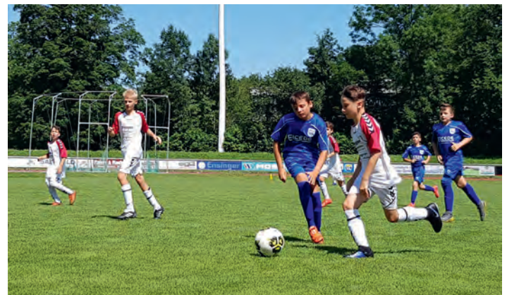
Trotz der hohen Temperaturen wurde alles gegeben

Das gezeigte spielerische und kämpferische Potenzial gibt durchaus Hoffnung, dass das Team auch in der D-Junioren-Kreisliga (der höchsten D-Junioren-Liga) bestehen und eine erfolgreiche Saison gestalten kann.