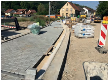
Pflasterarbeiten beim Haus Edelberg

Jetzt geht es in dem letzten Schritt in die Sanierung der Leitungsinfrastruktur (Wasser/Abwasser) im Bereich der B3. Dazu wurden vom Gemeinderat zusätzliche Ausgaben von ca. 100 TSD € genehmigt. Der erforderliche Eingriff in die B3 ist erst kurzfristig vom Reg. Präsidium genehmigt worden. Jetzt kann die Umsetzung ab Mitte Juli in 6 Teilschritten erfolgen. Dies führt aber zu Verkehrsbeeinträchtigungen auf der B3 im Kreuzungsbereich zur Burgstraße und zum Steigweg bis September 2019.