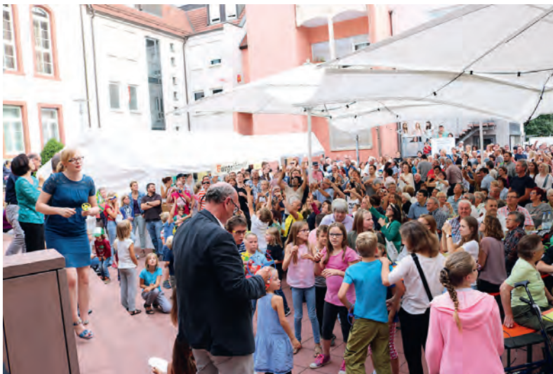
Zur Wahl der Weinkönigin werden bunte Propeller verschossen. Nur wer einen fängt, darf seine Stimme abgeben.

Vom 12. bis 14. Juli steigt das 25. Weingartner Wein- und Straßenfest mit dem Höhepunkt der Wahl der Weinkönigin. Nachdem ein Drittel der Gesamtstimmenzahl bereits von geladenen Gästen in einer Vorwahl im Rathaus abgegeben wurde, ist jetzt die Bevölkerung aufgerufen, ihre Stimme abzugeben.