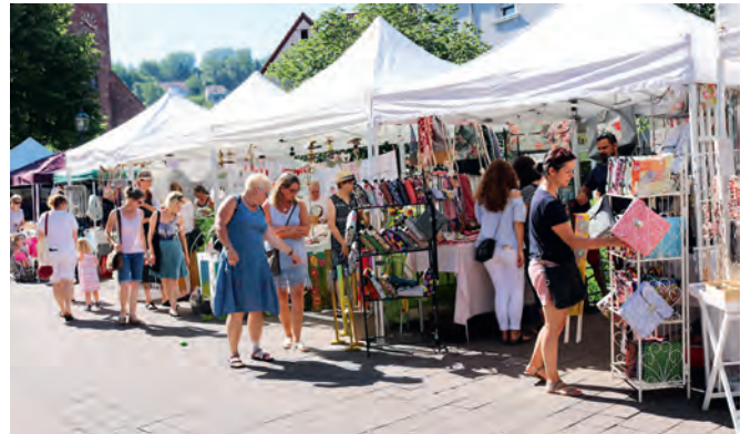
Die Stände und Pavillons der einzelnen Ausstellerinnen ziehen sich über den Rathausplatz hinaus bis in den oberen Teil der Bahnhofstraße. Der Markt ist alljährlich ein starker Magnet für Anbieter und Publikum.