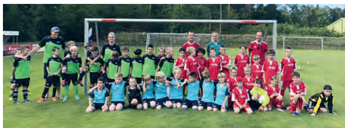
Ein gelungener Abschluss