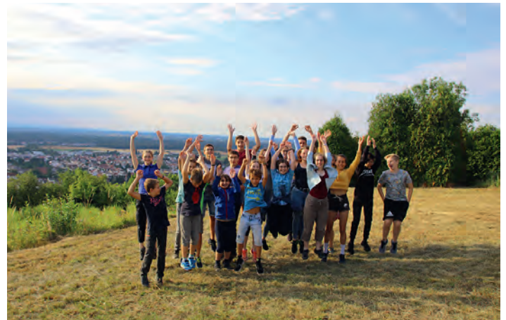
Die Vereinsjugend hatte viel Spaß beim Grillen an der „Schönen Aussicht“