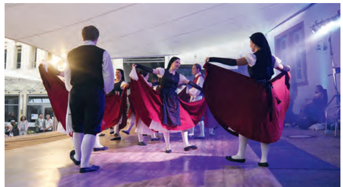
Die Tanzgruppe Esbart Olesa bei ihrem Auftritt auf dem Wein- und Straßenfest.

Als Präsent gab es Weingartner Secco für die ganze Gruppe. Zwei