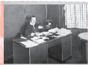
Marie Juchacz, Gründerin der AWO