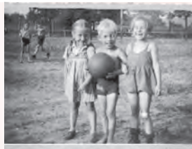
AWO Ortsranderholung ca. 1953