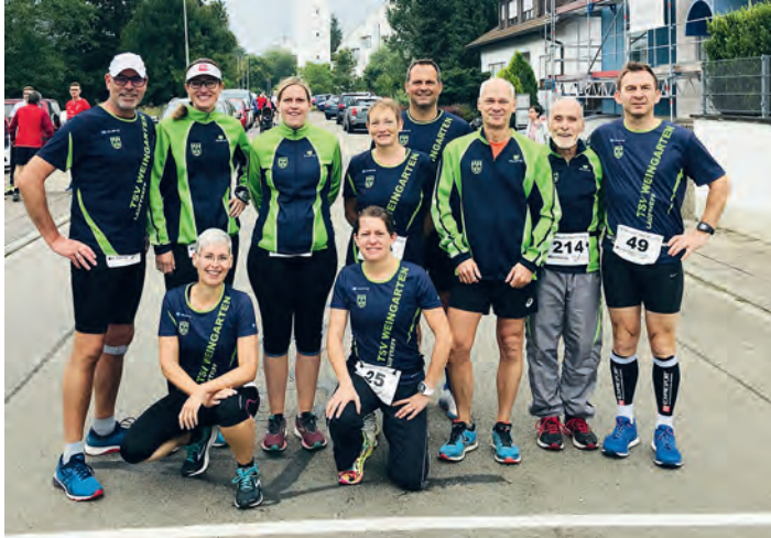
TSV Weingarten Lauftreff vor dem Start des 34. Büchiger Volkslauf