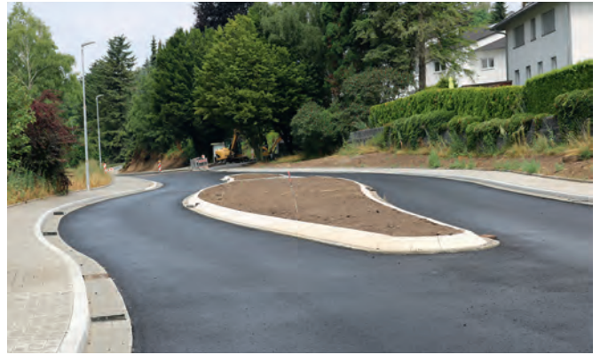
Die Verschwenkung mit Querungshilfe kurz nach der Ortseinfahrt auf Höhe der Häuser „Am Gipfelsberg“

Rund ein Jahr nach Beginn der Bauarbeiten ist der erste Bauabschnitt der Maßnahme Jöhlinger Straße auf der Zielgeraden. Im Abschnitt von der Mühlstraße bis zu den Flüchtlingsunterkünften sind die Asphaltarbeiten und die Gehwege fertig, vom „Gipfelsberg“ bis zur Villa Kugel wurde eine Teilasphaltierung hergestellt. Die Straßendecke wird im Zuge der restlichen Asphaltarbeiten im Zeitraum vom 27. bis 30. August aufgebracht, vorher ist keine Asphaltkolonne verfügbar. Die Gehwege sind auch dort bereits fertiggestellt. Im Teilabschnitt zwischen Flüchtlingsunterkünften und Gipfelsberg wird aktuell an der Gehwegfertigstellung gearbeitet und anschließend das Straßenplanum hergestellt. Die Firma Köhler Bau wird bei dieser Maßnahme keine Sommerpause einlegen. Die Baustelle bleibt durchgehend besetzt, um den inzwischen angestrebten Fertigstellungstermin Anfang September einzuhalten. Am 30. August sollen die Bauarbeiten auf der Hauptstrecke somit nahezu beendet sein. Die uneingeschränkte Befahrbarkeit der Strecke wird im Laufe des Septembers angestrebt.