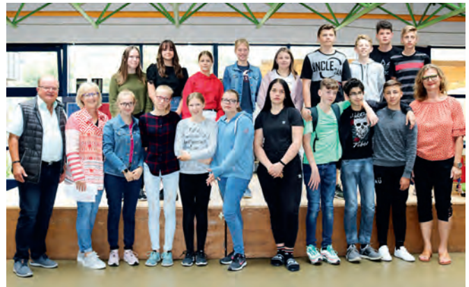
Die jetzige Klasse 8a wurde mit dem Margrit-Steinert-Preis für das Projekt „Notinsel-Schule“ ausgezeichnet