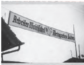
AWO Weingarten 1950