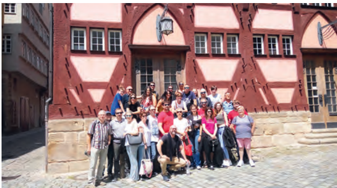
Die Reisegruppe bei ihrem letzten Stopp in Esslingen.