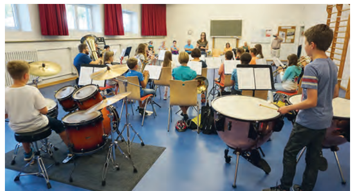
Die MusikvereinKIDS schnuppern Orchesterluft