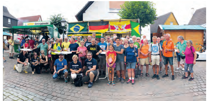
Teilnehmer bei STADTRADELN aus der brasilianischen Partnergemeinde und dem Landkreis Karlsruhe.