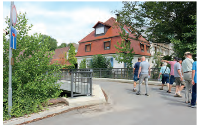
Auf dem Weg zur Oberen Mühle Lepp, die größte Mühle Weingartens, die bis 2006 auch am längsten in Betrieb war