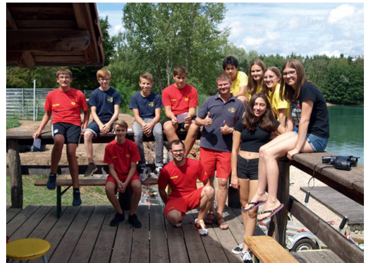
Erfolgreiche Absolventen der Basisausbildung Wasserrettungsdienst mit ihren Lehrgangslleitern

Während dieses Einsatzes machte plötzlich eine Schwimmerin durch laute Hilferufe am Förderband auf sich aufmerksam. Zwei Jugendliche wurden sofort mit Rettungsbrettern zur hilfessuchenden Person geschickt, um die Lage zu eruieren. Die Schwimmerin hatte sich beim Klettern auf dem Förderband vermutlich das Bein gebrochen und weigerte sich beharrlich, auf das Rettungsbrett zu steigen. Sie mußte daraufhin bis zum Eintreffen des Rettungsbootes am Förderband betreut werden und wurde sicher zur Wache zurückgebracht. Schließlich ging durch eine aufgeregte und besorgte Mutter eine Vermisstenmeldung ein, die Ihren achtjährigen Sohn schon seit einer halben Stunde nicht mehr gesehen hatte, und nicht sicher sagen konnte, ob der Junge sich zuletzt im Wasser oder an Land befand. Daraufhin mußte sich je ein Suchtrupp an Land sowie zu Wasser auf den Weg machen. Leider blieb die Suche erfolglos. Während weitere Einsatzszenarien erwogen wurden, melde sich der Vermisste glücklicherweise zurück. Die Einsatzübung endete mit einer Nachbesprechung. Die realistischen Einsatzszenarien verdeutlichten den anwesenden zehn Jugendlichen, wie auch unter Stress unter der Anleitung des Wachleiters reagiert werden sollte. Die sehr interessante und lehrreiche Veranstaltung endete mit der Übergabe von Urkunden und einem gemeinsamen Grillen.