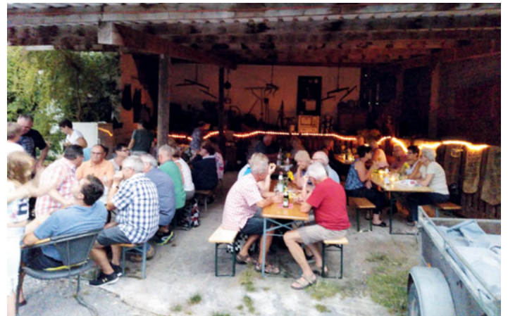
Geselliger Sommertreff des GV Frohsinn

Zum traditionellen Sommerfest des Gesangvereins Frohsinn Weingarten trafen sich zahlreiche Sängerinnen und Sänger im Sallenbusch, trotz der erschwerten Verkehrslage und der schwülen Luft. Bei Speisen und Getränken gab es unterhaltsame Gespräche. Das aufziehende Gewitter zog glücklicherweise nördlich vorbei, und gegen den Regen bot das Scheunendach guten Schutz. Nur einige Radfahrer bekamen auf dem Rückweg eine unfreiwillige Dusche. Herzlichen Dank an die Gastgeberin Heidi und die Organisatoren Gerda und Werner, sowie an alle weiteren Helfer!