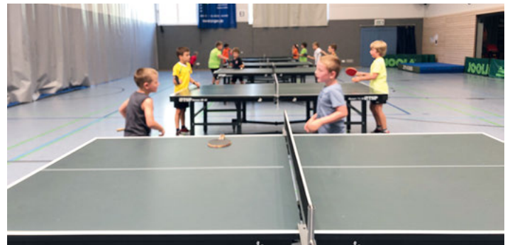
Action am Tisch