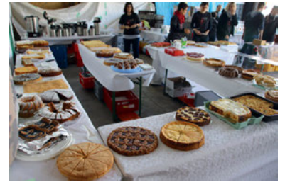
Unterstützen Sie uns mit einer Kuchenspende

01.09. Musik & Wein 2019: WWW - Weingartener WeinWandertag