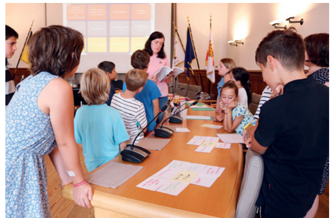
Kärtchen mit Aufgaben einer Gemeinde sollten den Kategorien „Freiwillig“ oder „Pflicht“ zugeordnet werden