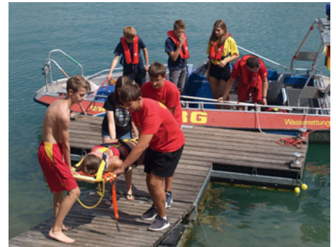
Bergungsübung einer verletzten Person mit dem Spine-Board