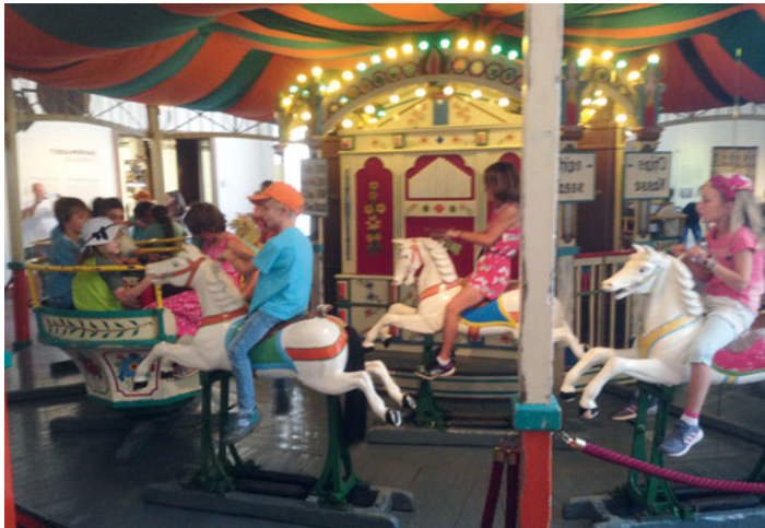
Das historische Kinderkarussell fasziniert auch heute noch

Um das herauszufinden, begaben sich die Kinder des Ferienspaßprogrammes des Musikvereins Weingarten am 1. August ins Musikautomatenmuseum in Bruchsal. Mit der Bahn am frühen Morgen machten wir uns auf den Weg zum Schloss in Bruchsal. Dort wurden die Kinder von einer netten Dame auf eine Führung durch das Museum eingeladen.