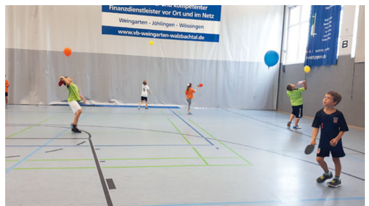
Ballgewöhnungsübungen mit Luftballons