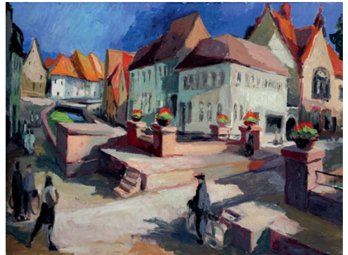
Foto der Titelseite: „Alt Weingarten“ des Kunstmalers Helmut Meyer-Weingarten

Roland Felleisen und Hubert Daul gehen in ihrem reich illustrierten Beitrag auf die beiden Erzählmittage zum Ersten Weltkrieg und dessen Ende 1918 im Heimatmuseum ein. Außer dem geschichtlichen Hintergrund der sich im November 1918 überstürzenden Ereignisse im damaligen Deutschen Kaiserreich geht es dabei besonders auch darum, wie sich „die erste große Katastrophe des 20. Jahrhunderts“ auf einen beschaulichen Ort wie Weingarten konkret ausgewirkt hat,