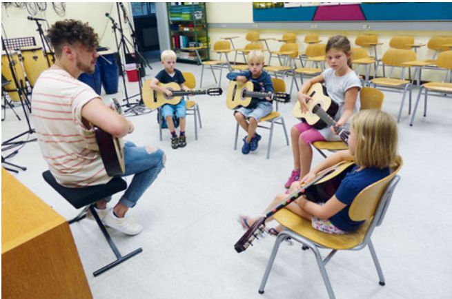
Die jungen Musiker beim Spielen ihrer ersten Akkorde auf der Gitarre