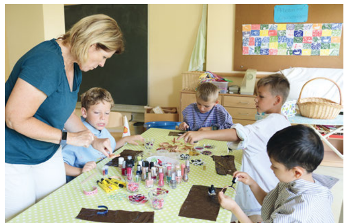
Holzarmbändchen mit Nagellack - ein ausgefallenes Schmuckstück auch für Jungs