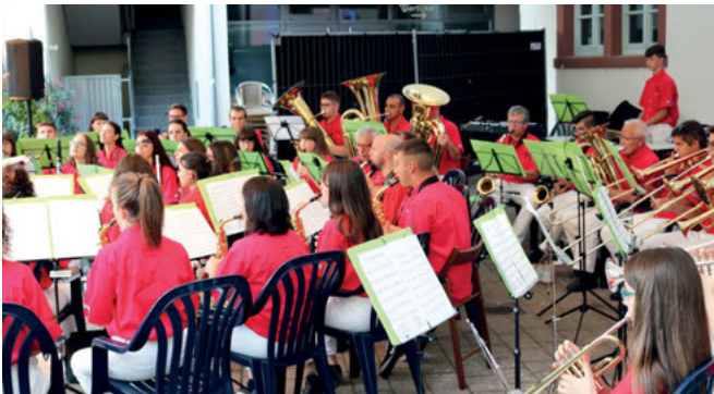
Banda Musicale Città di Staffolo beim Konzert auf dem Rathausplatz