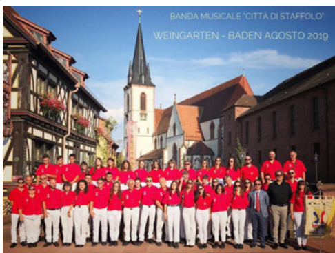
Banda Musicale Città di Staffolo zu Besuch in Weingarten