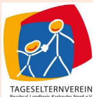
TAGESELTERNVEREIN Bruchsal Landkreis Karlsruhe Nord e.V.