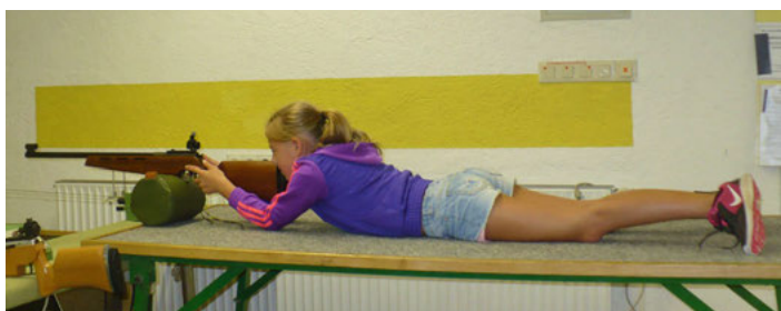
Lasergewehrschießen im Liegen

Wichtig !!! Wichtig !!! Wichtig !!! Die Preisübergabe an die Gewinner der Wildbret-, Pokal- und Paarschießwettbewerbe findet am Sonntag, 22. September 2019 um 11.00 Uhr im Festzelt auf dem Rathausplatz Weingarten bei unserem 6. Oktoberfest statt. Diesen Termin bitte gleich vormerken !!! Das Geheimnis um den/die Bürgerkönig/in 2019 wird da aber noch nicht gelüftet. Die Bekanntgabe erfolgt weiterhin erst bei unserer traditionellen Königsfeier am 23. November 2019 . Kommen Sie vorbei und lernen Sie unseren Schießsport kennen. Der Schützenverein 1924 e.V. Weingarten heißt Sie auf das herzlichste Willkommen.