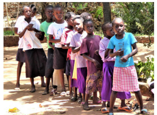
Zum Lernen bereit