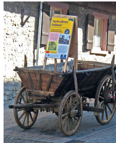
Originelle Werbung: Ein Plakat auf einem historischen Bauernwagen an der Einmündung der Kirchstraße in die B 3 macht auf den „Tag des offenen Denkmals“ aufmerksam.