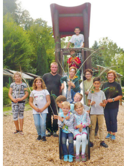
Zum Abschluss gab es für jedes Kind eine Pfauenfeder