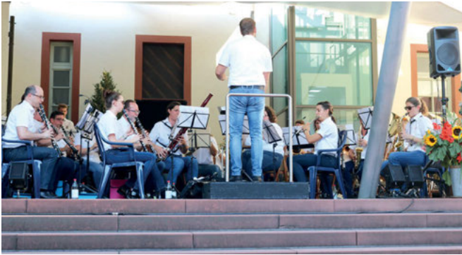
Das Blasorchester des Musikvereins

mit einem interessanten und abwechslungsreichen Programm von Udo Jürgens bis Pippi Langstrumpf. Höhepunkt war der „italienische Block“ mit dem berühmten Schlager „Azzuro“ und Rocco Granatas „Marina, Marina“, das von den italienischen Freunden mit Jubelrufen quittiert wurde.