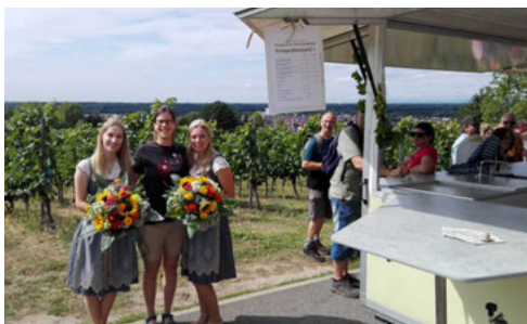
Die Weinhoheiten am „königlichen“ Weinstand

Einladung gefolgt sind und am Sonntag einen wunderbaren Tag im Herzen von Weingarten und im Reb Gelände verbracht haben, ob auf eigene Faust oder auf einer geführten Wanderung.