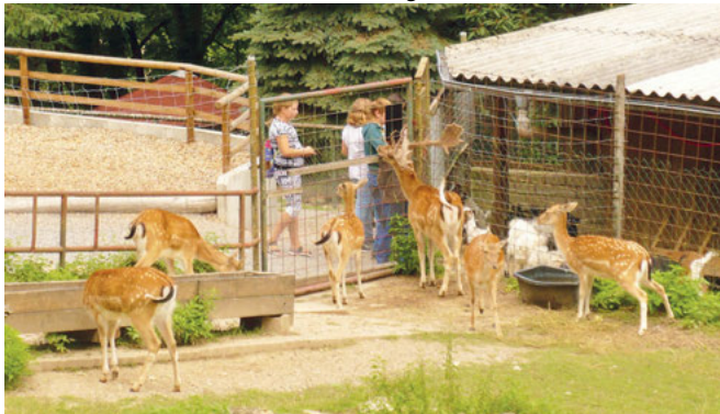
Zutraulich kamen die Tiere bis ganz dicht an den Zaun.

„Wo gibt es noch die Gelegenheit einheimische Tiere hautnah zu erleben? Wo kann man welche füttern, streicheln und sogar auf den Arm nehmen? Im „oberen Vogelpark“ in Weingarten sind die Tiere sehr zu- traulich und sie freuen sich über jeden Besuch, der ein paar Streichel- einheiten und Leckerbissen für sie übrig hat.