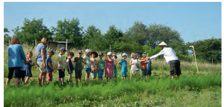
Was riechst du da? Mit allen Sinnen das Feld erkunden.

Die Kindergarten- und Hortkinder waren zu Gast auf den Feldern der Solidarischen Landwirtschaft Gutes Gemüse. An den beiden Standorten Walzbachacker und Eisbergacker hatten die Kinder die Möglichkeit selbst aktiv zu werden und ganz nebenbei jede Menge über ökologischen Gemüseanbau zu lernen.