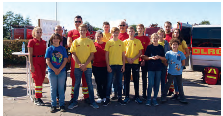
Helfer und Aktive beim Tag der Rettungskräfte