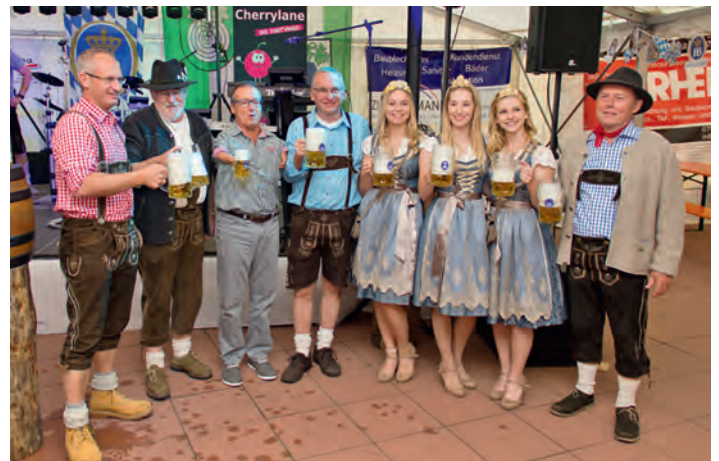
O'zapft is - Fassanstich mit hoheitlicher Unterstützung.

Die Weingartner Schützen können's halt. Ein megageiles Oktoberfest haben sie auf die Beine gestellt. Ein Oktoberfest wie es im Buche steht. Nein, das stimmt nicht ganz. In Weingarten feiert man das etwas andere Oktoberfest. Da gibt es nicht nur original Münchner Hofbräu Oktoberfestbier, da gibt es auch Weingartner Wein und sogar eine Sektlounge mit ihren Schützenscocktails. Und das kam riesig an.