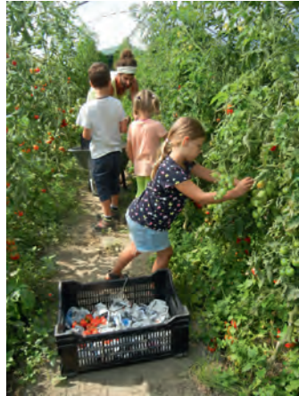
Tomatenernte im Folientunnel

In den nächste Wochen stehen die Kartoffel- und Karottenernte an. Hierzu gibt es schon zahlreiche Anmeldungen der Grundschule und einiger Kindergärten.