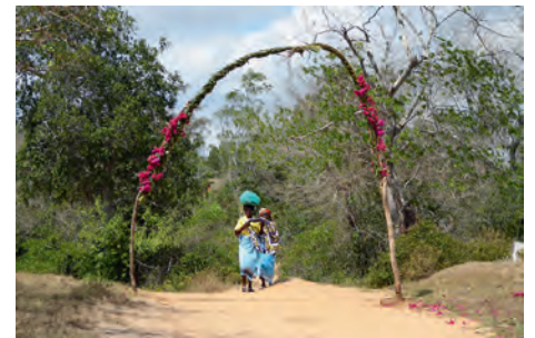
Eingang zum Medical Camp 2019

zweckungebunden zur Verfügung. Wir legen aber immer Wert auf plausible und belastbare Informationen, bevor wir entscheiden. So auch diesmal. Es geht um die Förderung der TUMAINI Vorschule, besonders um die Erfüllung von unerwarteten Folgekosten, die durch eine staatliche Revi-