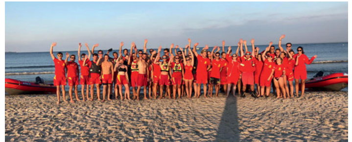
Besatzung der Wachstation Scharbeutz