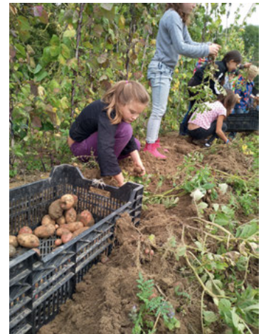
Fleißige Hände bei der Kartoffelernte

Übrigens kann jeder, der am Geschmack unseres guten Gemüses interessiert ist, jederzeit mit einem Schnupperabo einsteigen und 8 Wochen Probeessen. In knapp zwei Monaten findet dann die reguläre Bieterunde statt, auf der die Gemüseanteile für das kommende Jahr vergeben werden. Termin und Ort werden bald gekannt gegeben.