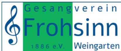
In frischen Farben: Das neue Logo des GV Frohsinn

www.frohsinn-weingarten.de vorbei! Wir freuen uns auf Sie!