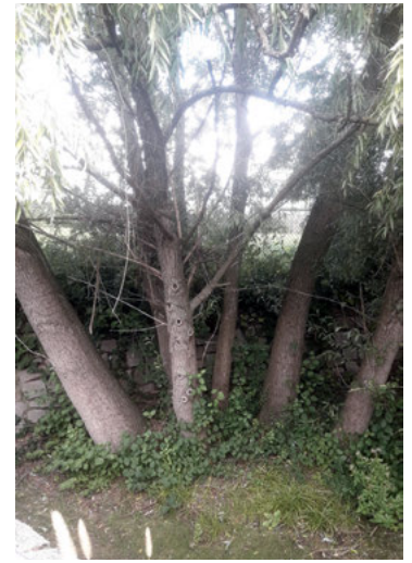
Weidenbäume im Bachbett behindern den Durchfluss und müssen gefällt werden

Darum werden diese Bäume im Lauf der Woche gefällt und es werden an anderer Stelle wieder neue Weiden gepflanzt.