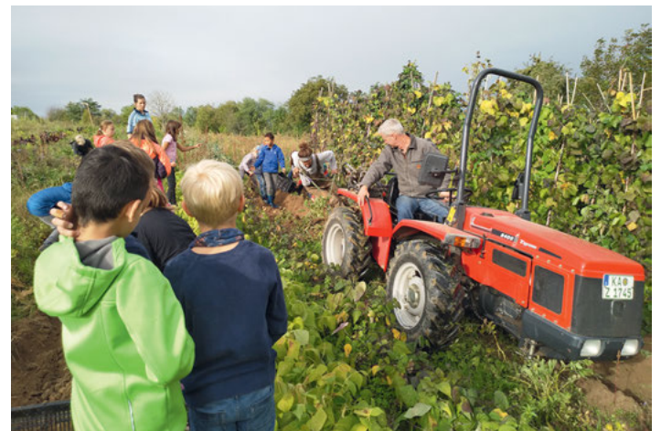
Den Pflug in der Spur zu halten ist nur mit Körpereinsatz möglich.