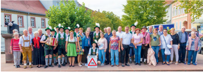
Patenschaftstreffen 2019 in Weingarten

In Weingarten hat der Nussbaum eine besondere Bedeutung. Zum einem gab es einmal den Babelnußbaum, unter dem sich einst die Weingartner Bevölkerung traf, um Neuigkeiten auszutauschen und zum anderen gibt es seit 35 Jahren den Patenschaftsnußbaum beim Schützenhaus unter dem sich die Weingartner und Zellbachtaler Schützen hin und wieder treffen, um ihre Freundschaft von neuem zu bekunden.