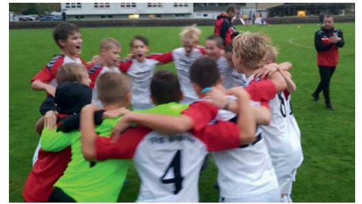
Der Sieg gegen Durlach-Aue wird gefeiert...

Dieser auch durch die kämpferische Leistung verdiente Heimerfolg führt dazu, dass