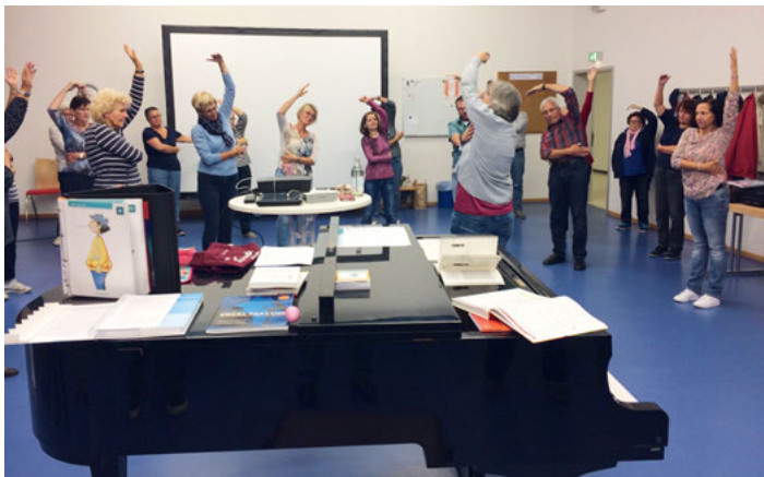
Stimmbildung beim GV Frohsinn

Wir wünschen uns, dass wir diesen Tag mit allen klei7n6e/1n23 und großen Erfolgen immer wieder zurück ins Gedächtnis rufen können. S.B.