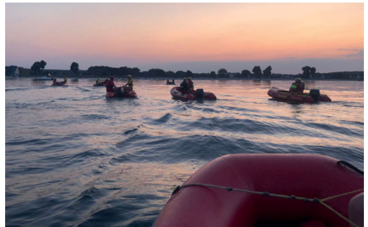
Rettungsübung mit dem Inflatable Rescue Boat (IRB)