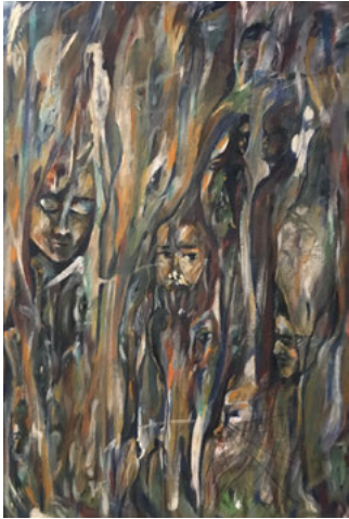
Die Bilder des syrischen Künstlers Mohammad Abdlatif berührten auf besondere Weise.