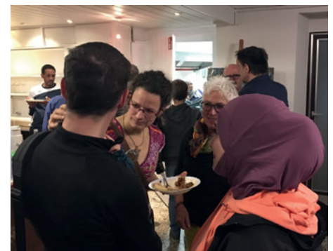
Es gab viele Gelegenheiten zum Austausch...

Zeitweise waren es über 100 Personen, die am Sonntag, 10. November, den Weg in den „Treff International“ in der Bruchsaler Straße in Weingarten gefunden hatten. Der Freundeskreis Asyl hatte zu seinem diesjährigen Herbstfest eingeladen und mit vielen ehrenamtlichen Helfern ein buntes Programm für Jung und Alt organisiert. Das dichte Ge-