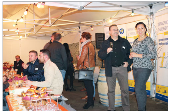
Auch nach der Podiumsdiskussion entwickelten sich interessante Gespräche