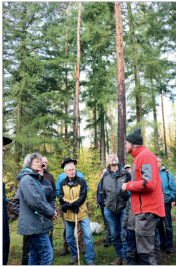
Ein geschlossener Bestand mit Douglasien