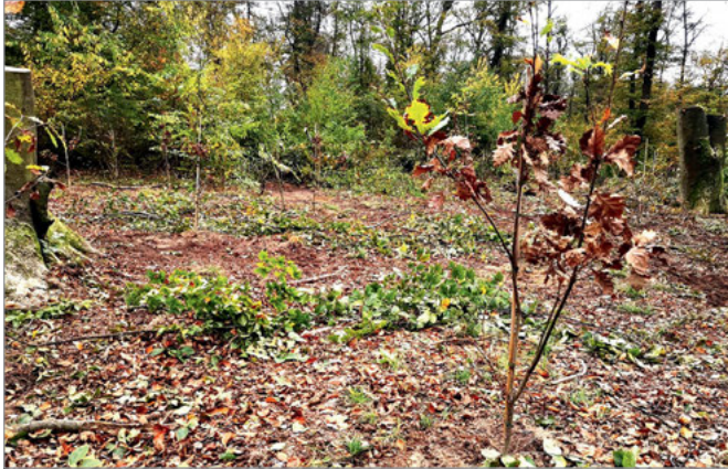
Wo vorher kaputte Buchen standen, hat der Forst junge Stieleichen eingesetzt.

Direkt an der Landesstraße L559 in Richtung Stutensee, kurz nach der Autobahnbrücke, wurde eine Gruppe von zehn beschädigten Bäumen gefällt. Mit einer Kreissäge wurden die Stämme durchtrennt. Durch das Einklemmen und Abstützen der Bäume sorgte der eingesetzte Bag-