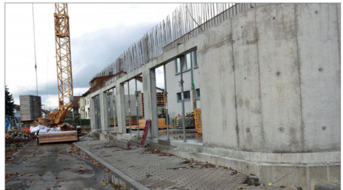
Der Bau außen entlang der Ringstraße