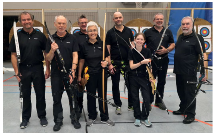
Mit reichlich Edelmetall kehrten die Weingartner Bogenschützen aus der Pfalz zurück.