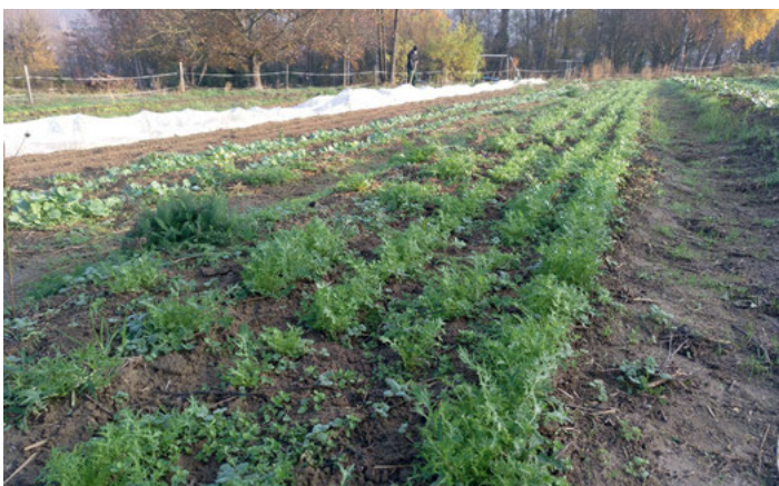
Herbstliches SoLaWi Feld

Bei schlechtem Wetter wird es einen Ausweichtermin am 17.11. um 10 Uhr geben. Um Anmeldung per Mail unter info@gutesgemuese.de wird gebeten. Wer nicht mit dem Fahrrad kommt, sollte dies bitte auch vorab mitteilen.