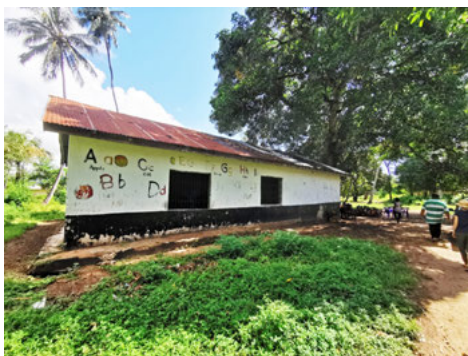
TUMAINI-Vorschule am 29.10.2019

Wir bedanken uns bei allen Spendern, die uns bereits ermöglicht haben, zwei Drittel der Kosten der Gebäudesanierung zu finanzieren. Wir möchten auch bei der Schulausstattung helfen. Was sind 295 € für Spielzeug und