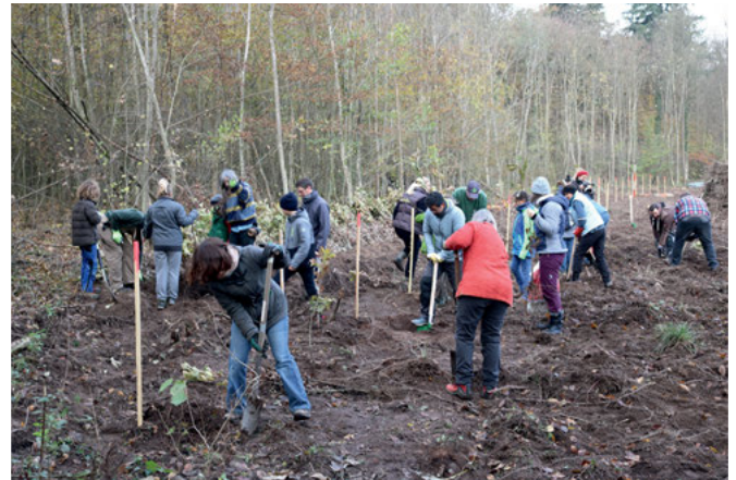
Graben, einsetzen und das Loch vorsichtig wieder verfüllen – mühsam, aber lohnend

Ein besonderes Geschenk brachten die Kinder des Schülerhorts „Haus Kunterbunt“, die Eicheln in Töpfe gepflanzt und im Lauf eines Jahres eine 50 Zentimeter hohe Stieleiche herangezogen hatten. Sodann erläut-