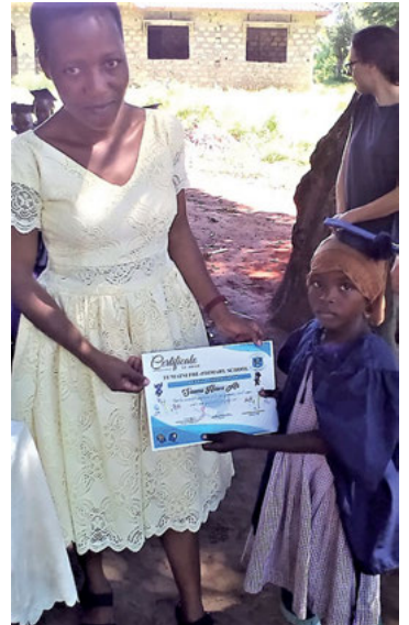
Vertreterin des Jugendamts überreicht Zeugnis

Freundeskreis DZARINO e.V. / Volksbank Stutensee-Weingarten / IBAN: DE29 6606 1724 0031 8868 05 / Stichwort SPENDE DZARINO.