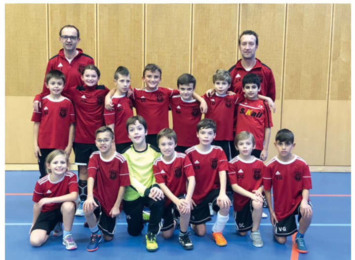
Unser Team der E2-Junioren

Die E2-Junioren der FVgg Weingarten haben am Samstag, dem 9. November die diesjährige Herbstsaison abgeschlossen. Der Sprung in die E2-Jugend mit ihrer geänderten Spielsituation auf einem größeren Spielfeld bei gleichzeitig wesentlich längerer Spielzeit ist den Kindern gut gelungen. In den sieben Spielen der Herbstsaison hatten die E2-Junioren meist gegen starke Mannschaften aus Karlsruhe anzutreten und haben einen achtbaren 5. Platz erreicht. Das zusätzliche Minifußball-Turnier mit seiner besonderen Zielsetzung, die Spielfähigkeit zu fördern, hat ebenfalls viel Spaß gemacht. Insgesamt haben sich also die Kinder des Jahrgangs 2010 rasch in den neuen Spielbetrieb eingefunden und sind erfolgreich in den Staffeln der E2-Jugend gestartet.