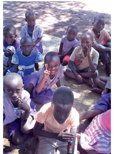
Junior's feiern ihre Senior's