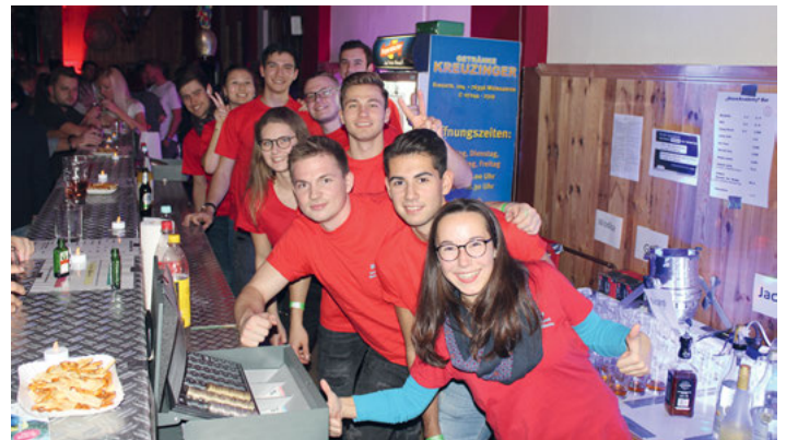
Unser SnowAcademy Team beim Bardienst