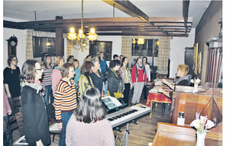
Probe im Nebenraum des goldenen Löwen

So waren die ersten anderthalb Stunden wie im Flug vergangen und an den strahlenden Gesichtern merkten wir, wie sehr das gemeinsame Singen für gute Stimmung und Wohlbefinden sorgt. Die meisten der Frauen und noch ein paar „Neue“ kamen auch am zweiten Probenabend wieder. Außer „Happy“ proben wir nun auch „Hey Jude“ von den Beatles und es klingt richtig schön, wenn sich die drei Tonlagen ergänzend zusammenfügen. Somit dürfen wir berechtigt hoffen, dass das jüngste Projekt des Liederkranzes nach dem gelungenen Start auf einem guten Weg weiter geht.