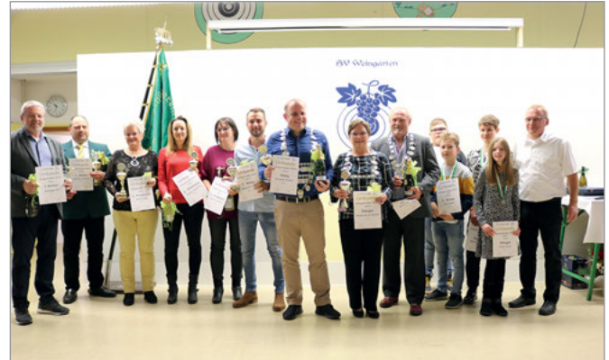
Die komplette Königsfamilie