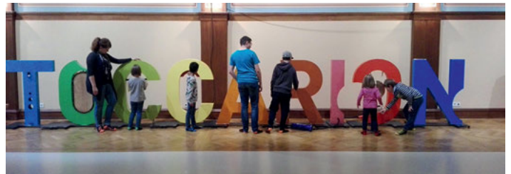
MusikvereinKIDS im Toccarion im Festspielhaus Baden-Baden

Bei einem Ausflug ins Toccarion im Festspielhaus Baden-Baden konnten die MusikvereinKIDS die Welt der Geräusche, Töne und Klänge erkunden. Spielerisch gab es einiges zu entdecken - Stimmverzerrer, Marschierwettbewerb, Instrumente erraten und als Highlight selbst einige Instrumente ausprobieren. Die MusikvereinKIDS und die Betreuer hatten auf jeden Fall sehr viel Spaß.