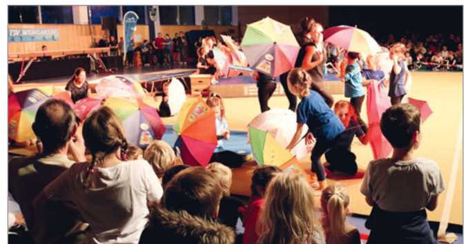
Mit bunten Regenschirmchen hatten die Kinder der ersten und zweiten Klassen Spaß bei ihrer Nummer zu „Singing in den Rain“

Zwölf Monate wurden von 13 Gruppen dargestellt, beginnend mit den Jüngsten. An der Hand ihrer Eltern winkten sie mit Tüchern zur Titelmusik von Rolf Zuckowski („Die Jahresuhr“) und taten die ersten Schritte in ein Sportlerleben, das sie in diesem Verein bis ins hohe Alter ausüben können. Die meisten der folgenden Gruppen zeigten in der proppenvollen Walzbachhalle altersentsprechende Darbietungen auf dem Boden, mit und ohne Bänke und Kästen, mit und ohne Hilfsmittel. Kinder der ersten und zweiten Klasse hatten als „Regentropfchen“ Freude an Bewegung und zeigten das mit Hüpfen, Springen, Radschlagen und Purzelbaum. Die dritten bis fünften Klassen interpretierten „Anton aus Tirol“ und die Kinder der gemischten Kindergruppe waren bereits im April angekommen und hüpfen als Osterhäschen herum. Zwischen