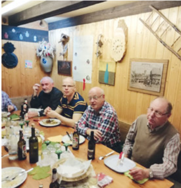
GV Frohsinn - gut gesättigt in der „Futterecke“