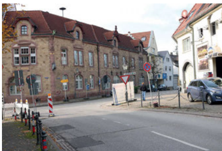
Der Platz für einen möglichen Minikreisel im Kreuzungsbereich zwischen Rathaus und Asia-Imbiss

Aufgrund der aktuellen Verkehrszahlen wird eine Kostenbeteiligung der Straßenbaulastträger der Bundesstraße B3 (Bund) und der L559 (Land BW) abgelehnt. Die Verwaltung schätzt die Kosten auf 250.000 Euro. Darum schlug Gerhard Fritscher vor, die Verwaltung solle eine nachträgliche Finanzierung der Kreisverkehrsanlage mit den übergeordneten Behörden erörtern und die Fraktionsvorsitzenden an diesem Gespräch beteiligen. Danach könne sich der Gemeinderat für oder gegen den Kreisel aussprechen. Das Gremium stimmte diesem erweiterten Beschlussvorschlag, der auch den spätesten Baubeginn auf 30. April 2020 definierte, zu, mit Ausnahme der Gegenstimmen der FDP. Carolin