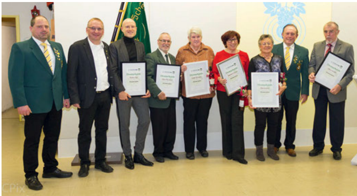
Im Rahmen der Königsfeier wurden neue Ehrenmitglieder ernannt.