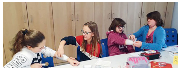
SchülerInnen der Turmbergschule üben die unterschiedlichen Verbandstechniken