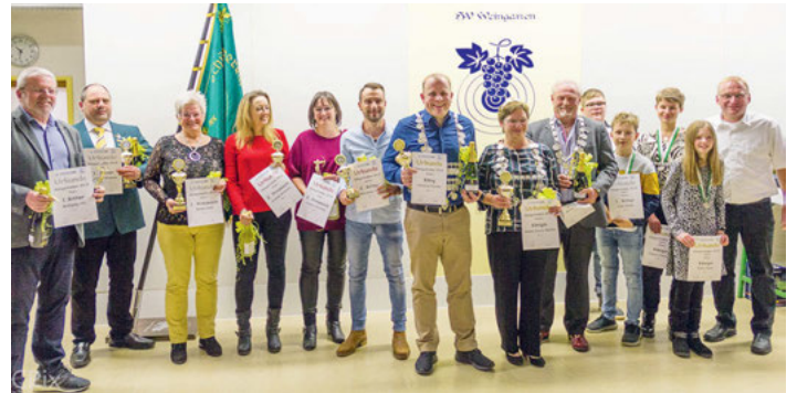
Die neue Königsfamilie.