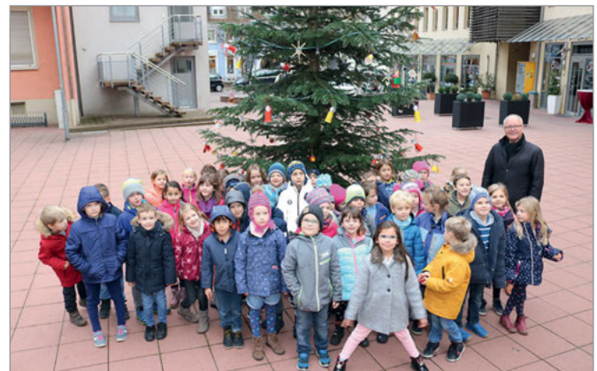
Die Klassen 1a und 1c der Turmbergschule

Der Wichtelgarten ist eine multikulturelle Einrichtung und nicht christlich oder anderweitig religiös ausgerichtet. Darum seien die Erzieher*innen kaum in der Lage zu erkennen, welche Tradition oder welcher theoretischer Hintergrund bei den Kindern als bekannt vorausgesetzt werden könne, berichtet die Leiterin Theresa Schwalbe-Horn. Es könne lediglich vermutet werden, dass aufgrund des primär christlich gepräg-