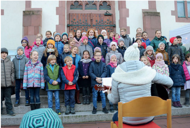
Der Grundschulchor singt Weihnachtslieder