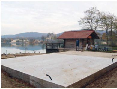
Die neue Bodenplatte des DLRG-Garagen- und Bootshauses ist fertig.

Nach langen Monaten des Wartens liegt endlich die Baufreigabe („roter Punkt“) für den Neubau des Garagen und Bootshauses an der DLRG-Wache am Weingartener Baggersee vor. Nach dem Abbau des alten Bootshauses wurde die Bodenplatte inzwischen erweitert. Die Herstellung des neuen Gebäudes, das in einer Holzständerbauweise von einem Holzbaubetrieb gefertigt wird, ist bereits im Gange. Der Rohbau wird noch in diesem Jahr gestellt und das Dach eingedeckt. Die Aktiven der DLRG-Ortsgruppe sind sehr zuversichtlich, dass kurz vor Weihnachten das Richtfest gefeiert werden kann. Danach warten umfangreiche Dämm- und Verkleidungsarbeiten sowie der gesamte Innenausbau auf seine Ausführung. Diese Arbeiten werden größtenteils in Eigenarbeit der DLRG-Ortsgruppe Weingarten bei unzähligen Arbeitsstunden und -einsätzen ausgeführt werden. Praktische Mithilfe sowie ideelle und finanzielle Unterstützung sind jederzeit sehr willkommen!