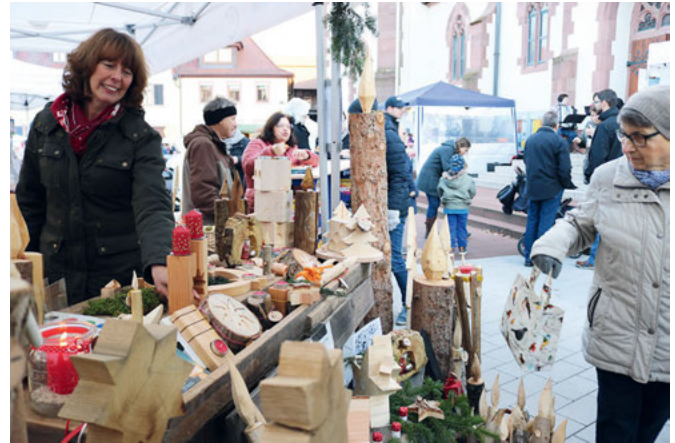
Holzartikel beim Stand der Liebenzeller Gemeinschaft