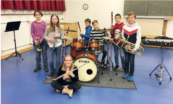
Erleichterung nach der praktischen Prüfung