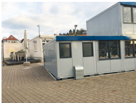
Blick auf einen Sanierungsbereich der Turmbergschule

Der Gemeinderat hat es sich nicht leicht gemacht bei seiner Entscheidung, die Schulerweiterung im bisherigen Ortskern voranzubringen. Dringend erforderlich ist die Erweiterung aufgrund des ständig wachsenden Raumbedarfs infolge steigender Schülerzahlen in der Grundschule. Daneben sind Investitionen in einen weiteren Ausbau der zweizügigen Gemeinschaftsschule zu tätigen. Die SPD-Fraktion hat sich massiv für den Erhalt unserer Schule im Zentrum eingesetzt. Ein Schulneubau auf dem Festplatz wird schon aufgrund der erheblichen Mehrkosten abgelehnt. Maßgebend waren für uns u. a. folgende Argumente: 1. Das zukunftsorientierte Raumkonzept, das eine spätere Ganztags-Grundschule einschließt, ist hier gut realisierbar. 2. Wir wollen die Veränderung der Lernlandschaft in der Gemeinschaftsschule mit einem flexiblen Raumkonzept unterstützen. 3. Es ist uns wichtig, die Kirchen zum gemeinsamen Vorteil in die Planung einzubeziehen. 4. Wir befürworten die Planung einer neuen Mensa außerhalb des Areals der Schule. Lehrer und Elternbeirat der TBS wurden beteiligt.