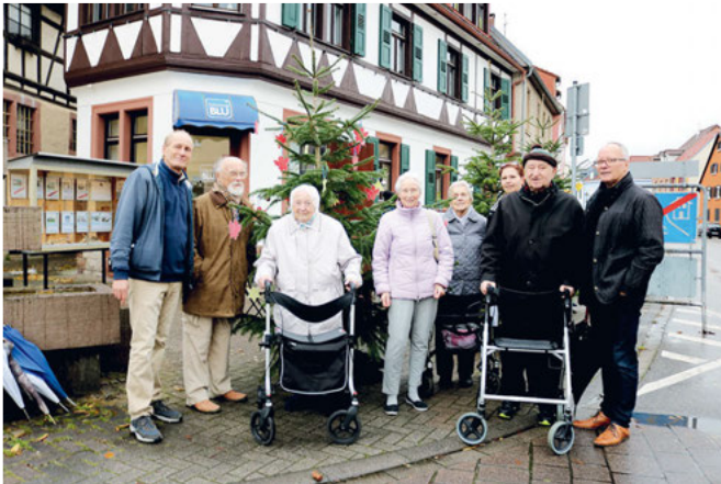
Senioren vom Haus Edelberg

lich die klassischen Formen wie Sterne, Herzen und Girlanden, meist auch die klassischen Farben, aber es sind alle Ausnahmen erlaubt. Es gibt keine Einschränkungen, außer zu bedenken, dass