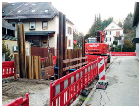
Im Frühjahr 2020 keine Baustelle mehr - die mögliche Aufstellfläche Burgstraße für eine zügige, ampelgesteuerte Querung

Weiter möchte die WBB mit einer fundierten Basis den Haushalt weiter konsolidieren. Daher beantragt die WBB-Fraktion die transparente Darstellung