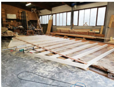
Die neue Giebelwand des Garagen- und Bootshauses ist in Produktion