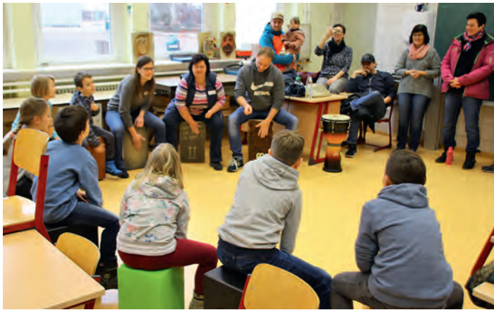
Die MusikvereinKIDS beim Trommelworkshop

der Gelegenheit verraten... Die großen Bühnen können kommen! ---