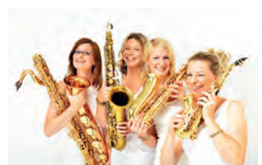
Vier Frauen, vier Saxophone - ein mitreißender Sound.

Unter www.weingartner-musiktage.de finden Sie weitere Informationen.