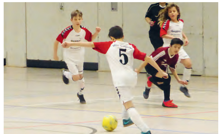
Die D-Junioren spielen die Finalrunde

Mit diesem sensationellen Erfolg krönte das Team seine tolle Leistung und steht an diesem Wochenende in der Finalrunde der Hallenkreismeisterschaft, die die besten acht Teams des Fußballkreises in Grötzingen ausspielen! Wir wünschen hierfür allen Beteiligten viel Erfolg!