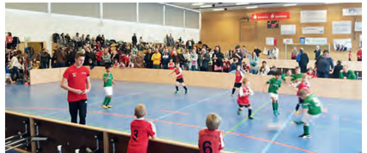
Budenzauber in der Walzbachhalle

So. 03. Februar 2019 ca. 15:30 - 18:30 Uhr E1-Jugend