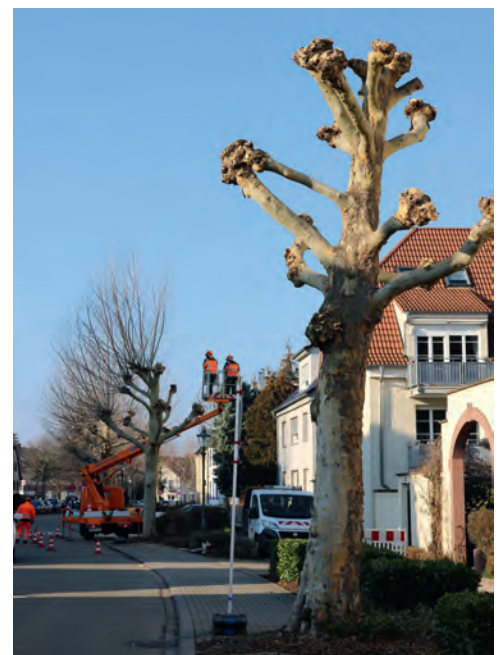
Platanen werden grundsätzlich auf Kopf geschnitten, das heißt, die Triebe werden bis zum dicken Ende am Stamm flach zurückgeschnitten.