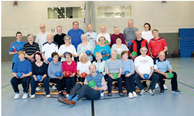
Die Herzsportgruppe im Behindertensportverein blickt auf ihr zehnjähriges Bestehen zurück

Vor genau zehn Jahren, im Februar 2009, hat sich innerhalb des Behindertensportvereins Weingarten eine Herzsportgruppe etabliert.