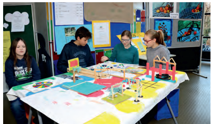
Eine Projektgruppe hatte sich mit Spielen befasst und lud die Besucher am Tag der Offenen Tür zum Mitspielen ein