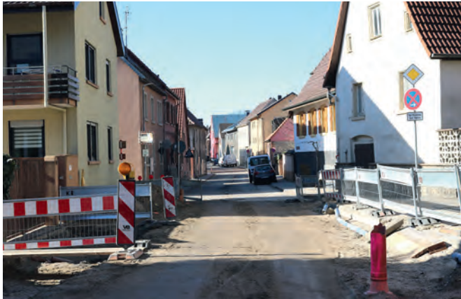
Blick Richtung Ortsmitte. Übergang zwischen Bauabschnitt eins und zwei, zugleich engste Stelle der Straße

ten. Bis zur Ortsausfahrt Richtung Jöhlingen sei Tempo 30 beantragt, bis zum Bärenentalweg aus Lärmschutzgründen bereits genehmigt. Insgesamt drei „Blitzer“ auf der gesamten Jöhlinger Straße sollen dafür sorgen, dass dieses auch eingehalten werde. Im zweiten Bauabschnitt werde der Gehweg auf der Südseite durchgängig 1,50 Meter breit sein. Um das zu gewährleisten, werde die Fahrbahn an der Engstelle Mühlstraße auf 5,25 Meter verschmälert. An der Einmündung Katzenbergweg werde die erste Fußgängerampel installiert, die zweite bei der Einfahrt auf den künftigen Parkplatz beim ehemaligen Weingut Schäfer.