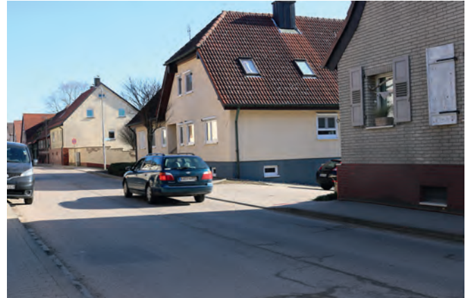
„Einfahrt zum Grundstück des ehemaligen Weinguts Schäfer. Die Gemeinde hat das Grundstück erworben und wird hier einen Parkplatz bzw. eine Parkscheune mit mindestens 30 Stellplätzen oder mehr errichten.“

kurzfristig zum Be- und Entladen angehalten werden könne. Um zu verhindern, dass gegenüber diesen Parkmarkierungen auf der Nordseite der südliche Gehweg überfahren werde, sollen Poller eingebaut werden. Die geringe Anzahl Parkflächen auf der Fahrbahn hatte die Interessengemeinschaft noch nie akzeptiert, auch jetzt nicht. Ihre Sorge galt den Sozialdiensten und privaten Besuchern.