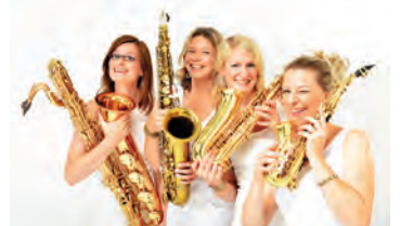
Vier Frauen, vier Saxophone - ein mitreißender Sound.

In ihrem Bühnenprogramm „Saxesse“ lädt sistergold zu einem amüsanten Ritt durch die Musik-