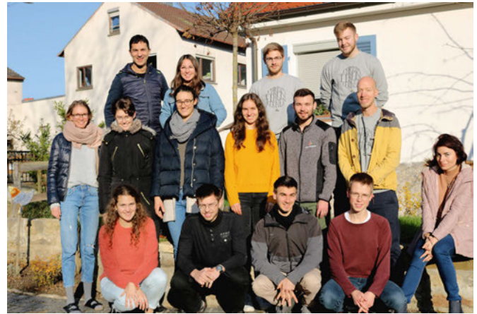
Archivfoto der Internatsschüler vom ersten Start nach Lesbos

untergebracht sein. Sie werden verschiedene Einrichtungen wie Altenheime und Jugendheime besuchen, in denen sie Andachten halten und Zeugnis geben dürfen. Es gibt die Möglichkeit, Kleidung mitzunehmen und diese vor der Rückkehr zu verschenken.