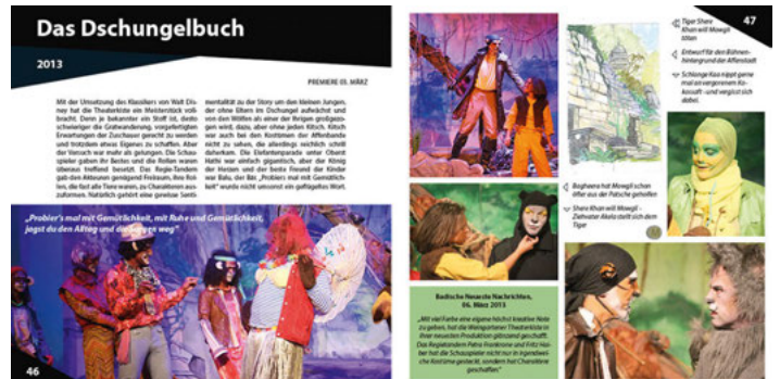
„Das Dschungelbuch“ von 2013: Nur eine der vielen bunten Seiten in unserer Festschrift

Erhältlich am Samstag beim Kartenumtausch ab 14.30 Uhr!