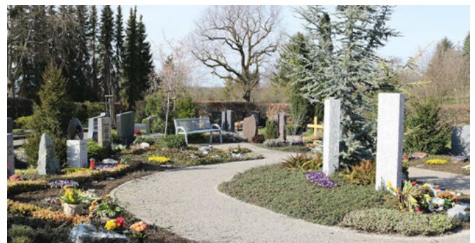
Der ältere Teil des bisher bestehenden Gärtnergepflegten Grabfeldes