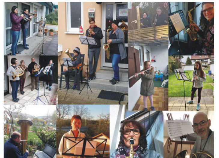
Jeder zuhause - alle zusammen, Musik verbindet uns auch jetzt

Jeder zuhause - alle zusammen! Musik am Fenster Bereits zum zweiten Mal erklang am Sonntag um 18.00 Uhr Musik am eigenen Fenster, vom Balkon oder der Terrasse. Mit dieser Aktion wollen Musiker und Musikerinnen in ganz Deutschland ein Zeichen der Hoffnung setzen. Auch wir beteiligen uns allein oder als Familie daran. So erklang diese Woche „Von guten Mächten“ und „Ode an die Freude“ auch in verschiedenen Straßen in Weingarten. Haben Sie uns gehört? Auch am kommenden Sonntag um 18.00 Uhr wird wieder Musik erklingen. Öffnen Sie Ihr Fenster und lauschen Sie.