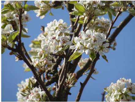
Der GV Frohsinn wünscht uns Allen, dass wir die aktuelle Situation gut überstehen!

Bitte singt in der aktuellen Situation nur alleine oder mit der Familie zuhause. Wir freuen uns darauf, hoffentlich bald wieder gemeinsam singen zu können. Bleibt gesund und trotz Allem gut gelaunt! Neue Termin-Informationen geben wir in der Turmberg-Rundschau und auf www.frohsinn-weingarten.de bekannt.