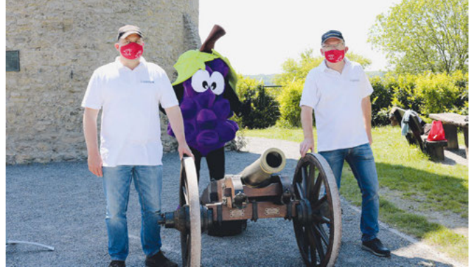
Die Kanone des Schützenvereins knallt zum traditionellen Startschuss

Die Gemeinde Weingarten wünscht allen Läufern viel Spaß und Erfolg in den kommenden zwei Wochen!