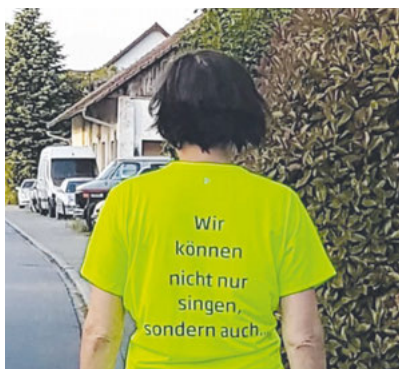
Laufen für blut.eV: Gelegentlich sieht man die Laufshirts des GV Frohsinn schon, und es werden mehr!

Auch weiterhin wünschen wir allen Vereinsmitgliedern, Familienangehörigen und Freunden des Frohsinn: bleibt gesund!