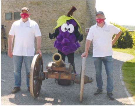
OSM Langendörfer (re) und 1. SM Winheim (li) mit dem Weingartner Maskottchen Träuble.

In diesem Jahr ist alles anders beim Weingartner Lebenslauf. Die Corona-Pandemie hat den Organisatoren einen gehörigen Strich durch die Rechnung gemacht und so war guter Rat teuer. Mit dem „Virtual Run“ hat der Verein Blut e.V., der sich zum Großteil durch die beim Lebenslauf gesammelten Spenden selbst finanziert, das bestmögliche daraus gemacht und hofft nun auf viele Teilnehmer und Spenden.