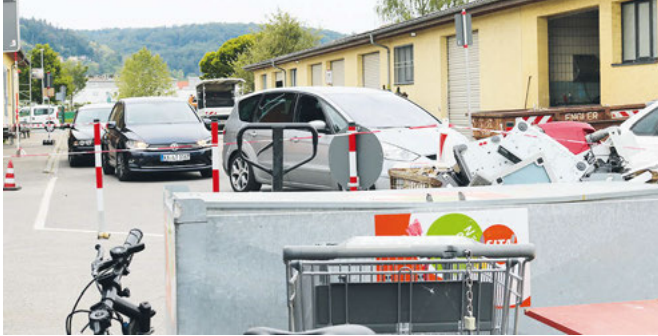
Wartende Autos, die nur nacheinander eingelassen werden