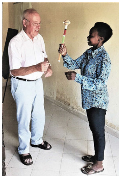
Victoria presents the bar of friendship

Der Freundeskreis DZARINO e.V. in Weingarten hat allen Grund, sich zu bedanken. Nachdem er zu Beginn des Jahres die Hilfe für die Renovierung der Vorschule sowie für die Erweiterung der Sanitäranlagen abgeschlossen hatte, war es ihm möglich, durch die Abgabe von etwa 250 einfachen Corona-Schutzmasken gegen eine Spende etwa 900 € zu sammeln. Für diese Geldspenden sagt der Freundeskreis allen Spendern herzlichen Dank! Besonders auch der Spenderin der Schutzmasken. Der Betrag ist vorgesehen für die Unterstützung der kenianischen Partnerorganisation DZARINO CBO bei der Fortbildung und den verschiedenen Beihilfemaßnahmen für die drei Lehrerinnen der TUMAINI-Vorschule , z.B. bei Fahrt-, Verpflegungs- und Arztkosten. DZARINO CBO hatte für diesen Förderposten um ca. 1.300 € Hilfe im Jahr 2020 gebeten. Es fehlen noch 400 €! Helfen Sie uns bitte wieder so