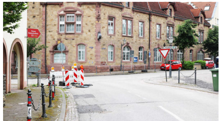
Das wäre in etwa der Platz für den Kreislauf – wenn er denn gebaut wird.

Noch ist nichts entschieden, denn parallel hat die Gemeinde einen Antrag an das Verkehrsministerium gestellt, in wieweit der Ausbau einer Kreisverkehrs-Anlage verkehrstechnisch genehmigungsfähig wäre und das Land die Kosten bei Vorfinanzierung der Gemeinde dann übernehmen würde, wenn die heute bestehende Anbindung ihre Leistungsgrenze erreicht habe. Das Gremium nahm dieses Vorgehen zur Kenntnis.