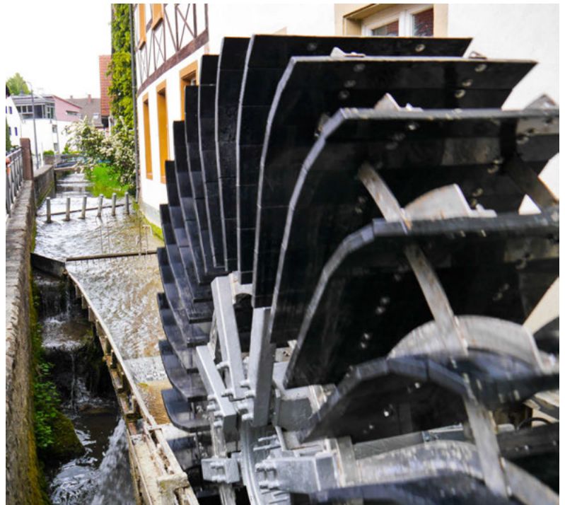
Die neuen Kunststoffschaufeln sind alle montiert, das Wasserrad läuft wieder rund.

Ein offizieller Eröffnungstermin gemeinsam mit der Kulturstiftung der Sparkasse Karlsruhe, die die Reparatur des Wasserrads mit Spenden möglich gemacht hat, steht noch aus.