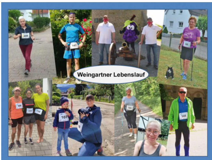
Weingartner Schützen laufen mit.

Spendenkonto: Blut e.V. bei der Volksbank Stutensee-Weingarten eG IBAN: DE 31 6606 1724 0031 2222 22,.