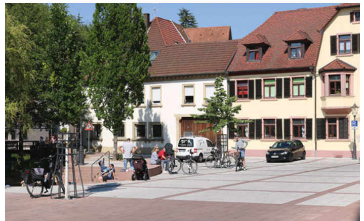
Ostseite des Kirchplatzes