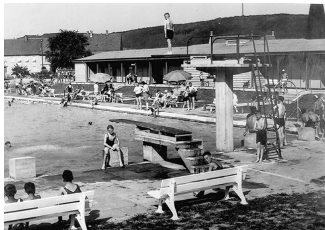
Das ehemalige Freibad, das 1935 eröffnet wurde, war das erste seiner Art im damaligen Landkreis Karlsruhe. Viele Weingartener trauern ihm heute noch nach, da es bisher keinen adäquaten Ersatz gefunden hat.

Die „Weingartener Heimatblätter“ sind zum Preis von fünf Euro bei der Buchhandlung Carolin Wolf, vormals „Bücherwurm“ und beim Bürger- und Heimatverein erhältlich.