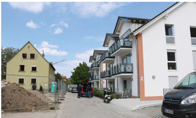
Vorher - nachher: das linke Gebäude ist Altbestand, die Häuser auf der rechten Seite sind neu

Für diesen Gesamtkomplex erhalte die Genossenschaft eine Förderung durch die Kreditanstalt für Wiederaufbau (KfW) als Darlehen in Höhe von 1,4 Millionen Euro zu Sonderkonditionen für klimafreundliches Bauen. Die voraussichtlichen Gesamtkosten für das Projekt betragen 3,2 Millionen Euro. Am Bau beschäftigt werden Firmen aus der Region, die über eine beschränkte Ausschreibung ermittelt worden seien. Die Fertigstellung sei in einem starken Jahr geplant. Die gute Vorgabe des Vorstandes habe einen einstimmigen Beschluss des Aufsichtsrates herbeigeführt, sagte dessen Vorsitzender Michael Weickum. Es gehe darum, wirklich guten Mietraum zu schaffen. Insgesamt sei das Gesamtprojekt sehr gelungen, ergänzte Torsten Hill. Die ganze Mülbergerstraße sei ein richtiger Wohnpark geworden.