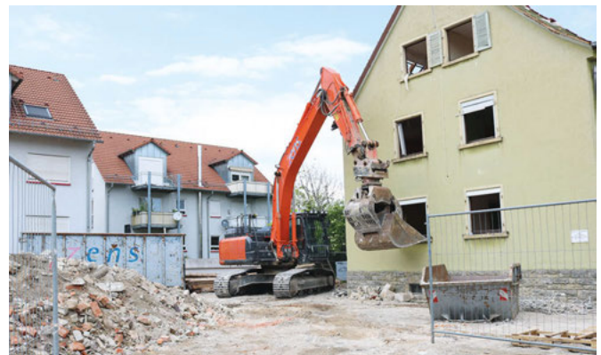
Der Bagger ist bei der Arbeit, eines der letzten beiden Häuser ist bereits platt