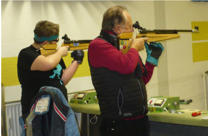
Seite an Seite schossen Schüler und Senioren um den Generationenwanderpokal