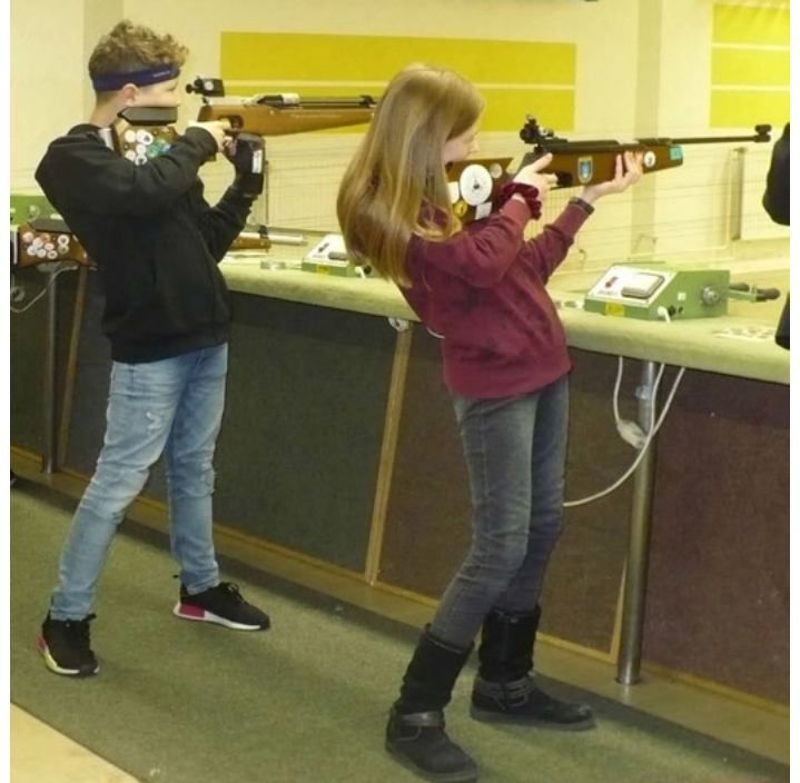
Auch die Schützenjugend war eifrig bei der Sache.