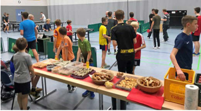
Das schmackhafte und liebevoll angerichtete Buffet ist eröffnet