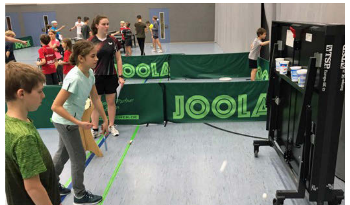
Spiel und Spaß beim Abschlusstraining kurz vor Weihnachten