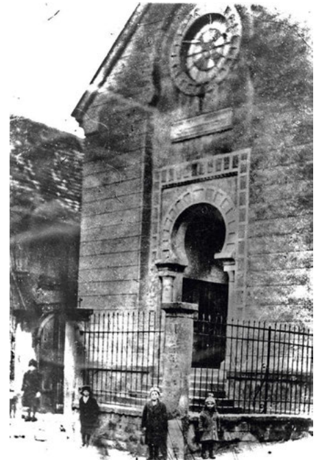
An der Einmündung der Keltergasse in die Kirchstraße stand bis zu ihrer Verwüstung und Zerstörung die 1849 die im maurischen Stil erbaute Synagoge der Weingartener Juden.

Wer mehr über die „Geschichte der Juden in Weingarten“ wissen möchte, dem sei die gleichnamige Broschüre des Autors Hayo Büsing empfohlen, die der Bürger- und Heimatverein bereits 1991 in erster und 2004 in zweiter Auflage herausgegeben hat.