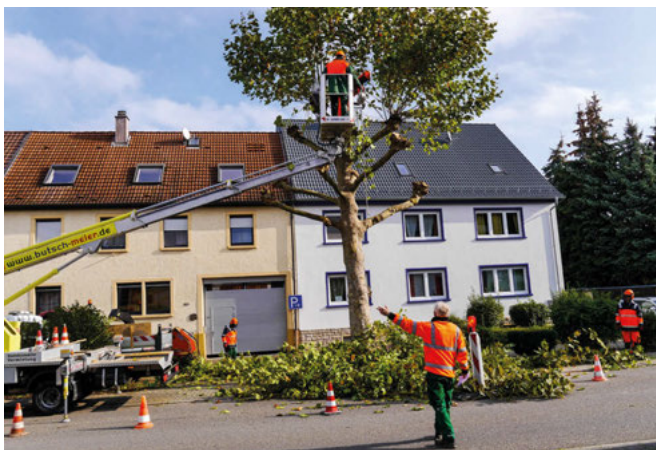
Ein Mitarbeiter ist während der Baumpflege jeweils für die Lenkung des Durchfahrtsverkehrs zuständig.