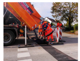
An insgesamt drei Stellen in der Bahnhofstraße wurde der Asphalt ausgebessert.

Eine Herausforderung bei Platanen im Ortskern stellen die Wurzeln dar. Diese werden mit den Jahren immer dicker und stärker - so kann es schon vorkommen, dass sich in der Folge an einigen Stellen der Asphalt anhebt. Eine solche Stelle musste der Bauhof diese Woche gegenüber der Einbiegung in die Spitalstraße ausbessern. Die Wurzel wurde gekappt und der Asphalt neu aufgebracht. An zwei weiteren Stellen wurde im gleichen Zuge ebenfalls der Straßenbelag ausgebessert.