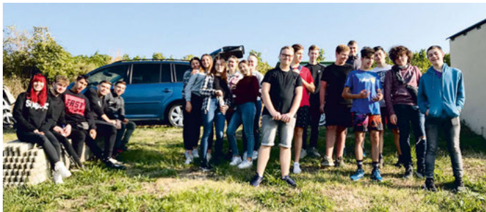
21 fleißige Helfer bei ersten Weinlese im neuen Schulweinberg