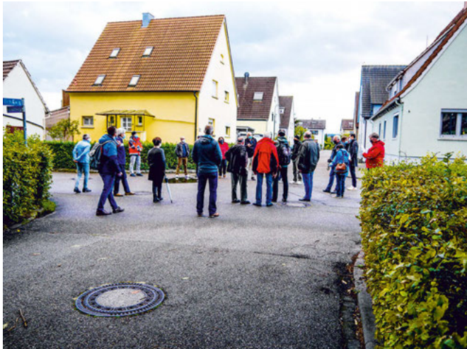
Soll am Ulmenplatz ein verkehrsberuhigter Bereich entstehen? Darüber tauschten sich die Teilnehmer der Begehung aus.

Den ersten Anlass zur Diskussion gab ein ehemaliger Radweg im Forlenweg, der auf der linken Seite der Fahrbahn bestanden hatte. „Falsch!“ urteilten die Gegner. Aber dieser Radweg führte die Schulkinder direkt zur Ampel, ohne dass sie den Forlenweg zweimal kreuzen mussten, entgegneten die Befürworter. Die Lösung war: Heute herrscht im Forlenweg Tempo 30, also sei kein parallel führender Radweg zulässig. Nächster Halt: Gehwegparken im Ahornweg. Hier besteht ein Konflikt zwischen schmalem Gehweg und schmaler Straße. Parkt das Fahrzeug