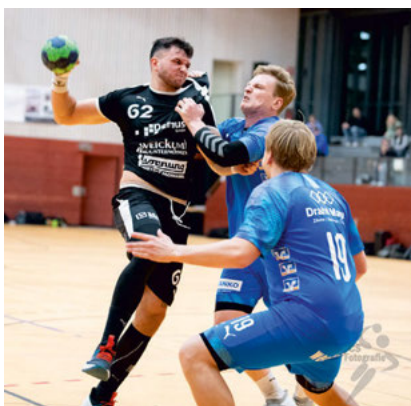
Die jungen Talente der SGSW spielten erneut mutig mit