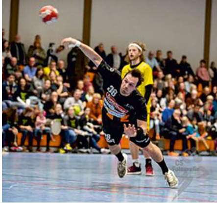
„Nichts geht mehr - keine Zuschauer, keine Spiele.“

Was viele Menschen schon im Mai befürchtet hatten, ist nun Wirklichkeit geworden. Das Corona Virus hat die Menschheit immer noch im Griff und wird uns lange Zeit auch noch nicht aus seinen Klauen lassen. Wie schon im Frühjahr suchen die Verantwortlichen im unserem Staat nach Möglichkeiten, der Pandemie zumindest etwas Einhalt zu gebieten. Mit einem „gebremsten“ Lockdown versucht man die drastische Entwick-