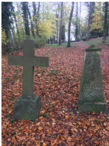
Grabsteine aus der Badischen Revolution 1848/1849

für die Gewerbe- und Wohnflächen in Weingarten keine Änderungen ergeben haben. Ferner wird darin festgeschrieben, dass sich mit Ausnahme der vom Gemeinderat zuletzt gegen die Stimmen der SPD beschlossenen Erweiterung der Kiesabbaufläche im Umfang von 5,9 Hektar keine weiteren Flächen mehr zum Kiesabbau vorgesehen sind. Gegenstand des Flächennutzungsplans ist auch die rechtlich ausgewiesene Konzentrationszone für Windräder am Hinteren Heuberg. Damit ist aber nach Auffassung der SPD noch keine Entscheidung über den Bau des geplanten Windparks getroffen