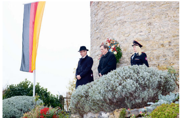
Archivfoto, Volkstrauertag 2019

Hinweis: Ansammlungen sind nur gestattet mit Angehörigen des eigenen Haushalts oder mit Angehörigen des eigenen und eines weiteren Haushalts einschließlich deren Ehegatten, Lebenspartnern, Partnern einer nichtehelichen Lebensgemeinschaft, Verwandten in gerader Linie, mit insgesamt nicht mehr als 10 Personen.