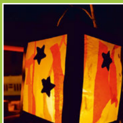
Sankt Martin 2020 Seite 8