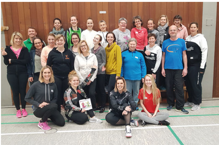
Unterstützen Kleinkinder spielerisch bei der Entwicklung und Förderung von Bewegung und Motorik: 24 Übungsleiterinnen und Übungsleiter von Sportvereinen sind überzeugt vom Bewegungspass.

In den letzten Jahren haben motorische Auffälligkeiten bei Kindern besorgniserregend zugenommen, gleichzeitig hat die Bewegungsfreude auffallend abgenommen. Dem kann der Bewegungspass abhelfen, der mit Unterstützung des Sozial- sowie des Kultusministeriums in ganz Baden-Württemberg verbreitet werden soll. Er unterstützt Eltern, Kindergarteneinrichtungen und Sportvereine, wenn sie Kinder von zwei bis sieben Jahren spielerisch an grundlegende Bewegungsfertigkeiten heranführen. Dabei wurden die Freude an der Bewegung gefördert und die motorischen Fähigkeiten unterstützt. Die Gesundheitskonferenzen aus Stadt und Landkreis Karlsruhe haben gemeinsam mit dem Schul- und Sportamt der Stadt