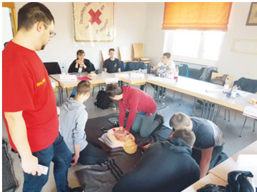
Erste-Hilfe-Kurs: Training der Herz-Lungen-Wiederbelebung (HLW) mit „Little Anne“

Am 15.02.2020 veranstaltete die DLRG Ortsgruppe Weingarten einen Erste-Hilfe Kurs im Rahmen der Rettungsschwimmausbildung. Unter der Leitung von Ralph Dämmer wurden von den 13 Teilnehmern die Grundlagen der Erste Hilfe in Theorie und Praxis erlernt. Neben den Themen wie Notruf, Verbände, Sonnenstich und Verbrennungen, welche zur tagtäglichen Arbeit eines Rettungsschwimmers gehören, wurde auch die Herz-Lungen-Wiederbelebung sehr intensiv geübt. Dabei wurden auch mehrere Automatische Externe Defibrillatoren (AED) eingebunden, um den Umgang mit den Geräten zu trainieren. Die DLRG-Ortsgruppe bedankt sich beim DRK Weingarten für die Bereitstellung der Räumlichkeiten sowie bei den Ausbildungshelfern Stephanie Friederich und Martin Schmidt für die Mitarbeit.