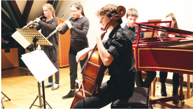
Quartett mit zwei Oboen, Violoncello und Cembalo

Das 40. Jahr ihres Bestehens feiern die Weingartner Musiktage Junger Künstler mit vier Sonderkonzerten und präsentierten mit dem ersten ein Novum: eine Kooperation mit dem Badischen Konservatorium in Karlsruhe.