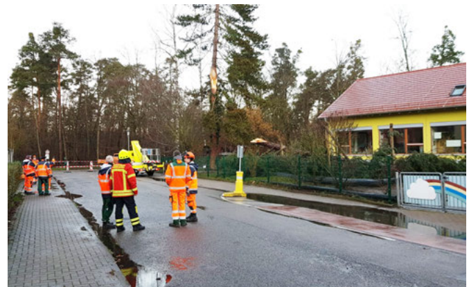
Bauhof und Feuerwehr in der Waldbrücke gemeinsam im Einsatz

Ein großes Dankeschön gilt allen Einsatzkräften, die in der Sturmnacht im Einsatz waren.