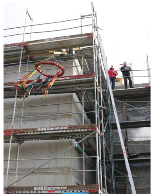
Ein Kranz mit bunten Bändern zum Richtfest