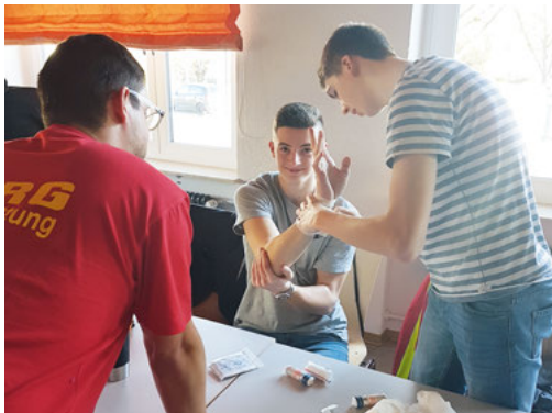
Erste-Hilfe-Kurs: auch das richtige Anlegen von Verbänden muß geübt werden!

Einen weiteren Erste-Hilfe-Kurs veranstaltet die DLRG-Ortsgruppe Weingarten am 29.02.2020 . Dieser steht auch interessierten Nichtmitgliedern offen. Es sind noch Plätze frei . Die Mindestteilnehmerzahl beträgt 8 Personen.