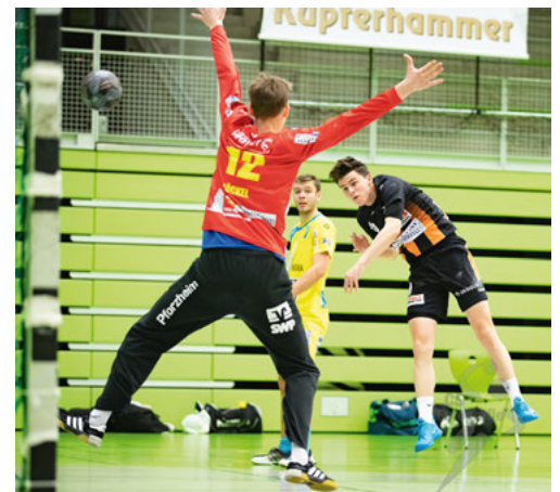
Als die SGSW über die Außen angriff, stellte sich der Erfolg ein