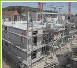
Mittendrin leben Seite 5