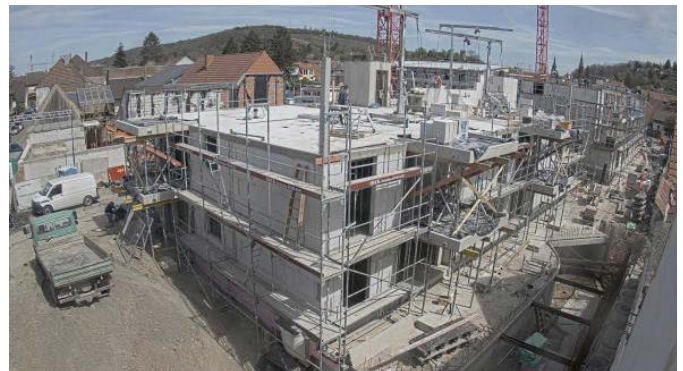
Blick von der Kanalstraße auf das Mehrfamilienhaus (Aufnahme der Baucam)

Nach Abschluss der aufwendigen Generalsanierung der Baufläche einer ehemaligen Industriebrache kam das Projekt mit dem Generalunternehmer Weisenburger in den vergangenen 12 Monaten gut voran. Sechs Monate waren für die notwendige Pfahlgründung erforderlich gewesen, im Dezember 2020 wurde mit dem Hochbau begonnen. Auf gut 9000 Quadratmetern entstehen ein Pflegeheim mit 90 Zimmern