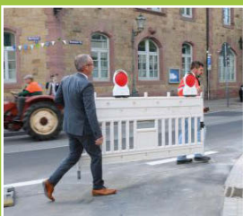
Eröffnung Jöhlinger Straße Seite 4