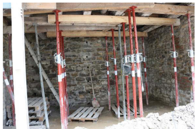
Die Bohrlöcher in der Natursteinmauer sind deutlich erkennbar. Durch diese wird Injektionsmörtel eingepresst

Die Firma Bau Sanierungstechnik aus Gernsheim gilt als Spezialist und hat dieses Verfahren patentieren lassen. Ihr Angebot liegt bei knapp über 100.000 Euro. Da das Anwesen Bruchsaler Straße 12 im Sani-