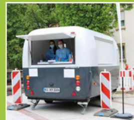
Testmobil Kanalstraße / Kirchplatz Seite 6