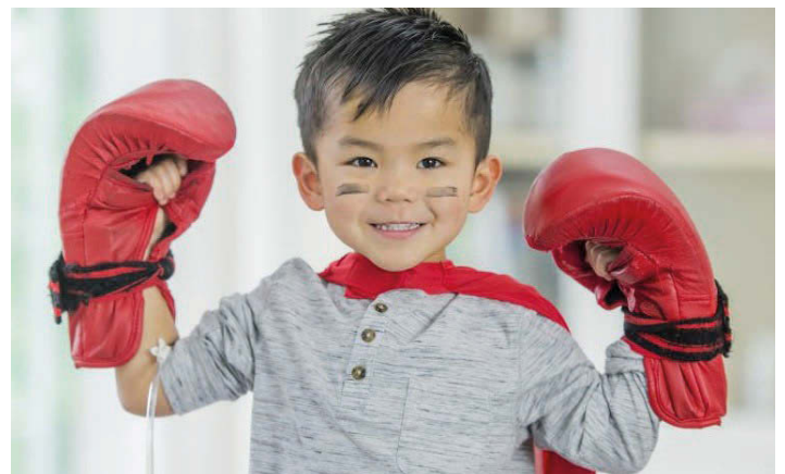
wir boxen uns durch!

oder über unser Spendenportal auf der Homepage.