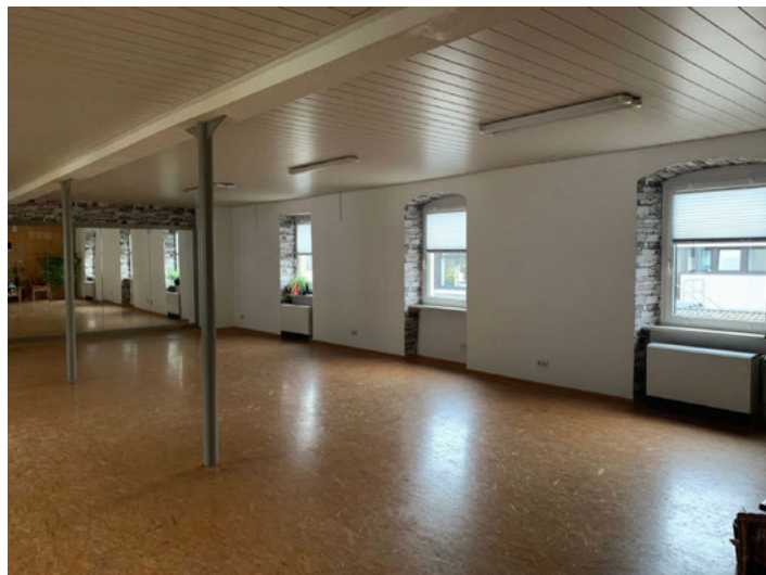
Trainingsraum in Bruchsal, Nebenstelle Rehasport ActivePlus Weingarten e.V.

Informationen und Anmeldungen unter Mail: active-plus-ev@web.de oder Tel: 07244-709384 (auf AB sprechen)