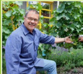
Aktuelles zum Weinbau Seite 5