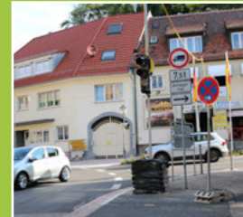
Aus dem Gemeinderat ab Seite 6