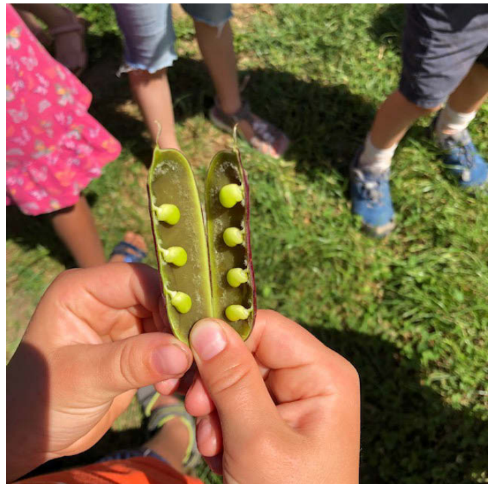
Blauwschokkererbse von innen