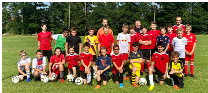
Unsere motivierten D-Junioren

In den nächsten Wochen sollen die Rückstände aus der pandemie-bedingten Pause mit intensivem Training aufgeholt werden. Die Kinder haben bereits mit großer Begeisterung und sehr viel Engagement damit begonnen, so dass der im Herbst beginnenden Saison mit Zuversicht entgegengeblickt werden kann.