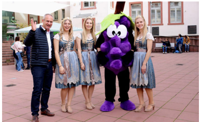
Verkaufsoffener Sonntag 2019

und verblüfft, aber alle freundlich. Sie lächelten, winkten und machten Selfies. Die Kinder kamen gerne näher. Einige waren schüchtern, aber einige Frechdächse wollten es zu gern wissen und zupften auch ein