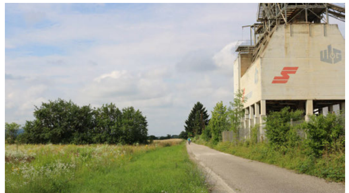
Im Bereich beim Kieswerk (am rechten Bildrand) soll Richtung Süden der künftige Bohrplatz sein.