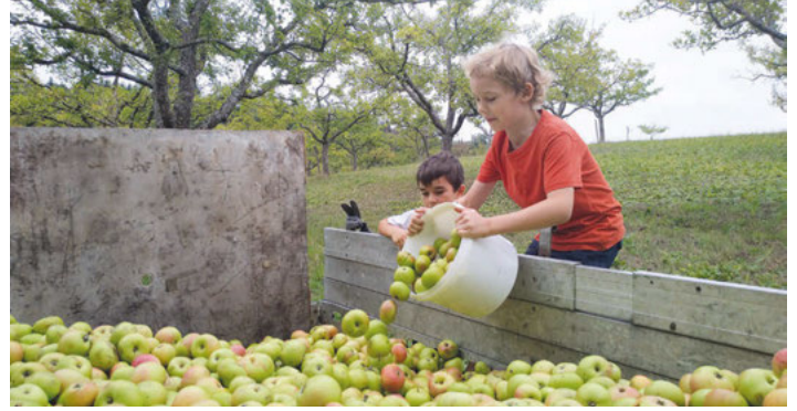
Vor dem Pressen kommt das Ernten

Eine Anmeldung wird ab dem 13.9. telefonisch bei Caro Barber unter 0176/24304979 möglich sein. Eine ungefähre Mengenangabe ist für die Terminvergabe erforderlich.