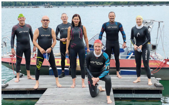
Die (noch nicht ganz vollzähligen) Teilnehmer des 11. Schwertfischschwimmens vor dem Start

21.09.2021: Vorstandssitzung, 19:00 Uhr an der Wache