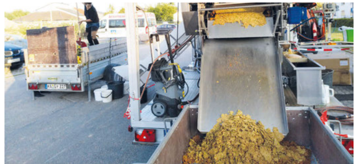
Das Ergebnis: leckerer Saft und viel Trester..