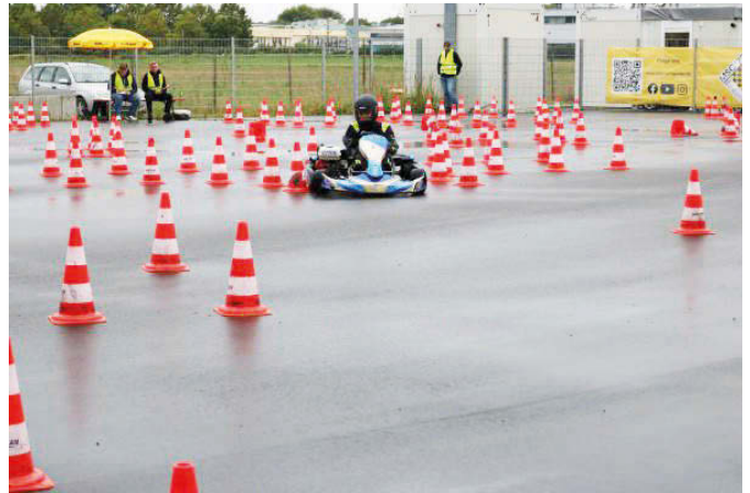
Foto: Zentimetergenau und trotzdem schnell sein – das ist Kartfahren

Jetzt starten die Fahrer der höchsten Altersklasse, 16 bis 18 Jahre. Der Leistungsunterschied zu den Vorgängern ist kaum zu sehen. Aber zur dann darauffolgenden Altersklasse eins. Die Sieben- bis Neunjährigen fahren keineswegs weniger konzentriert, aber eben um einiges langsamer.