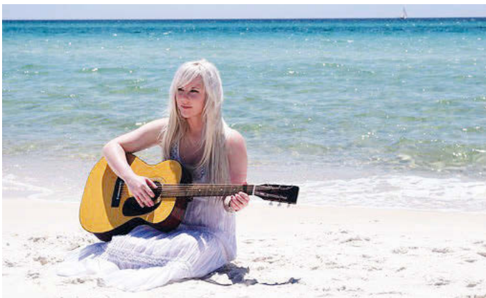
Musik am Strand!

Die Gebührenordnung finden Sie auf unserer Homepage, www.musikschule-hardt.de , die Ihnen außerdem viele Informationen zu unserer Schule und unseren Lehrkräften bietet. Fragen Sie uns, wir beraten Sie gerne! Tel. 07249-1859. E-Mail: sekretariat@musikschule-hardt.de . Wir freuen uns darauf, von Ihnen zu hören! Ihr Musikschulteam