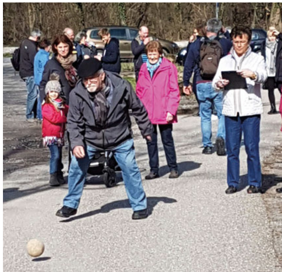
Ein Event für die ganze Angler-Familie

In diesem Jahr wollen wir das Boßel-Event wieder stattfinden lassen. Am 20.03.2022 um 10 Uhr rollt endlich mal wieder die Holzkugel. Wir freuen uns auf zahlreiche Teilnehmer. Das Boßeln findet in der freien Natur statt, wir desinfizieren und zum Mittagessen nutzen wir die Terrasse des Vereinslokals. Unser Smutje Georg sorgt für das leibliche Wohl. Zur besseren Planung meldet Euch bitte unter info@anglerverein-weingarten.de oder telefonisch unter 07244/3517 bis zum 17. März 2022 an. Willkommen sind auch alle, die nicht mitlaufen können aber beim Mittagessen dabei sein wollen. Salat- und Kuchenspenden können gerne mitgebracht werden.