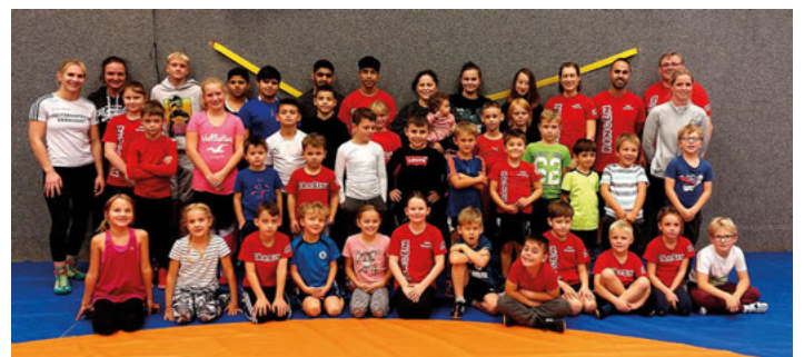
Die Ringerkids des SV Germania Weingarten