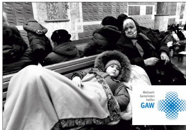
Foto: Menschen bringen sich in der Metro in Charkiw in Sicherheit.

Aktuelle weiteren Informationen erhalten Sie im Schaukasten und auf der Homepage www.ekiwei.de