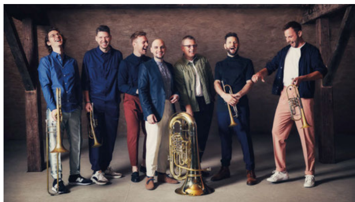
Federspiel: 1.5., 10:30 Uhr

Tickets gibt es bei der Buchhandlung Wolf in Weingarten (Eingang Schillerstraße, ehemals Bücherwurm), sowie bei deren Filialen in Bruchsal und Oberderdingen, beim Musikhaus Schlaile (Karlsruhe), bei allen Reservix-Verkaufsstellen und Online bei www.weingartner-musiktage.de/tickets im Internet.