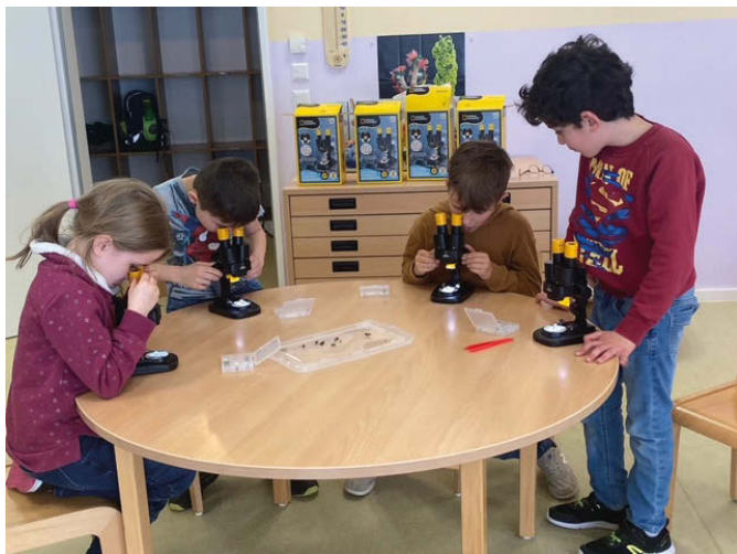
Eifrig beugen sich die Kinder über die neuen Mikroskope, gespannt, was sie alles sehen werden