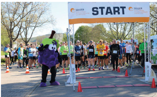
Das Träuble beim Träublelauf: Am Ostersonntag hatte der neu installierte Zehn-Kilometer-Lauf seine Premiere und wird sich ab jetzt in der Lauflandschaft der Region am dritten Sonntag im April etablieren.

Am Ostersonntag durfte der TSV Lauftreff endlich nach zweijähriger pandemiebedingter Verschiebung bei strahlend blauem Himmel und Sonnenschein zahlreiche Läuferinnen und Läufer auf die Laufstrecke schicken.