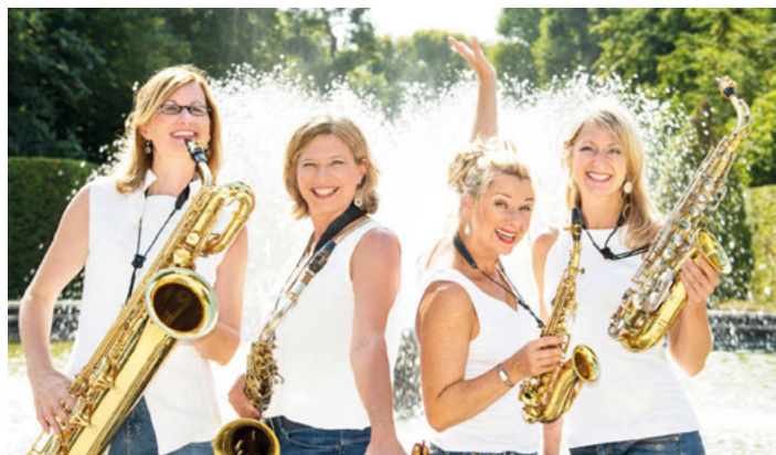
Sistergold: 31.4., 20 Uhr

Darbietung, mit überraschenden Arrangements und großer Leidenschaft für die Musik. Eben mit Allem, was dazugehört. Vier Berufsmusikerinnen am Saxophon, die mit ihren Persönlichkeiten und unterschiedlichen Charakteren zu einer Einheit verschmelzen – in ihrer Musik, in ihrer Energie und mit funkelnem Spaß.