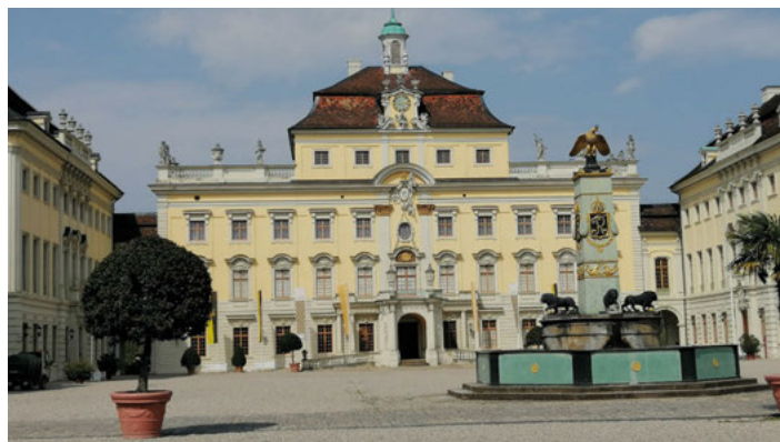
Schloss in Ludwigsburg

und sein historisches Rathaus sehr bekannt. Nach einem kurzen Rundgang und Besichtigung der Bartholomäuskirche werden wir im Gasthaus „Zum Bären“ zu Mittag essen. Danach geht die Fahrt weiter nach Ludwigsburg zu dem prachtvollen Schloss und zum „Blühenden Barock“; in diesem größten Garten von Ludwigsburg gibt es herrliche Rosenrabatte, barocke Blütenornamente und plätschernde Springbrunnen zu bestaunen.