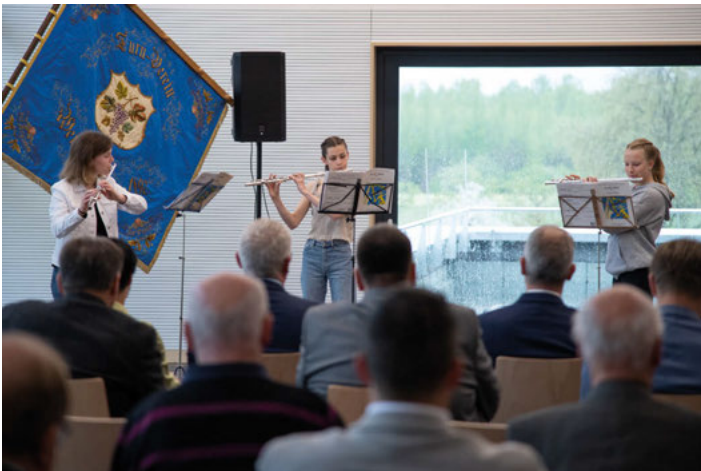
Querflöten-Ensemble JMS Unterer Kraichgau