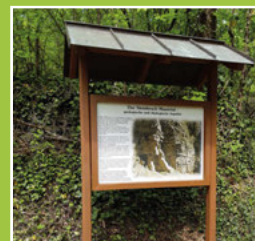
Lehrtafeln und Wanderrouten Seite 4-5