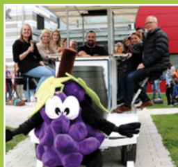
Das WeinVelo: Die fahrende Weinprobe Seite 4