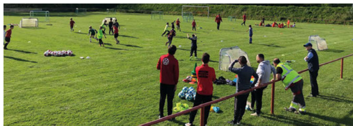
Das DFB-Mobil war in Weingarten aktiv

Die Veranstaltung war ein voller Erfolg, nicht zuletzt aufgrund der sehr engagierten Einweisungen der beiden Trainer des DFB.