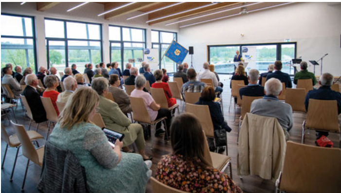
Ein stimmungsvoller Vormittag im Saal des GEGGUS Sportpark