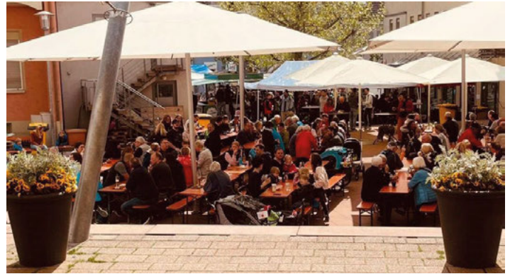
Ein vollbesetzter Rathausplatz

Nach zwei Jahren Auszeit durfte die Turnabteilung ihre Gäste endlich wieder bewirten. Bei angenehmen Temperaturen, Sonne und blauem Himmel drängten die „Festhungrigen“ auf den Rathausplatz und mussten zeitweise lange in der Schlange stehen. Doch schmackhafte Rostbratwurst, Steakweck, Pommes und Weißwurst entlohnten die Warterei. Dazu noch ein frisch Gezapftes oder einen prickelnden Rosé in geselliger Runde – die Stimmung war perfekt.