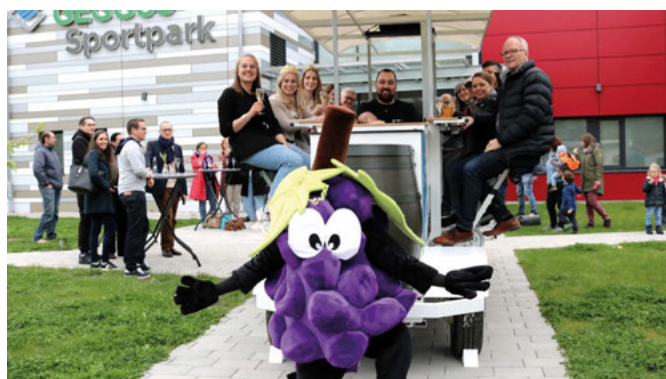
Auch das Träuble wünscht: „Gute Fahrt und viel Spaß!“

Anfragen nach einer Tour und weitere Auskünfte unter www.weinvelo.de oder unter 017684290081.