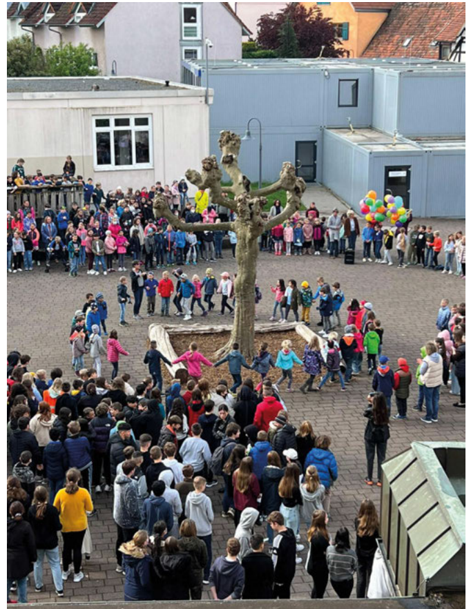
Mit Tanzen, Singen und einer fröhlichen Einschulungsfeier wurden die Kinder aus der Ukraine in der Turmbergschule willkommen geheißen.

verstärkt versuchen, das Interesse der ukrainischen Kinder an nicht sprachrelevanten Fächern, wie Sport und Musik zu wecken, damit auch die soziale Integration gelinge. „Organisatorisches und pädagogisches muss ineinander greifen und bedarf einer Unmenge an Absprachen“ resümieren die drei Pädagoginnen.