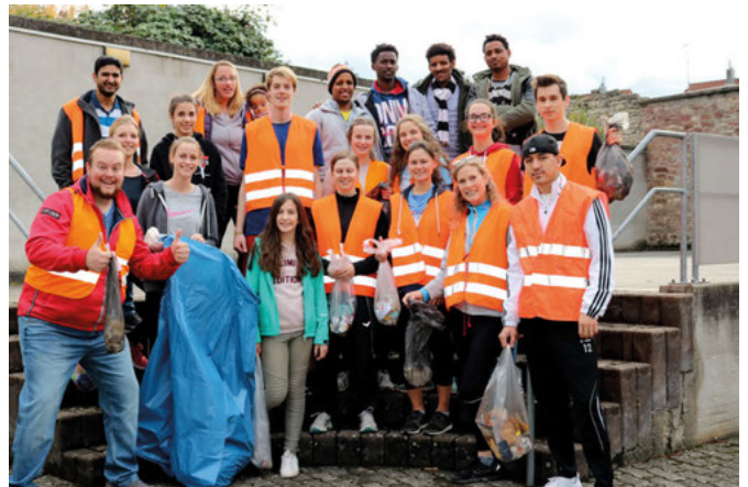
CVJM beim Plogging. Es ist ein Archivfoto, aber an Aussage und Absicht der Aktion hat sich nichts geändert

Seit etlichen Jahren betreibt der CVJM regelmäßiges Plogging (das bedeutet Joggen und gleichzeitig dabei Müll zu sammeln). Auch der CVJM Weingarten macht hin und wieder dabei mit. Unser Foto zeigt eine Gruppe aus dem Jahr 2018. Die Menschen, die sich am vergangenen Wochenende auf den Weg gemacht haben, sind nicht mehr dieselben, aber der Sinn der Aktion ist der gleiche geblieben: Sauberhalten unserer Heimat und im weitesten Sinne Bewahrung der Schöpfung. Trotz des nicht sonderlich einladenden Wetters am Samstagvormittag hatten sich einige unerschrockene CVJM-Mitglieder ein weiteres Mal aufgemacht, um in diesem Gedanken die Natur von Müll zu befreien. Sei es auch nur in der Bahnhofstraße, die sich das Team an diesem Tag vorgenommen hatte. Weiter wurden noch die Burgstraße und einige andere Straßen abgelaufen. Selbst auf asphaltierten Straßen in der Ortsmitte kamen letztendlich doch einige Säcke von Müll zusammen. Beispielhaft waren rund 60 Masken, die allein in der Bahnhofstraße gefunden wurden. Nicht mehr gebraucht, weg damit, einfach auf den Boden oder ins Gebüsch geworfen.