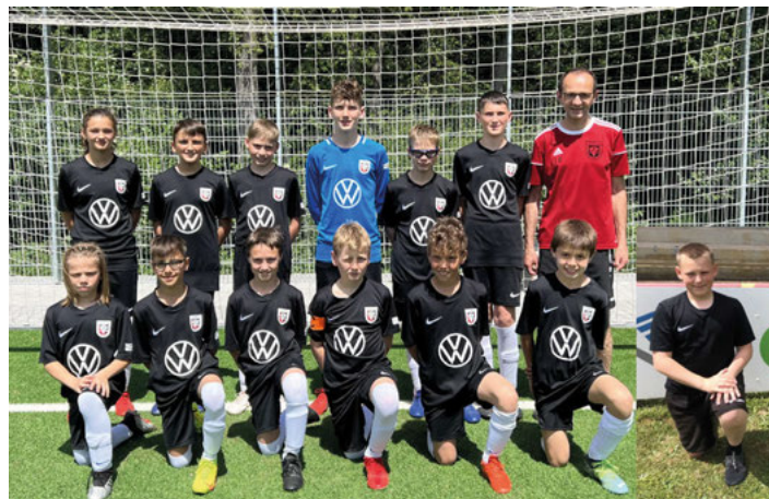
Unsere D1-Junioren spielen in der höchsten D-Jugend-Liga

Die D1-Jugend feierte mit einem achtbaren achten Platz in der Kreisliga Karlsruhe ihren diesjährigen Saisonabschluss. In einer sehr intensiven Vorbereitung haben sich die Kinder der Jahrgänge 2009 und 2010 mit viel Fleiß daran gemacht, das Ziel des Klassenerhalts zu erreichen. Das Team hat dabei große Schritte in seinen spielerischen und taktischen Fähigkeiten gemacht und konnte sich gegen die besten Mannschaften im Kreis Karlsruhe behaupten. Hinzu kommt, dass die Mannschaft in der Fairplay-Liga den ersten Platz belegt hat. Ein besonderer Dank gilt auch den Eltern, die den Kindern den nötigen Freiraum für ihr sportliches Hobby ermöglicht haben.