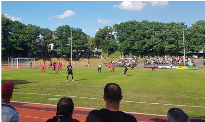
Ein verdienter Sieg in Waldbronn

Im Folgenden war dann die spielerische Überlegenheit unserer Mannschaft deutlich bemerkbar, sie kam bis zum Schlusspfiff nicht mehr wirklich unter Druck. So war der 1:0-Sieg am Ende verdient, die FVgg steht nun im Entscheidungsspiel um den Aufstieg in die Landesliga. Das Entscheidungsspiel gegen den Gewinner des anderen Halbfinals – den Landesliga-Viertletzten der vergangenen Saison – findet am Sonntag, 19. Juni gegen den SV Kickers Büchig statt. Am Redaktionsschluss dieser Ausgabe standen Austragungsort und Uhrzeit noch nicht fest, bitte informiert euch über www.fvgg-weingarten.de , hier werden die Daten nach Bekanntgabe sofort veröffentlicht.