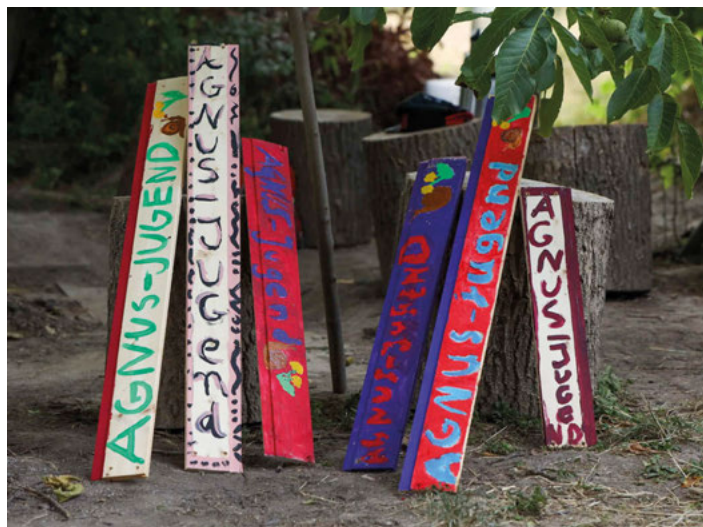
Die Schilder für unsere Obst-Bäume