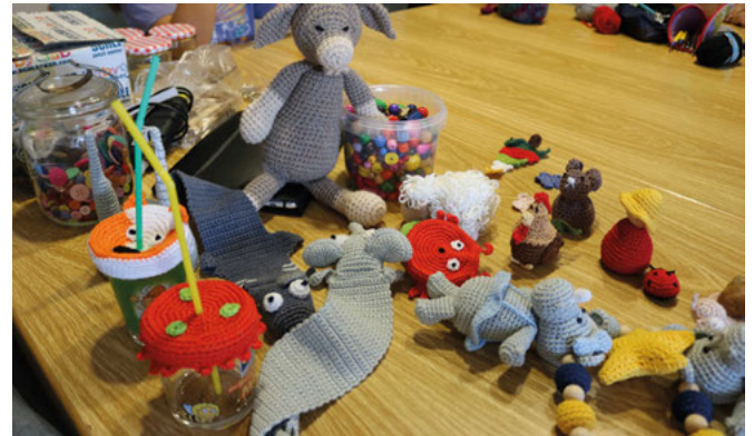
So kreativ kann Häkeln sein