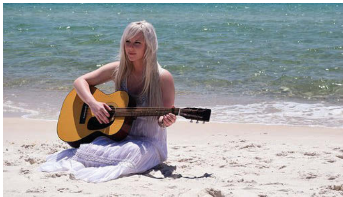
Auch im Urlaub - das pure Vergnügen!