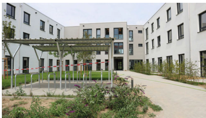
Blick auf den Haupteingang des Pflegeheims