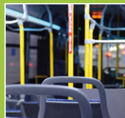
Umleitungen bei den KVV Buslinien Seite 17