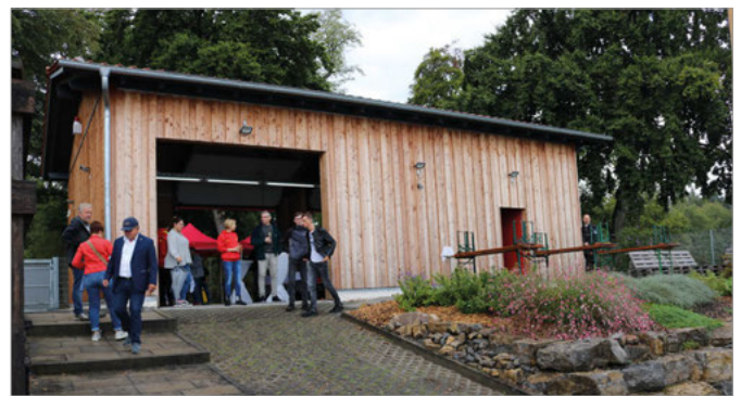
Das neue Garagengebäude von der Seeseite her

Das grundgereinigte, frisch gestrichene und komplett innensanierte alte Wachhäuschen rundet das Ensemble jetzt sinnvoll, zweckmäßig und ansprechend ab.