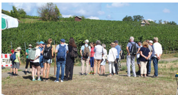
Geführte Wandergruppe im Löwental