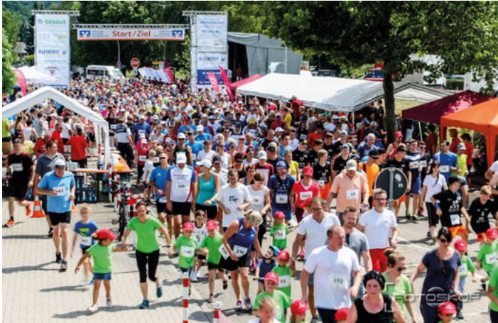
17. Weingartner Lebenslauf 2022