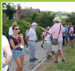
Rückblick Wein-Wandertag Seite 5