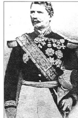
Auf diesem historischen Foto präsentiert sich General Hermann von Kanzler mit seinen Orden und Auszeichnungen.

Im Zeichen des Gedenkens an General Hermann von Kanzler Bürger- und Heimatverein lädt zum „Tag des offenen Denkmals“ ein Seit 1993 findet unter der Koordination der Deutschen Stiftung für Denkmalschutz immer am zweiten Sonntag im September der „Tag des offenen Denkmals“ statt. In diesem Jahr steht er am 11. September unter dem Motto „KulturSpur. Ein Fall für den Denkmalschutz“. Dabei werden gemeinsame Geschichte und Geschichten rund um Denkmale und Personen ermittelt und dem interessierten Publikum präsentiert. In Weingarten hat sich in den vergangenen Jahren der Bürger- und Heimatverein gemeinsam mit engagierten Mitbürgerinnen und Mitbürgern dieses Anliegens angenommen. Außer dem Museum im Turm wurden auch sehenswerte private Anwesen wie zum Beispiel der Fränkischen Hof und das ehemalige katholische Schulhaus in der Kirchstraße 27 der Öffentlichkeit präsentiert. Beide Anwesen wurden von ihren Eigentümern Professor Heinz Trauboth bzw. der Familie Richard Krumes vorbildlich restauriert und können auf eine 400-jährige bzw. 300-jährige Geschichte zurück blicken.