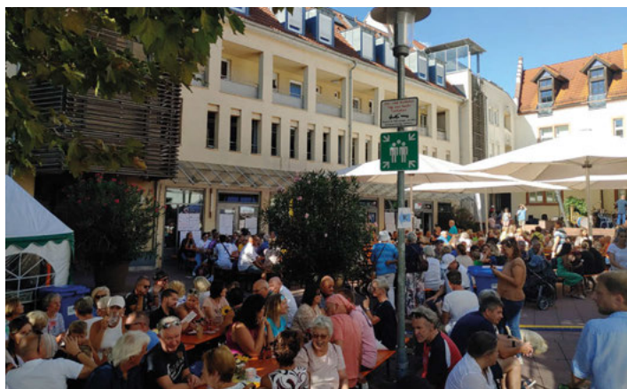
Festbetrieb am Rathausplatz

Alle Informationen über den Musikverein, die Orchester und Veranstaltungen findet ihr immer aktuell unter www.musikverein-weingarten.de .