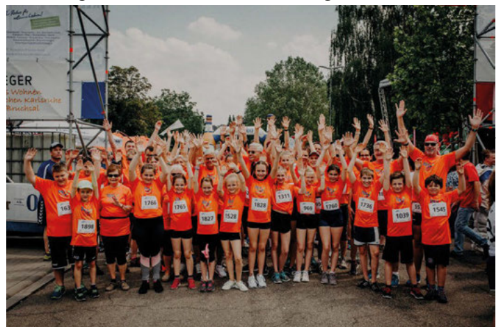
Das laufstarke TSV-Team aus dem Jahr 2019

Die virtuellen Läufe sind mittlerweile so beliebt, haben, dass B.L.U.T. e.V. in diesem Jahr einen „Hybridlauf“ anbietet. Das heißt, dass es sowohl einen Lauftag am 10. September 2022 als auch einen virtuellen Lauf vom 10. bis 24. September 2022 geben wird. Um dies für Familien und Kinder etwas attraktiver zu gestalten, bieten der TSV und die Kindergärten Am Buchenweg und Waldbrücke eine Lauf-Challenge an.