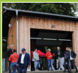
Einweihung DLRG-Boots- garage Seite 4

30. Liedernachmittag • 18.09.2022 • 16 Uhr von & mit Tenor Helmut Seidel in der Ev. Kirche