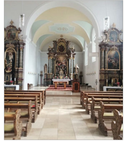
St. Magdalena - Klosterkirche

Jahren gegründet wurde und die größte romanische Kirche der Welt ist. Der Dom wurde bereits 1981 zum UNESCO Weltkulturerbe erklärt. In der Hallenkrypta fanden 4 Kaiser und 3 Kaiserinnen, 4 Könige und eine Prinzessin ihre letzte Ruhe. Ein weiteres UNESCO Weltkulturerbe ist der mittelalterliche Judenhof mit Synagoge und einem gut erhaltenem Ritualbad, genannt Mikwe, es ist das älteste seiner Art nördlich der Alpen. Der Abstieg zur Mikwe über alte ausgetretene Steinstufen war sehr anstrengend. Obwohl wir in Speyer einige Sehenswürdigkeiten besichtigt und vieles über die Geschichte gehört haben, blieb uns noch genügend Zeit, um durch die Maximiliansstraße zu spazieren und in einem gemütlichen Café einzukehren. Frohgelaunt und dankbar, dass wir so gutes Wetter hatten, traten wir die Heimfahrt an.