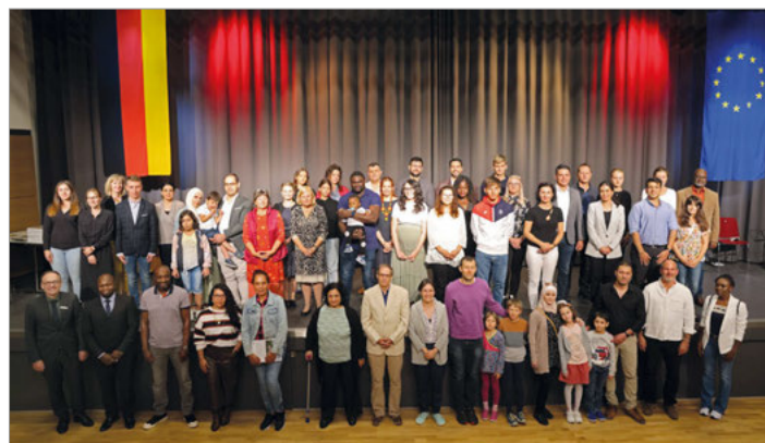
v.l.n.r.: Gemeinsamer Abend: Die Neubürgerinnen und Neubürger des Landkreises Karlsruhe kamen am Donnerstag, 15. September 2022, im Alex Huber Forum in Forst bei der Einbürgerungsfeier zusammen