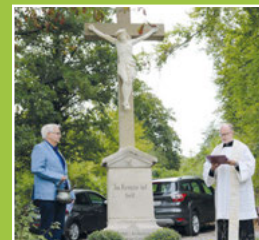
Einweihung Wegkreuz am Waldersteig Seite 4