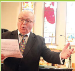
Klassische Melodien beim Benefizkonzert Seite 3