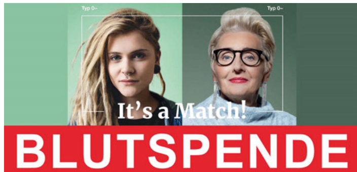
DRK Blutspendedienst |