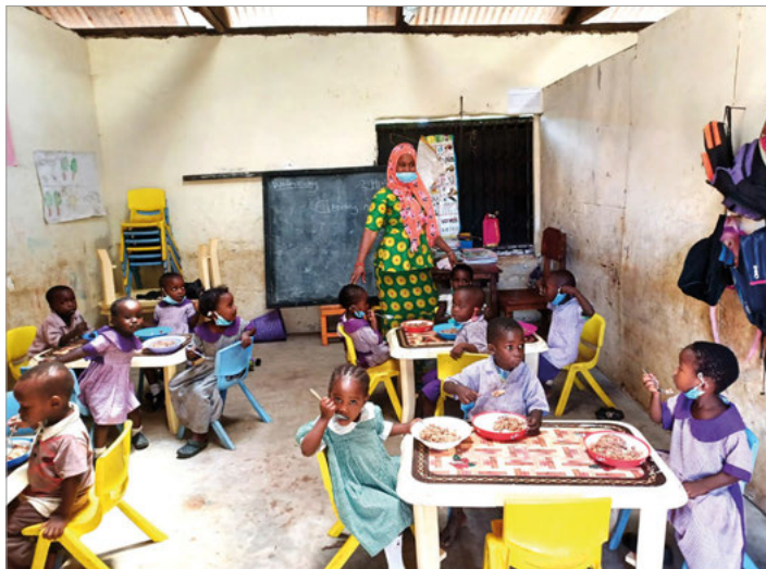
Mittagessen in der Schule

Spendenkonto: Freundeskreis DZARINO e.V. / Volksbank Bruchsal-Bretten / IBAN: DE38 6639 1200 0031 8868 05 / BIC: GENODE61BTT / Stichwort: SPENDE DZARINO