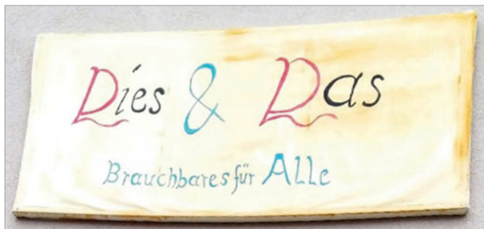
Vielen Dank and Team von "Dies und Das"!

Spiele - Input - Action - Musik - Gemeinschaft Für Jugendliche ab 13 Jahren, immer freitags 19:00 - 22:00 Uhr im anderen Keller (beim ev. Gemeindehaus)