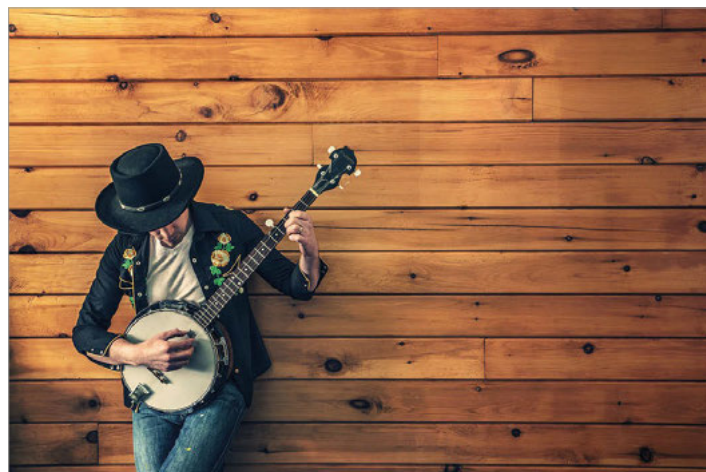
Ukulele – klein aber oho!

Wir freuen uns darauf, von Ihnen zu hören! Ihr Musikschulteam