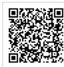
Girocode Caritassammlung 2022

Wir sind dankbar, dass wir dank Ihrer Spende oft schnell und unbürokratisch helfen können. Helfen Sie mit – ganz einfach: scannen Sie mit ihrem Smartphone und Ihrer Konto-App den Girocode ein. Sie können unsere caritative Arbeit aber auch auf herkömmlichem Weg unterstützen: mit Hilfe des Überweisungsformulars, das in alle katholischen Haushalte kam, gerne können Sie auch Ihre Spende in einem Briefumschlag in einem unserer Pfarrbüros abgeben. Vielen Dank, dass Sie so ganz konkrete Hilfen vor Ort ermöglichen!