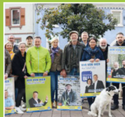
Neuaufgabe Aktion "Wir von hier" Seite 4