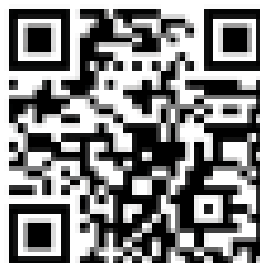
Zur Anmeldung zur Blutspende

Unser nächster Dienstabend findet am 20.09.2022 um 19:30 Uhr statt. Sprechen Sie uns bei Interesse an, ob dieser Online oder als Präsenzveranstaltung abgehalten wird.