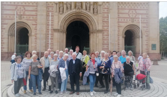
Ausflugsgruppe vor dem Speyerer Dom