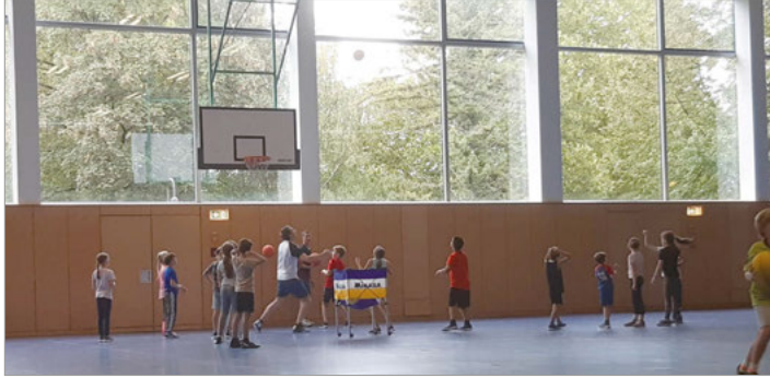
Begeisterung bereits beim 1. Basketball Training.

Bereits zum ersten Schnuppertraining kamen rund 30 Mädchen und Jungen im Alter von 6 bis 12 Jahren, um beim neu in das TSV Programm aufgenommenen Basketball Training mitzumachen.