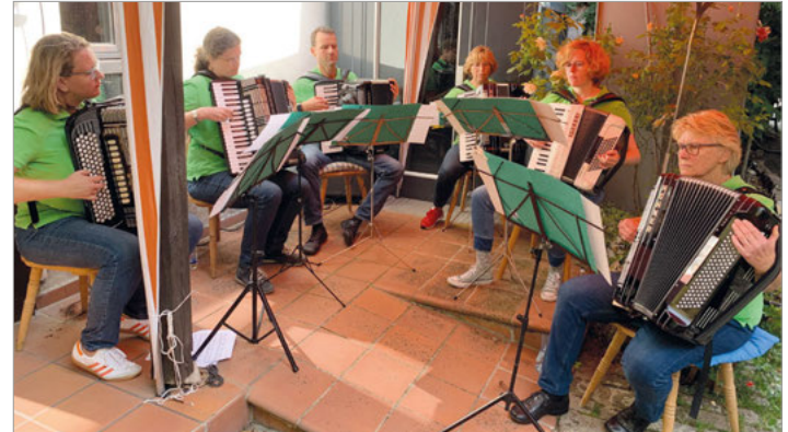
Kleine Besetzung des ASW beim Sommerfest 2022

Das meist schöne Wetter lockte zahlreiche Gäste aus nah und fern, so dass im urgemütlichen Innenhof des Fränkischen Hofes kein Platz kalt wurde.