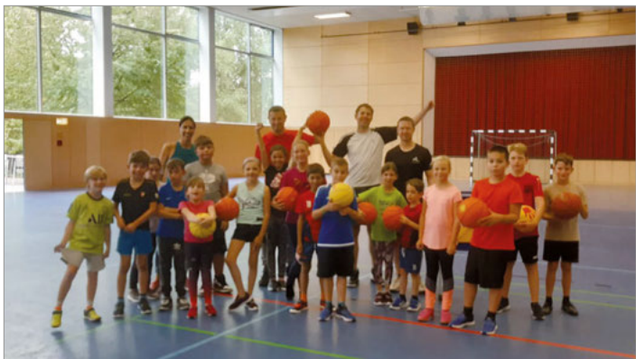
Das 1. Training hat allen richtig viel Spaß gemacht, Kinder und Trainer-Team sind happy nach Hause gegangen.

Interessierte 6 bis 12-jährige Jungs und Mädchen, die Lust auf Basketball haben können gerne mal zum Schnuppertraining vorbei schauen. Das Training findet immer montags von 16.00 (umgezogen in der Halle) bis 17.00 Uhr in der Walzbachhalle statt.