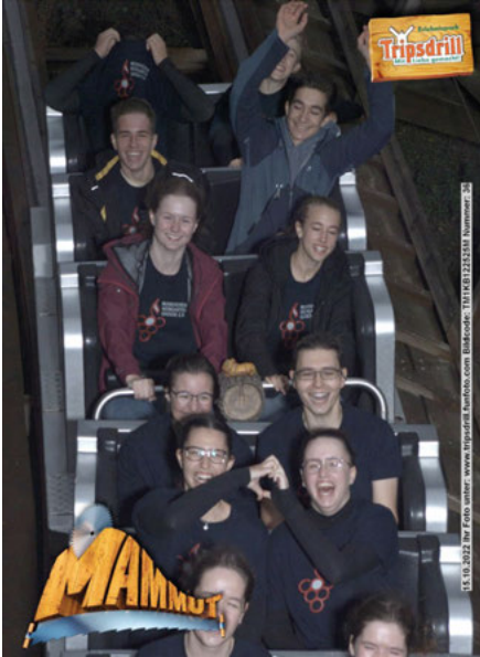
Spaß in der Achterbahn

Alle Informationen über den Musikverein, die Orchester und Veranstaltungen findet ihr immer aktuell unter www.musikverein-weingarten.de .