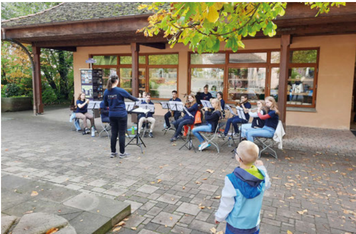
Platzkonzert vor der Altweibermühle