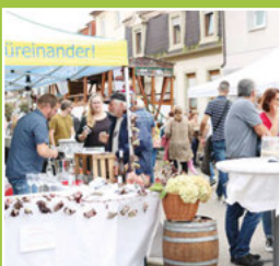
Rund um den Verkaufsoffenen Sonntag Seite 3-4

immer freitags • jetzt am 21.10. • 8-13 Uhr • Kirchplatz