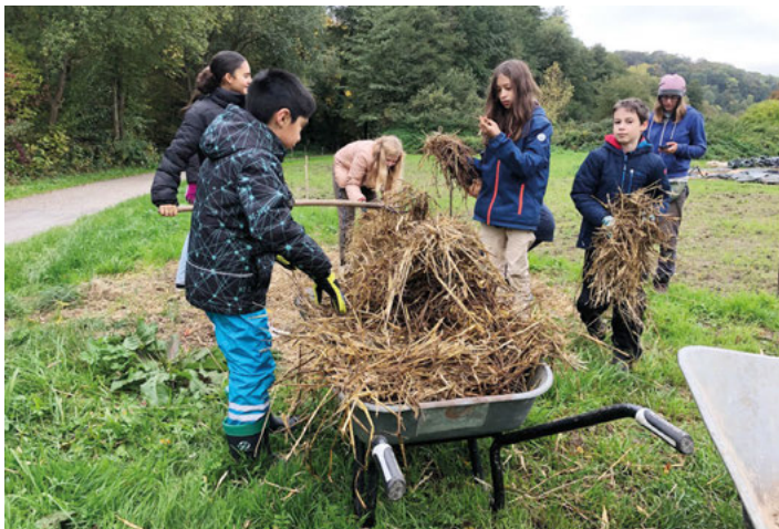
Nach dem Knoblauchstecken, wird das Beet mit Stroh bedeckt.

Zu tun gab es genug. Hier durfte und konnte jeder anpacken. Gemeinsam wurde Knoblauch gesteckt, Spinat und Rote Beete geerntet. Kohlstrünke mussten entfernt und Zucchini- und Bohnenpflanzen verkompostiert werden. Die Arbeit war abwechslungsreich, manchmal anstrengend oder auch dreckig. Die Schüler-Gärtner-Teams arbeiteten aber Hand in Hand und mit viel Begeisterung.