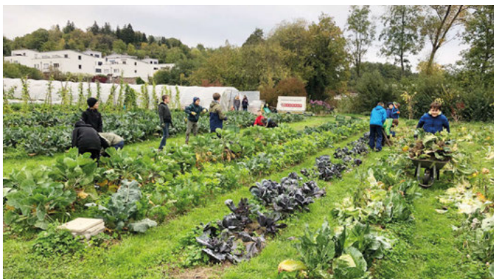
Alle waren mit großen Eifer dabei.

Das finden die Gärtnerinnen des Guten Gemüses auch. Schließlich funktioniert der Gemüseanbau im Verein nur mit der Unterstützung der Mitglieder. Jeder, der selbst schon Gemüse angebaut hat, weiß, welche Arbeit dahintersteht, aber auch welche Freuden beim Genuss der Ernte. Das GUTE GEMÜSE wächst weiter. Im neuen Erntejahr 2023/24, werden weitere Gemüseanteile frei. Wer dabei sein möchte, hat die Möglichkeit bei der Bieterrunde am 26.11.22 in der Aula der Turmbergschule in Weingarten mitzubieten und sich einen Anteil an der Ernte zu sichern. Weitere Infos unter www.gutesgemuese.de .