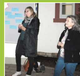
Startveranstal- tung "Jugend bewegt" Seite 5-6