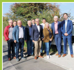
Inbetriebnahme Breitbandaus- bau Seite 6