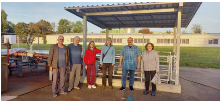
Grüne Liste besuchte die Geothermie-Anlage in Bruchsal