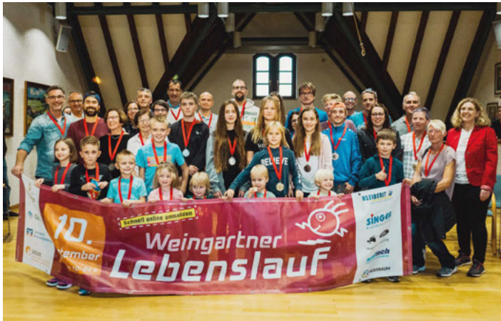
Siegerehrung 17. Weingartner Lebenslauf 2022

Eine Bildergalerie vom 17. Weingartner Lebenslauf sowie die Laufergebnisse finden Sie unter: https://www.blutev.de/17-weingartner-lebenslauf-und-3-virtueller-lauf/ Das Lebenslauf-Team freut sich schon heute auf den 18. Weingartner Lebenslauf, der am 24. Juni 2023 stattfinden wird! Förderverein blut.eV, Bürger für Leukämie- und Tumorerkrankte Tel. 07244/6083-0, E-Mail: info@blutev.de , www.blutev.de Folgen Sie uns auch auf facebook und instagram! #blutev