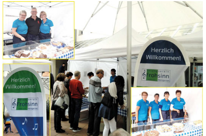
Kuchenstand des GV Frohsinn Weingarten

Der GV Frohsinn Weingarten hat sich mit einem Stand auf dem Rathausplatz am verkaufsoffenen Sonntag beteiligt. Die Nachfrage nach Kaffee und selbstgebackenem Kuchen war groß. Vielen Dank allen Mitwirkenden und allen Gästen!