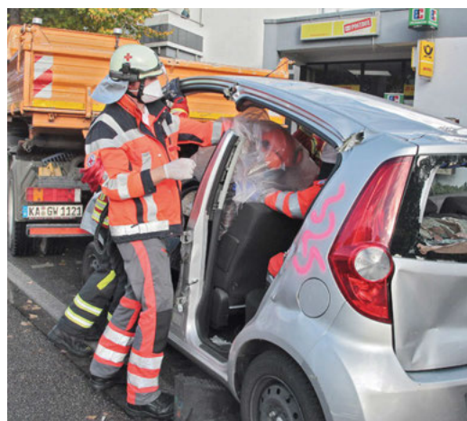
Die NOTFALLHILFE im Einsatz

Am 08.10. nahm die Bereitschaft des DRK an der Wehrhauptübung Teil. Ein Verkehrsunfall in der Kanalstraße wurde den zahlreichen interessierten Bürgern vorgestellt. In dieser Übung zeigt sich das vielfach geübte Zusammenspiel zwischen Feuerwehr und DRK. Zeitgleich trifft das erste Fahrzeug der Feuerwehr und die NOTFALLHILFE ein.