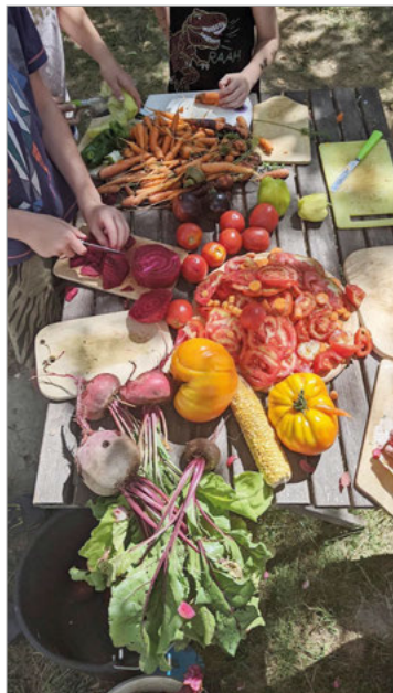
Bunt und schmackhaft ist der Sommer auf dem Acker der SoLaWi.

Die Gärtnerinnen arbeiten mit langsam wirkenden organischen Düngern wie Mist und Kompost. Die Wertschöpfungsketten erfolgen beinahe ausschließlich in der Region, das macht die SoLaWi unabhängig vom großen Markt und deren Preisen. Dieser Umstand macht das GUTE GEMÜSE im hohen Grade resilient, krisenfest, preisstabil, wertvoll und ernährungssouverän. Die nächste Einstiegsmöglichkeit ist bei der Bierrunde am 26.11.2022 in der Aula der Turmbergschule in Weingarten von 15-17 Uhr. Im kommenden Erntejahr kann die SoLaWi wachsen und mehr Menschen die Möglichkeit geben mitzumachen. Das Startgebot ist aktuell bei 80€ pro ganzem Anteil, was in etwa dem Gemüsebedarf einer Kleinfamilie entspricht. Halbe Anteile oder eine 14-tägige Abholung ist ebenso möglich. Am 17.11.22 gibt es die Möglichkeit an einem Online-Infoabend den Verein, die Anbaumethoden, erste Mitglieder kennenzulernen und Fragen zu stellen. Den Link zur Sitzung und mehr Infos dazu gibt es auf www.gutesgemuese.de .