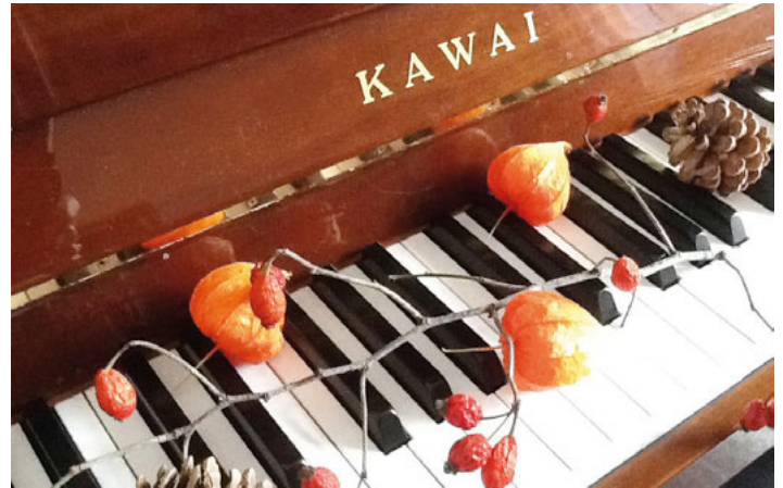
Laut und leise, wie das Piano-Forte!

schon lange. Deshalb gibt es in unserer Musikschule die breite Vielfalt: nicht nur bei den Tönen, sondern vor allem bei unseren Instrumenten. Schaut mal auf unserer Homepage: www.musikschule-hardt.de . Da findet Ihr unsere Angebote und viele Infos zu unseren Lehrkräften und zu Aktionen. Wir geben natürlich auch gerne selbst Auskunft unter 07249/1859 (auch AB) oder per Mail unter sekretariat@musikschule-hardt.de . In diesem Sinne: Fröhlichen Herbst! Wir freuen uns auf Euch!