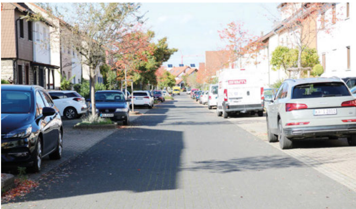
Auch die Wiesenstraße ist Teil des Mobilitätskonzepts, das auch neue Parkordnungen umfasst