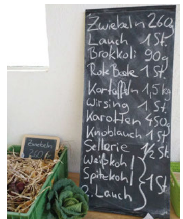
Beispielmenge eines Ernteanteils Ende Oktober.

Hohe Inflation und steigende Preise an den Tanksäulen, bei der Stromrechnung und im Supermarkt sorgen aktuell für Verunsicherung. In einer solidarischen Landwirtschaft, wie das GUTE GEMÜSE eine ist, trägt eine Gruppe von Menschen gemeinsam die Verantwortung für erzeugten Lebensmittel und die Form der Landwirtschaft bzw. der Anbauweise. Wie reagiert ein solches kooperatives Ernährungssystem auf eine Krisenzeit? Ist es anpassungsfähiger, erweist es sich als resilienter? Was genau ist anders bei der SoLaWi als bei einem Hofladen oder