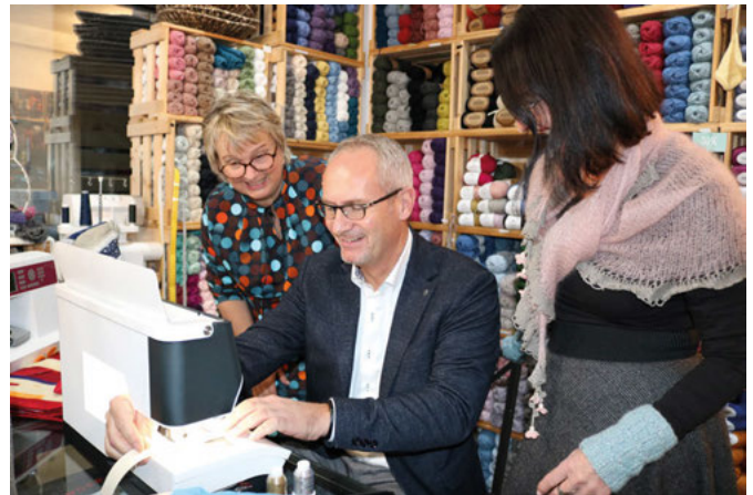
Ehrensache, dass der Bürgermeister gleich probenähen will