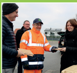
Besichtigung des Wertstoffhofes Seite 3 - 4