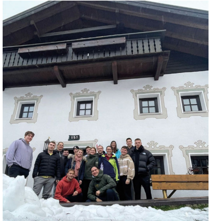
Coole Truppe bei der ersten SnowBusters18:27 Tour