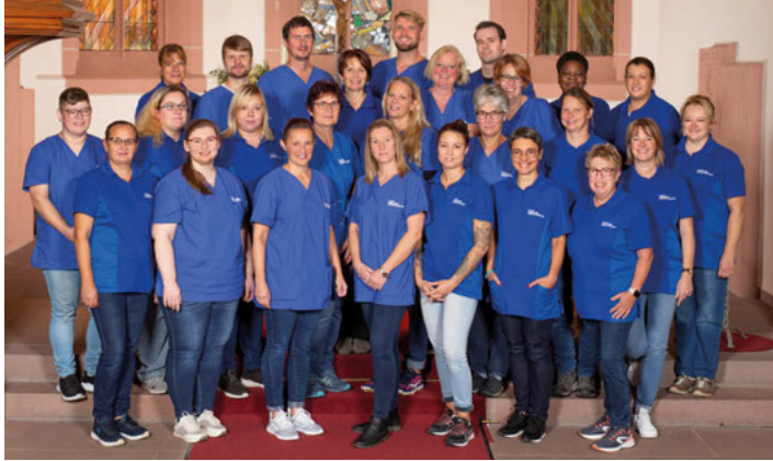
Team Sozialstation Stutensee-Weingarten

Wir bedanken uns herzlich für die vertrauensvolle Zusammenarbeit bei unseren Patienten*innen, Arztpraxen sowie allen Kooperationspartnern.