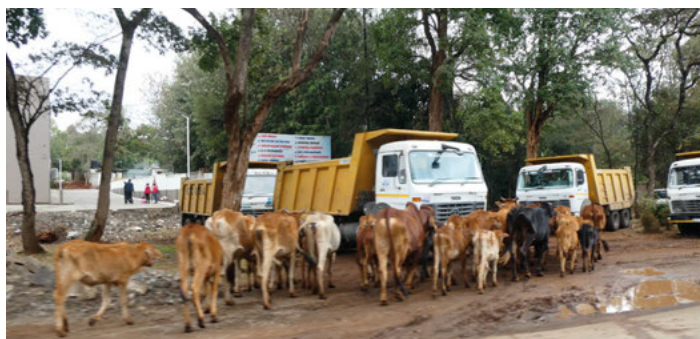
Kuhherde mitten in der Stadt

In den folgenden Wochen werde ich die verschiedenen Schwerpunkte der Arbeit genau darlegen, damit Sie sich ein deutliches Bild machen können.