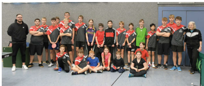
Gemeinsames Gruppenbild nach erfolgreichen Vereinsmeisterschaften

Die Jugendabteilung hat sich sehr über die rege Teilnahme gefreut und dankt allen, die uns bei der Durchführung unterstützt haben. (ew.)