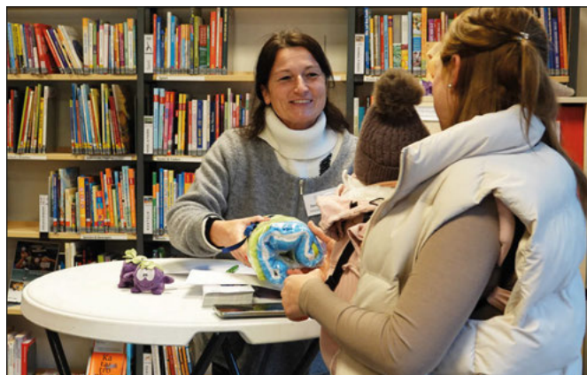
Beim Einlass gab es ein Begrüßungsgeschenk

Ein gelungener Nachmittag ging zu Ende und die Gemeindeverwaltung dankt den Eltern für ihren Besuch, der GemeindeBibliothek für die Überlassung der Räumlichkeit sowie dem Auf- und Abbau-Team für den reibungslosen Ablauf.