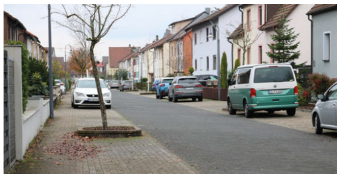
Die Wiesenstraße soll verkehrsberuhigter Bereich werden. Das erfordert keine definierten Gehwege mehr. Fußgänger dürfen den gesamten Straßenraum nutzen.

Im Weiteren werde so vorgegangen, dass die entsprechenden Markierungen eingezeichnet werden, danach die Beschilderung „Parken nur auf gekennzeichneten Flächen“ aufgestellt wird und erst danach das neue Konzept seine Gültigkeit erlangt. Das Ergebnis der Bürgerinformation wird Oliver Russel dem Gemeinderat vortragen.