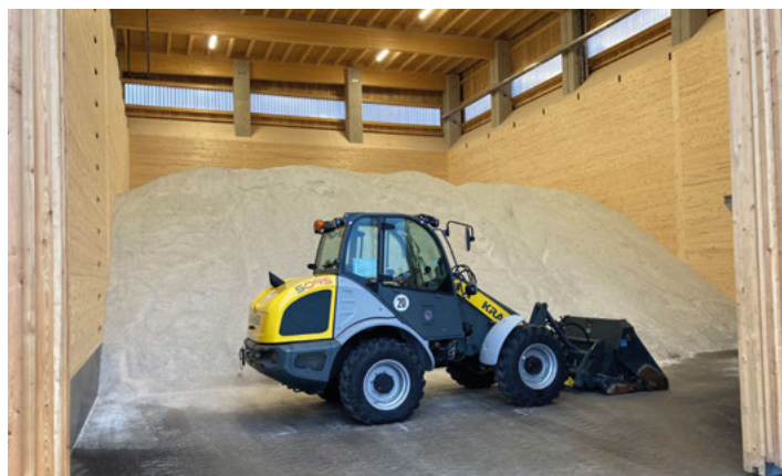
In der neuen Salzhalle der Straßenmeisterei Bruchsal liegen über 1.300 Tonnen Salz für den Winterdienst bereit.

Von winterlicher Landschaft ist derzeit im Landkreis Karlsruhe noch nichts zu sehen. Doch um bei Winterbruch die Straßen auch kurzfristig von Schnee und Eis befreien und damit sicher halten zu können, sind die Straßenmeistereien bereits vorbereitet. Mit rund 2.500 Tonnen eingelagertem Trockensalz und etwa 100.000 Litern Natriumchlorid-Lösung ist der Landkreis auch in dieser Saison ausreichend gerüstet. In seiner Zuständigkeit liegen 790 Kilometer Strecke: Das sind 190 Kilometer Bundesstraße, 320 Kilometer Landesstraße und 280 Kilometer Kreisstraße. Einige Abschnitte werden von der Stadt Karlsruhe und angrenzenden Landkreisen betreut.