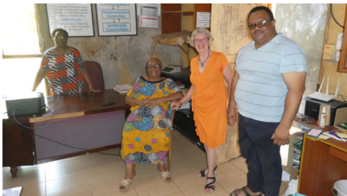
Herzlicher Empfang im DZARINO-Büro