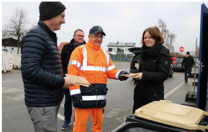
Papiertüten für den Biomüll: Das Bringsystem des Biomülls ist der Renner im Landkreis.