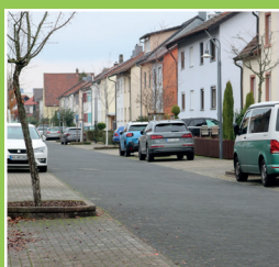
Mobilitätskon- zept geht weiter Seite 4