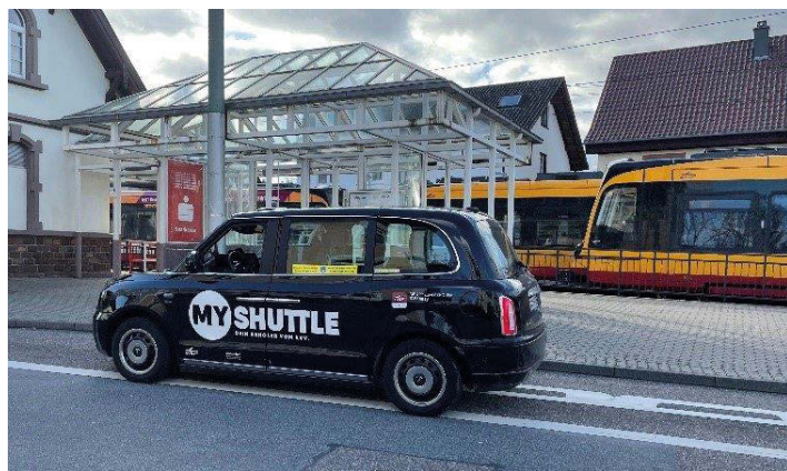
Das MyShuttle Karlsbad, hier am Bahnhof Langensteinbach, fährt auch den Bahnhof Kleinsteinbach an.

Der Bahnhof Kleinsteinbach ist in den Abendstunden und am Wochenende an den MyShuttle-Verkehr der Gemeinde Karlsbad angebunden. Er ist einer der zahlreichen virtuelle Haltestellen des neuen „London-Taxis“, das Pfinztal mit den Karlsruher Ortsteilen verbindet. Der On-Demand-Verkehr (Fahrten nach Bedarf) MyShuttle wurde jetzt auch in Karlsbad eingeführt und ersetzt seit Dezember 2021 das bisherige Anrufsammeltaxi (AST). Ein On-Demand-Verkehr ist eine Art Shuttleservice für mehrere Personen, der in Karlsbad in den Abendstunden und am Wochenende fährt und dabei 222 virtuelle Haltestellen bedient. Der Fahrgast äußert seinen Fahrtwunsch über die App KVV.easy, gibt seinen Standort an und bucht die Fahrt. Das geht bis zu 24 Stunden im Voraus oder kurzfristig. Es sind auch telefonische Fahr anmeldungen möglich.