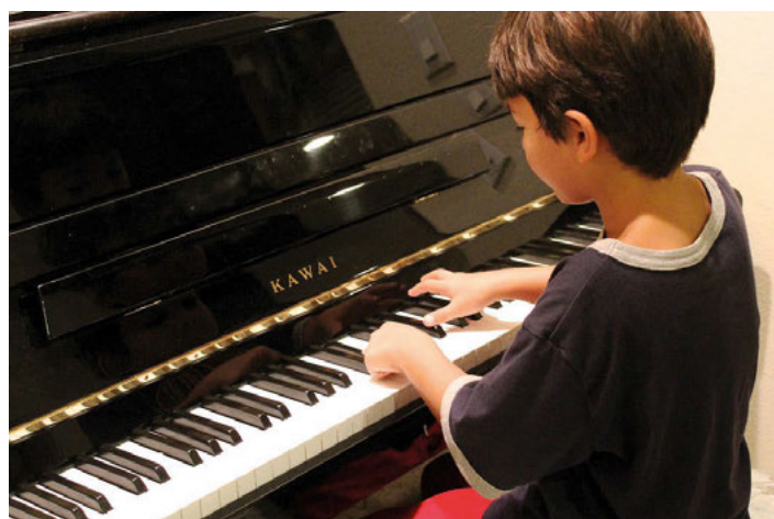
Einfach mal probieren!