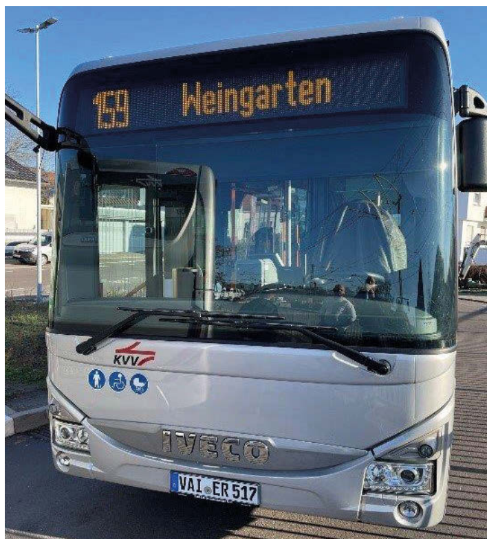
Der Bus 159 bei der Abfahrt am Bahnhof Berghausen über Jöhlingen nach Weingarten

Die bisher rein dem Schülerverkehr dienende Linie 159 wurde zur vollwertigen Linie ausgebaut und fährt ab Berghausen über Jöhlingen bis Weingarten. Die bisherigen zwei Schülerfahrten von und nach Wössingen sind in die Linie als zusätzliche Fahrten integriert. Seit Dezember 2021 fährt die Linie 159 von Bahnhof Berghausen über Jöhlingen bis zum Bahnhof nach Weingarten. Damit wurde mit der zwischen 5.30 und 20.00 Uhr im Stundentakt verkehrenden Buslinie, eine regelmäßige Anbindung zwischen den Ortschaften geschaffen. Somit können auch Berufspendler zukünftig zwischen Berghausen und Weingarten den ÖPNV nutzen. In Weingarten freut man sich besonders, dass nun auch das Seniorenzentrum „Haus Edelberg“ in der Jöhlinger Straße eine regelmäßige Anbindung an den ÖPNV hat. Am Bahnhof Berghausen besteht Anschluss insbesondere an die Buslinie 151 von und nach Wöschbach.