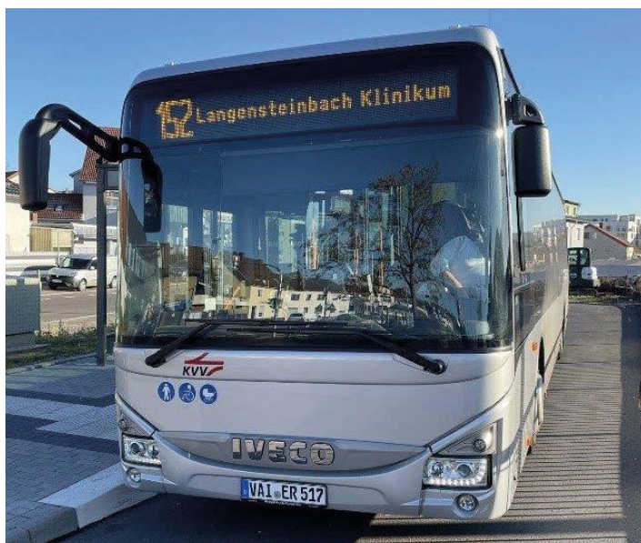
Der Bus 152 am Bahnhof Berghausen bei der Abfahrt nach Langensteinbach

Als weitere Ergänzung führt jetzt die Buslinie 152 von Montag bis Freitag durch Pfnztal. Die seit vielen Jahren bestehende Busverbindung zwischen Langensteinbach und dem Bahnhof Kleinsteinbach wurde im Dezember 2021 bis zum Bahnhof Berghausen verlängert. Dort besteht tagsüber ein 10-Minuten-Anschluss an die Stadtbahnlinien S5 und S51 von und nach Karlsruhe. Dadurch ergeben sich jetzt symmetrische Anschlüsse mit der S11/S12 in Langensteinbach und der S5/S51 in Berghausen.