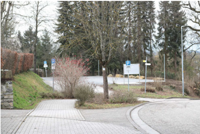
Neu angelegter Parkplatz am Steigweg

Die Parksituation rund um den Friedhof hat sich in den letzten Monaten ganz erheblich verbessert. Insgesamt stehen jetzt vier Parkplätze in verschiedenen Richtungen zur Verfügung, von denen die Besucher das Friedhofsareal mit wenigen Schritten erreichen können: Die Fläche neben dem Steigweg hat der gemeindliche Bauhof vor kurzem geebnet und mit Rasengittersteinen befestigt. So sind zehn weitere Parkplätze entstanden, alle gleichermaßen gut anfahrbar sind. Gleich dahinter befindet sich ein zweiter