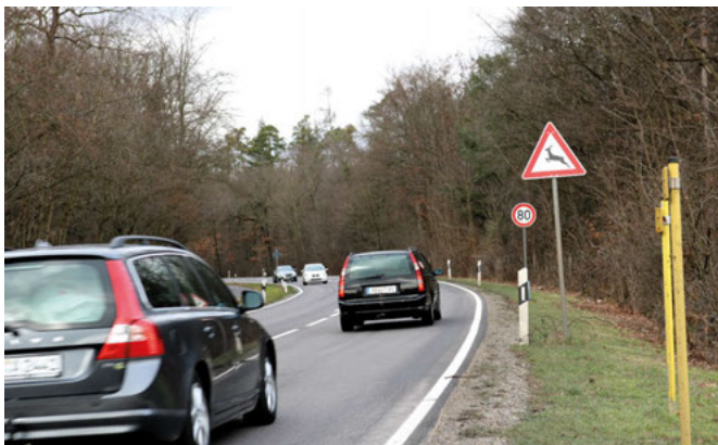
Auf der Strecke zwischen Blankenloch und dem KIT

Autofahrer auf ihrem Weg zur und von der Arbeitsstätte KIT passieren es zwangsläufig: Das Verkehrsschild „Wildwechsel“ an der L559. Queren hier tatsächlich häufig Wildtiere oder ist das nur eine prophylaktische Warnung für den Eventualfall, der sowieso nicht eintritt?