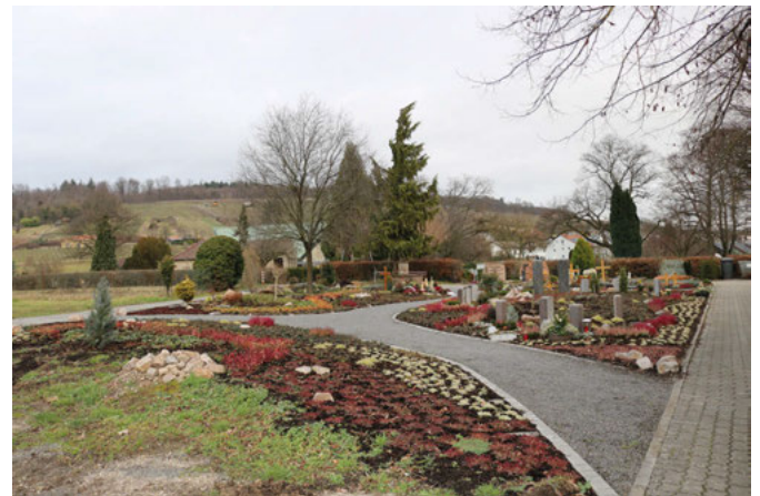
Ein weiteres gärtnergepflegtes Grabfeld

Die Rodungsarbeiten sind sehr umfangreich. Eine lange Hecke wurde entlang der Urnenreihe hinter dem östlichen Eingangstor entfernt und eine weitere große Hecke im nördlichen Teil des Friedhofs. Hier wurde zwischenzeitlich eine zusätzliche Erweiterung des gärtnergepflegten Grabfeldes in zwei Teilen angelegt. Das erste gärtnergepflegte Grabfeld entstand bereits in 2015. Die Angehörigen des Verstorbenen schließen einen Vertrag mit der Badischen Friedhofsgärtnerei über eine Laufzeit von 20 Jahren und brauchen sich danach um keine weitere Grabpflege mehr zu kümmern. In 2018 wurde es um ein zusätzliches Feld erweitert. Nun kommen mehrere Felder hinzu.