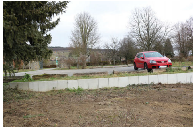
Zwischen Wartturm und Rosentor

Die Parksituation rund um den Friedhof hat sich in den letzten Monaten ganz erheblich verbessert. Insgesamt stehen jetzt vier Parkplätze in verschiedenen Richtungen zur Verfügung, von denen die Besucher das Friedhofsareal mit wenigen Schritten erreichen können: Die Fläche neben dem Steigweg hat der gemeindliche Bauhof vor kurzem geebnet und mit Rasengittersteinen befestigt. So sind zehn weitere Parkplätze entstanden, alle gleichermaßen gut anfahrbar sind. Gleich dahinter befindet sich ein zweiter