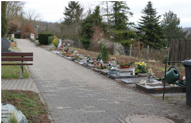
Rodung entlang der Urnengrabreihe hinter dem östlichen Eingangstor

Wie bereits berichtet, haben die Thujahecken auf dem Friedhof – und nicht nur dort – unter den heißen und trockenen Sommern 2018 bis 2020 gelitten. Der Trockenstress machte sie anfällig für Pilzkrankheiten und so kam es, dass die einst stattlichen grünen Hecken in relativ kurzer Zeit dürr und ziemlich unansehnlich braun wurden. Die Trockenstresssymptome zeigen sich europaweit und sind nicht bekämpfbar, sagte Bernd Wasser, Leiter der Grünabteilung des Bauhofs. Es sei das Beste, sie komplett zu entfernen und neue, andere Gehölze anzupflanzen. So geschah es. Seither werden die abgängigen Hecken sukzessive gerodet und ein Bodenaustausch vorgenommen. Alternativen sind Eiben ( Taxus baccata ), Rote Glanzmispel ( Photinia fraseri ) oder Feldahorn ( Acer campestre ).